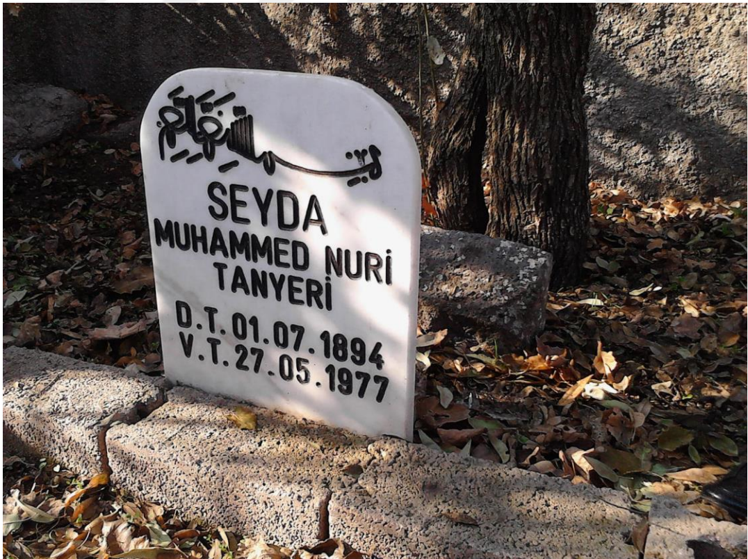
Wêne 1.4: Gora Mela Muhammed Nûrî