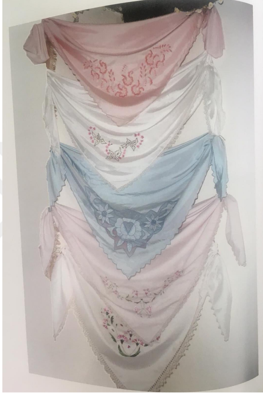
Fotoğraf 3- Kırım Tatar Kadınlarının Çeyiz Sergilerinden Bir Fotoğraf