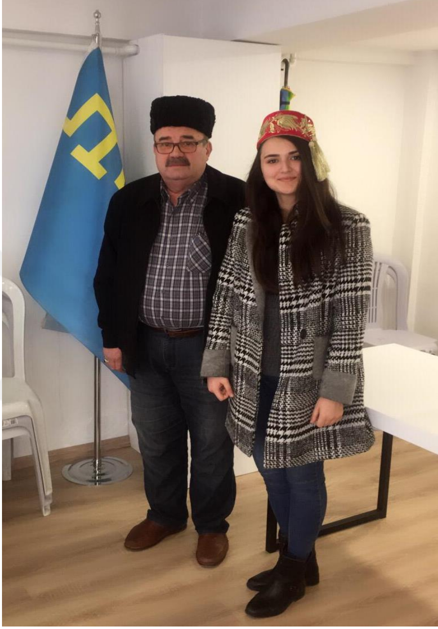
Fotoğraf 10- Kırım Tatarlarına Ait Erkeklerin Kullandığı Kalpak ve Kadınların Kullandığı Süslü Fes