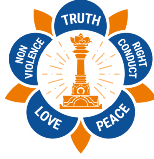
Şekil 7: SSIO'nun Logosu.

Örgütün logosu yukarıda da görüldüğü gibi bir beş yapraklı lotus çiçeğidir. Çiçeğin her bir yaprağında ise insanî değerler olarak kabul edilen Sathya Sai Baba'nın öğretisindeki beş önemli prensip “Sevgi, Hakikat, Doğruluk, Barış ve Şiddetsizlik” yazmaktadır. SSIO'nun logosunun ortasında sarva dharma (dünya dinleri) stupa adı verilen ve üzerinde bir nilüfer çiçeği bulunan Sathya Sai'nin Prasanthi Nilayam tapınağında bulunan sütuna benzer uzun bir sütun da görülmektedir. Sarva her, hep, bütün, tüm anlamlarına gelmektedir, dharma ise dini ve ahlaki erdem, sistem, doktrin, yasa, dürüstlük, ahlak, erdem, görev, Tanrı'nın emirleri, davranış kuralları anlamına gelir. 332