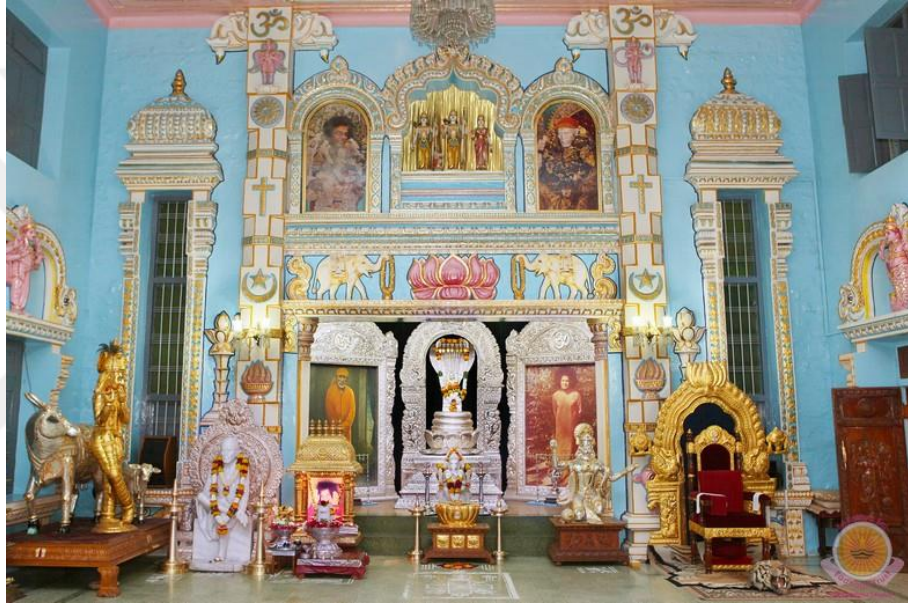
Şekil 14: Prasanthi Nilayam'ın Merkezi. 1949'da inşa edilen dua salonu. Bir çok manevi aktivite bu salonda düzenlenmektedir. 361