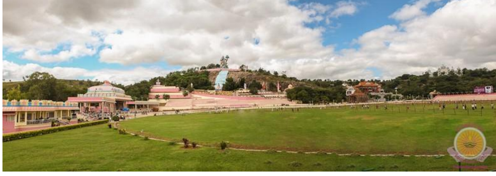
Şekil 13: Sri Sathya Sai Hill Manzara Stadyum 360