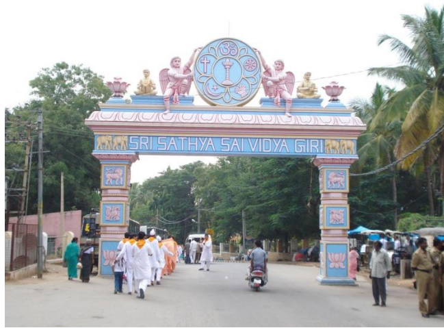
Şekil 3: SSIO'nun Logosu 316