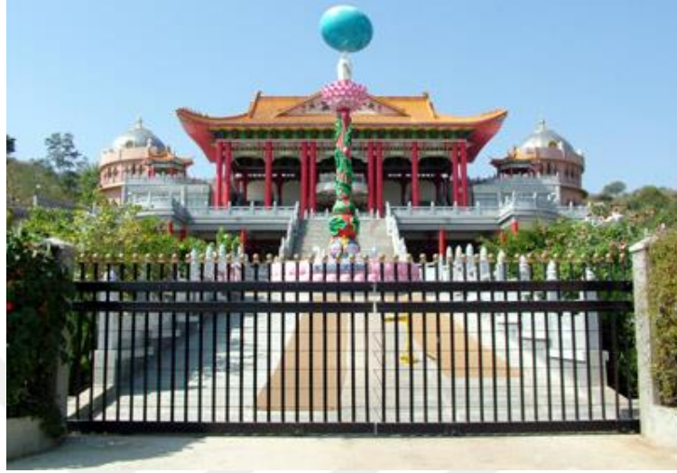
Şekil 9: Chaitanya Jyothi Müzesi 356