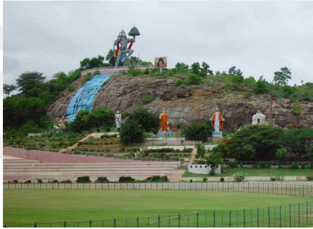
Şekil 4: Sri Sathya Hill Manzara Stadyumu. 318

Sai Baba'nın doğduğu evin yerine bugün Tanrı Şiva adına bir tapınak yapılmıştır. Tapınak binasının her iki yanında yüksek şahsiyetli kişilerin heykelleri yer almaktadır. Bunlardan biri de Hz. İsa'nın çarmıhtaki heykelidir. Buda müritleriyle, Zerdüşt alevlerin içinde müritleriyle birlikte heykelleri yapılmıştır. İslam dinin de Hz. Muhammed'in resmini yapmak yasak olduğundan sadece ay yıldızı gösteren bir tablo yer almaktadır.