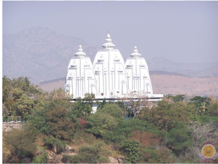
Şekil 10: Sanathana Samskuriti Müzesi 357