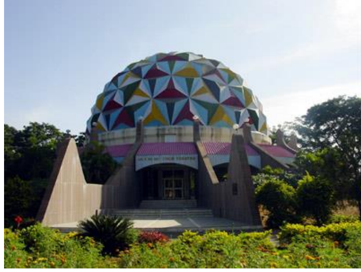
Şekil 11: Sri Sathya Sai Uzay Tiyatrosu (Planetarium) 358