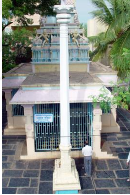
Şekil 12: Sathya Sai Baba'nın Doğum Yeri ( Shivalayam) 359