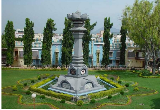
Őekil 5: Dinlerin Birliđini Gsteren Stun. 319

Satha Sai Baba'nın inananlarına gre bu stunun eŐmerkezli halkalarının yoga ya da Tanrı ile birliđi temsil etmekte, halkaların yaprakları diređin tepesinde bulunan "kalbin nilferinin" aılması iin gereken yoga disiplinin aŐamalarını gstermektedir. İ aydınlanma alevi nilferin ieđinin merkezindedir. Tıpkı lotus bitkisinin suda yaŐadıđı ancak kirletmediđi gibi, biz de dnyada yaŐamalıyız ama ona zarar vermemeliyiz. 320