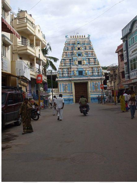
Şekil 2: Prasanthi Nilayam Tapınağının Ana Girişi 315

Tapınağa ulaşım, konaklama, tapınağın içerisinde bulunan tüm binalarla ilgili bilgilere ve görsellere http://srisathyasai.org.in/ isimli internet sitesinden ulaşılabilmektedir. Çalışmanın ekler kısmına da görseller eklenmiştir.