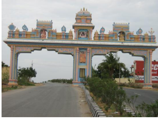
Şekil 6: Prasanthi Nilayam'ın Girişi. 322

Prasanthi Nilayam tapınağında günlük programı şöyledir: