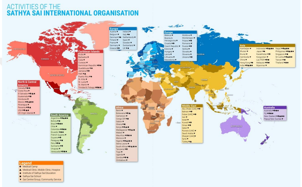
Şekil 8: SSIO'nun Dünya Genelindeki Faaliyetlerinin Gösterildiği Harita. 355

Sathya Sai Uluslararası Organizasyon'un Dünya Genelinde 2017- 2018 Yılları Arasında Yapmış Olduğu Yıllık Faaliyet Raporu