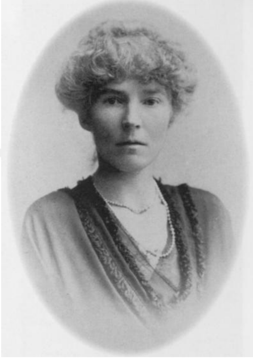
Resim 5: Gertrude Bell (53)