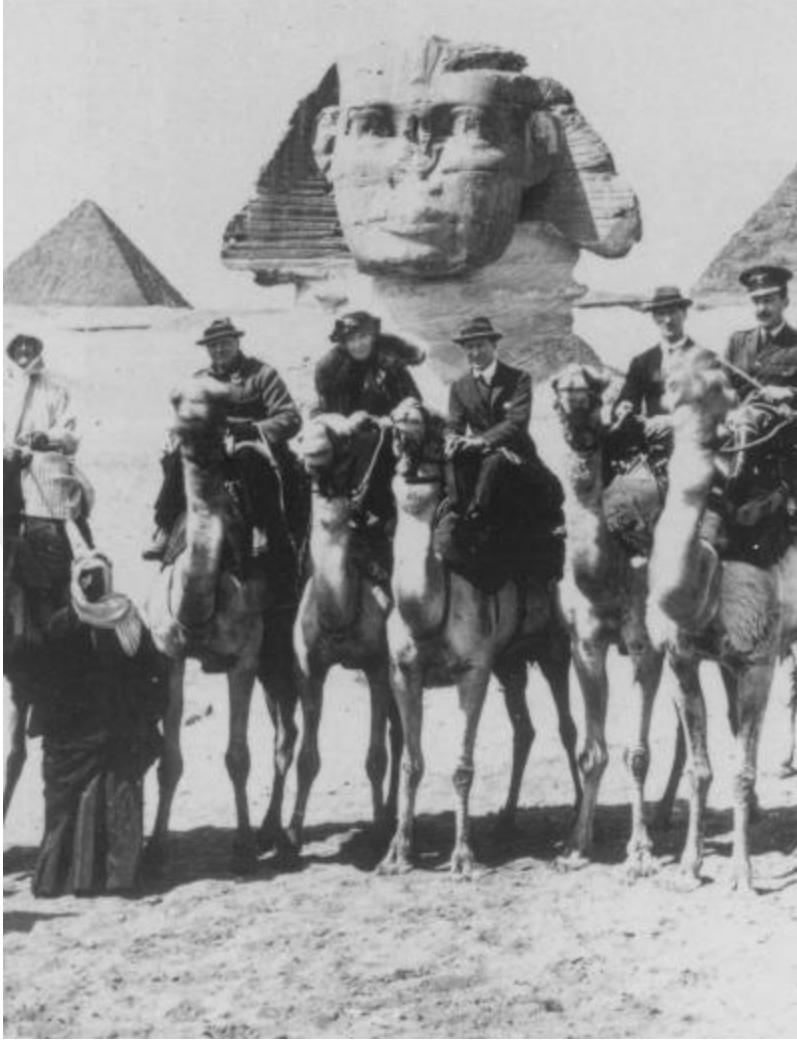
Resim 16: Churchill ile Kahire Konferansında Giza gezisi(1921).