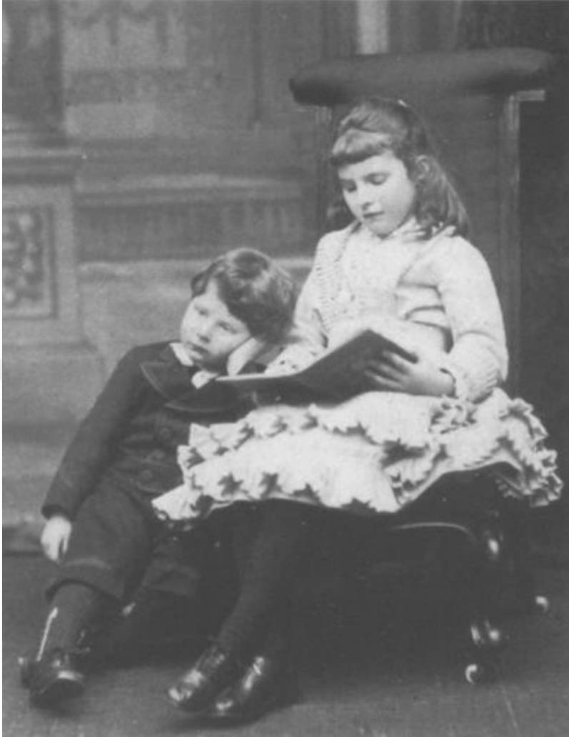
Resim 3: Gertrude Bell (8) ve kardeři Maurice