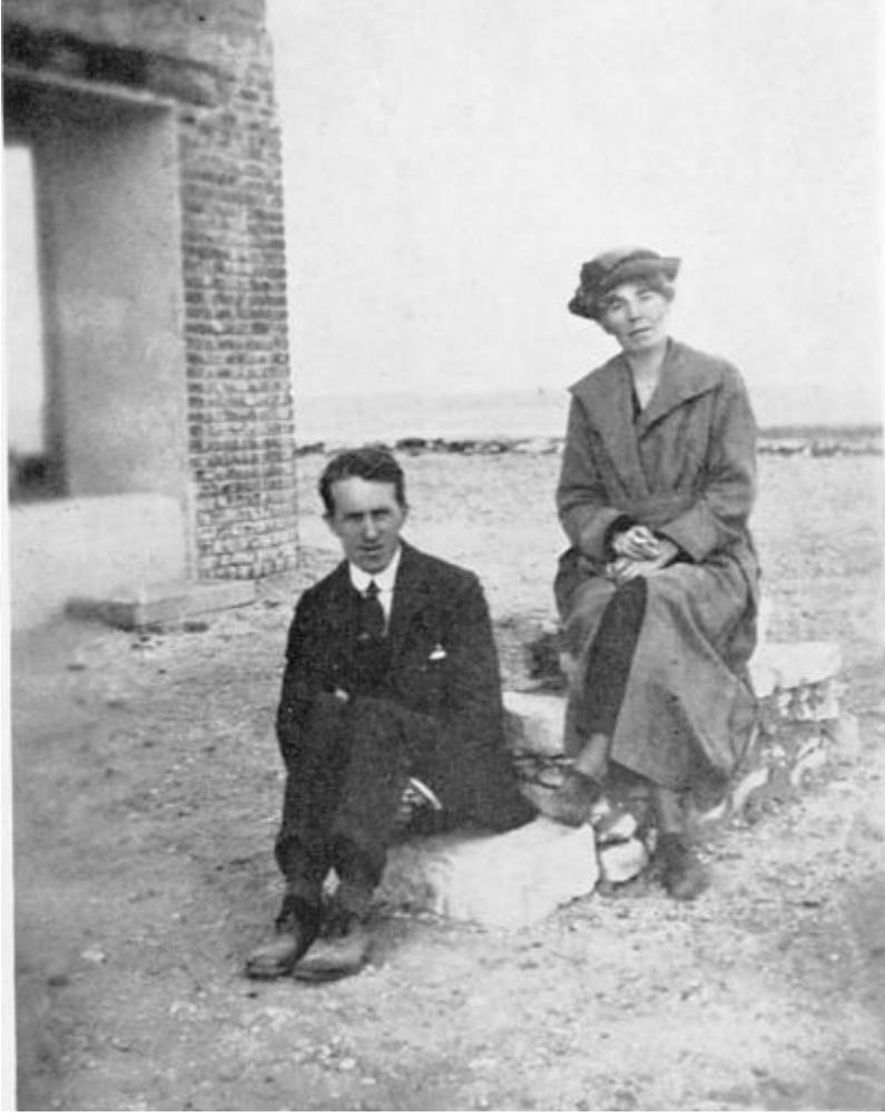
Resim 11: Gertrude Bell (41) ve T. E. Lawrence (1909 Karkamış)