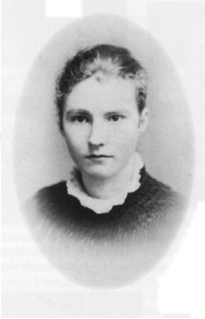
Resim 4: Gertrude Bell (16)