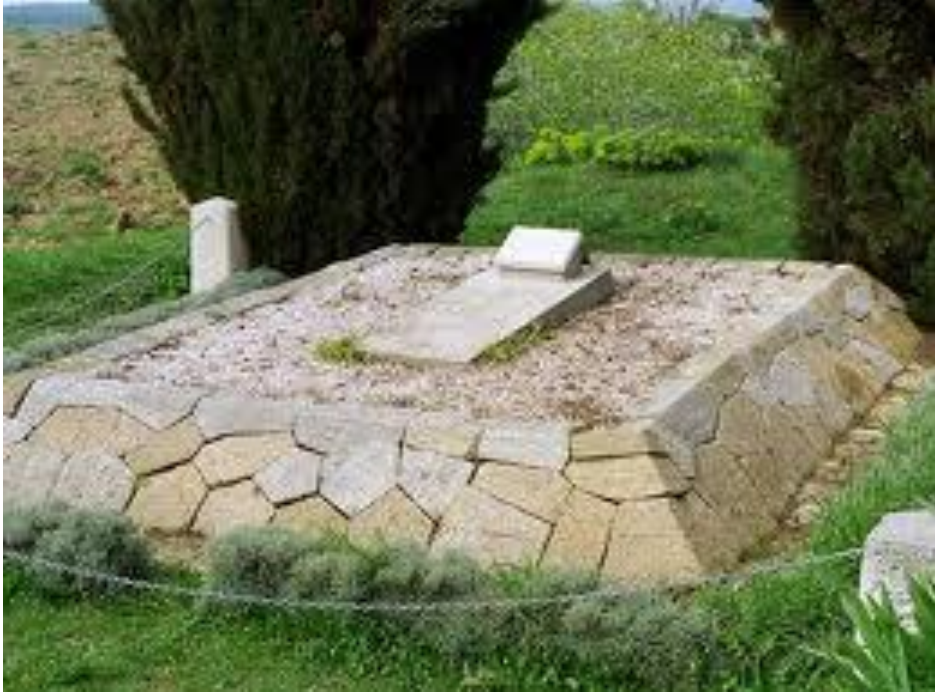
Resim 8: Gelibolu'da bulunan Wylie'nin mezarı yakın plan

Jonathan Brown, Homeric Sites Around Troy , Canberra 2017, p. 276.