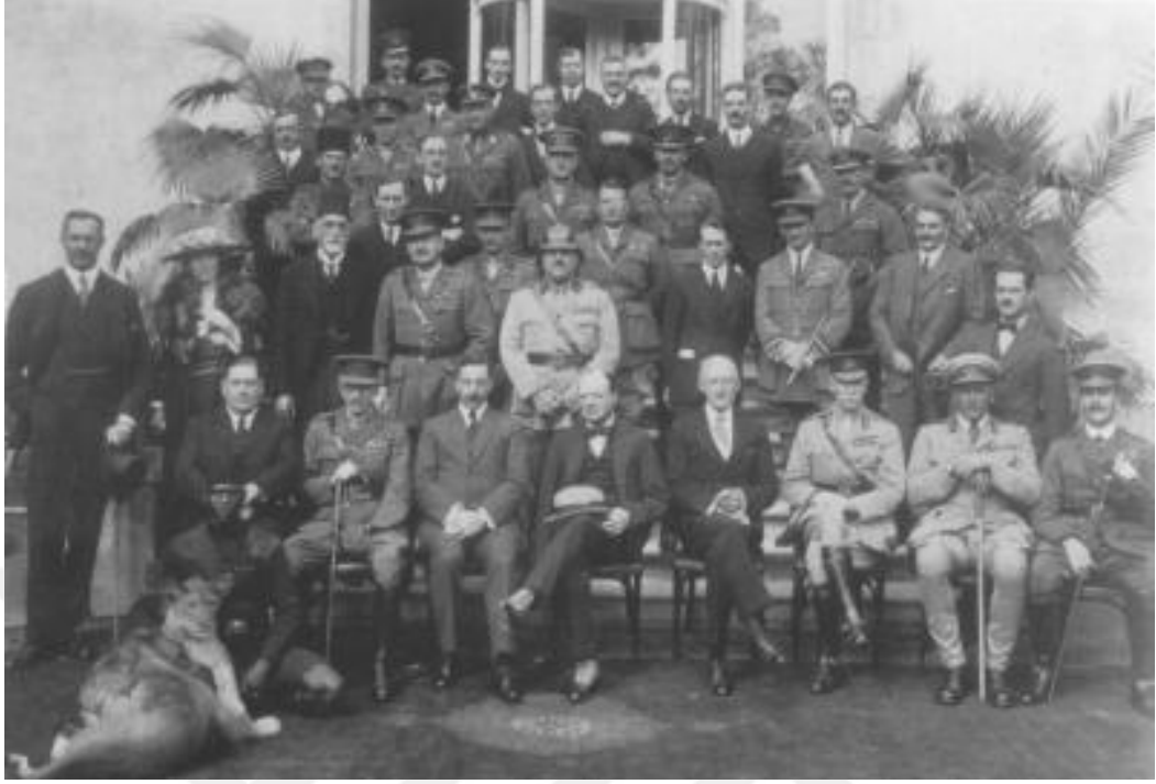
Resim 17: 1921 Kahire Konferansı Delegasyonu: Kırk Haramiler