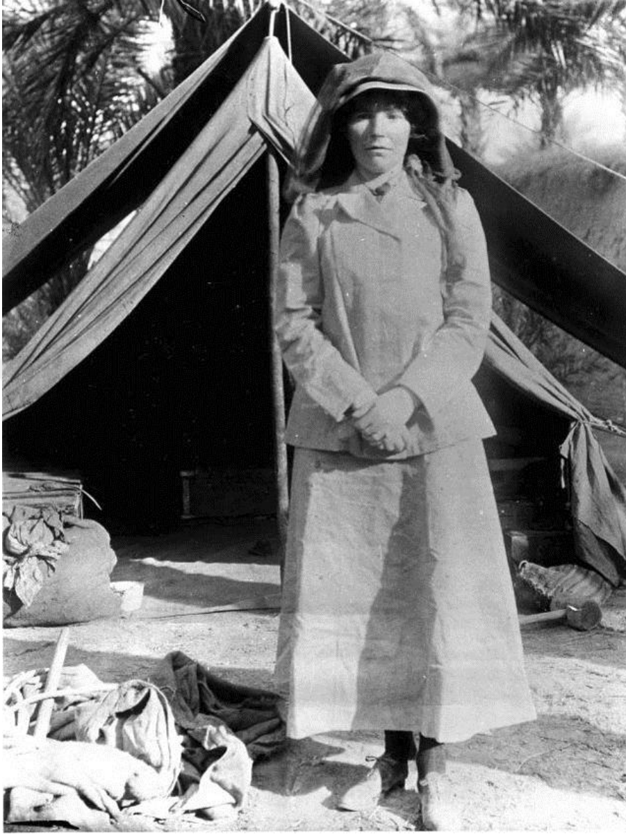
Resim 9: Gertrude Bell (41) Şitate vahasında (1909)