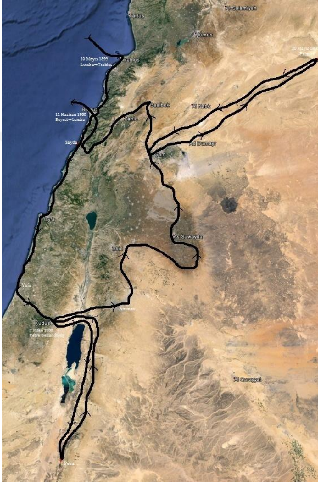
Harita 1: I. Ortadoğu Gezisi, 1899-1900