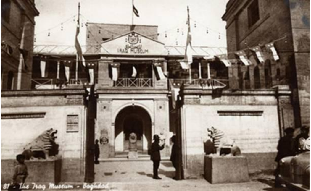
Resim 18: Bağdat Arkeoloji Müzesi