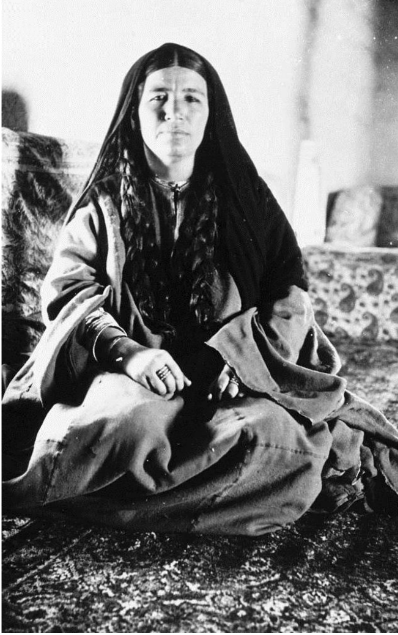
Resim 13: Bell'i Hayyil'de ağırlayan Türkiye (1914)