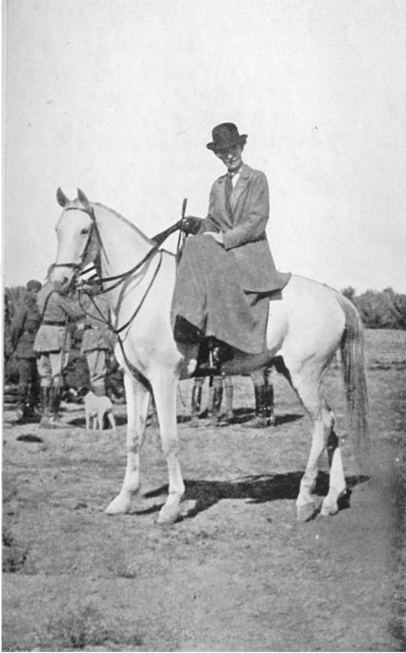
Resim 15: Gertrude Bell, Baĝdat 1917