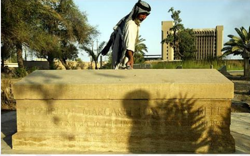
Resim 19: Bell'in Baĝdat'ta bulunan mezarı.