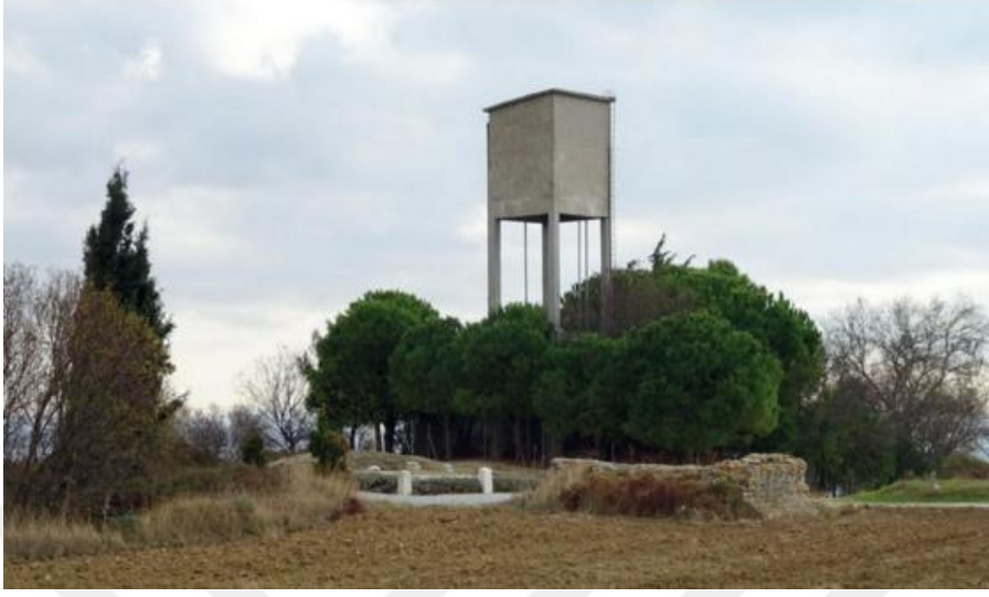
Resim 7: Gelibolu'da bulunan Wylie'nin mezarına uzaktan bakış