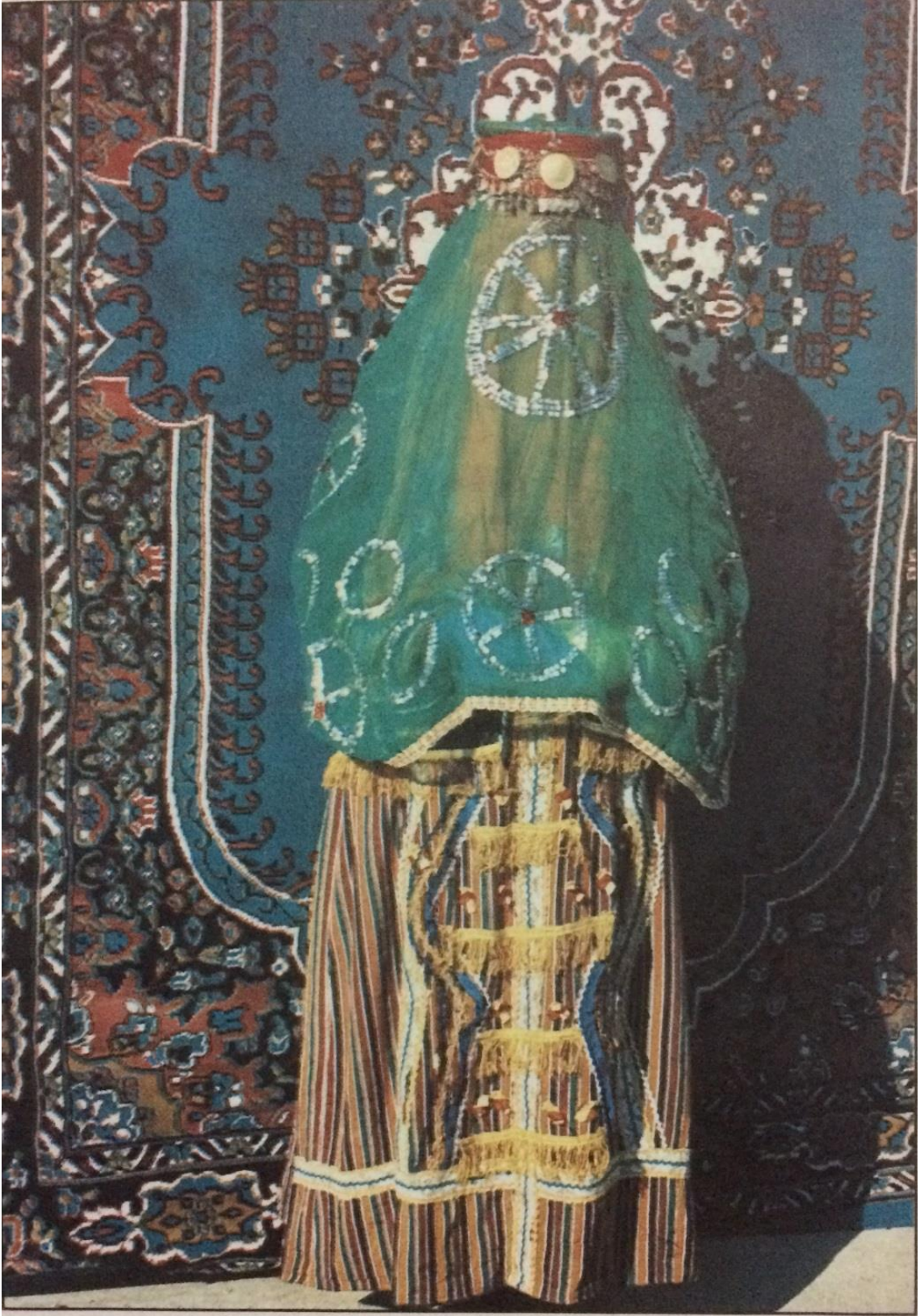
Düzağaç Geleneksel Gelin Duvağı (Kımk, 1998).