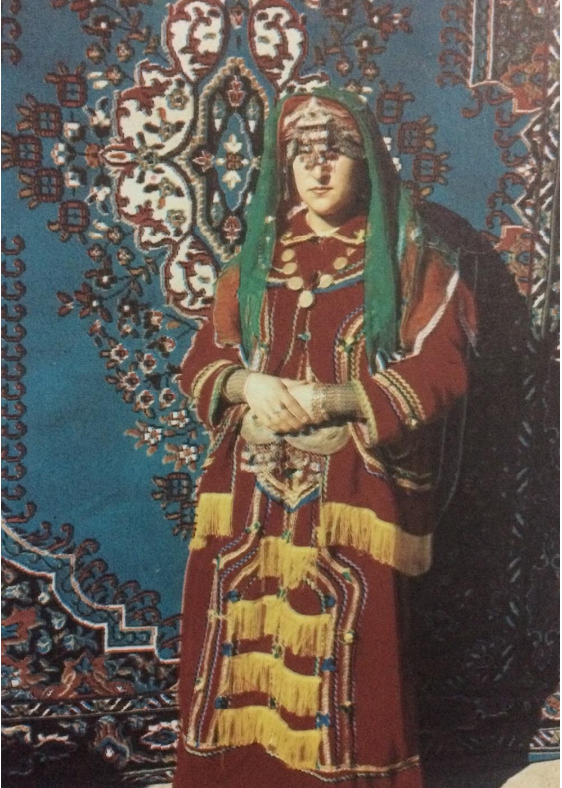
Düzağaç Geleneksel Gelin Giysisi (Kımk, 1998).