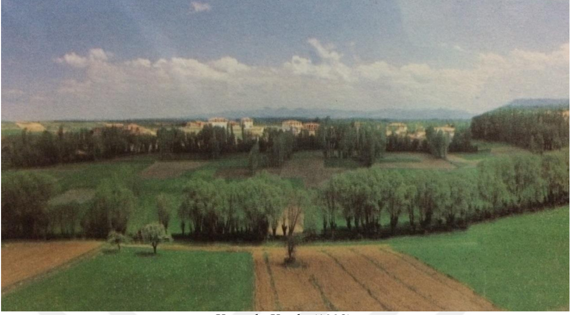
Şekil 2. Düzağaç Kasabası Tarım Arazilerinden Bir Görünüm