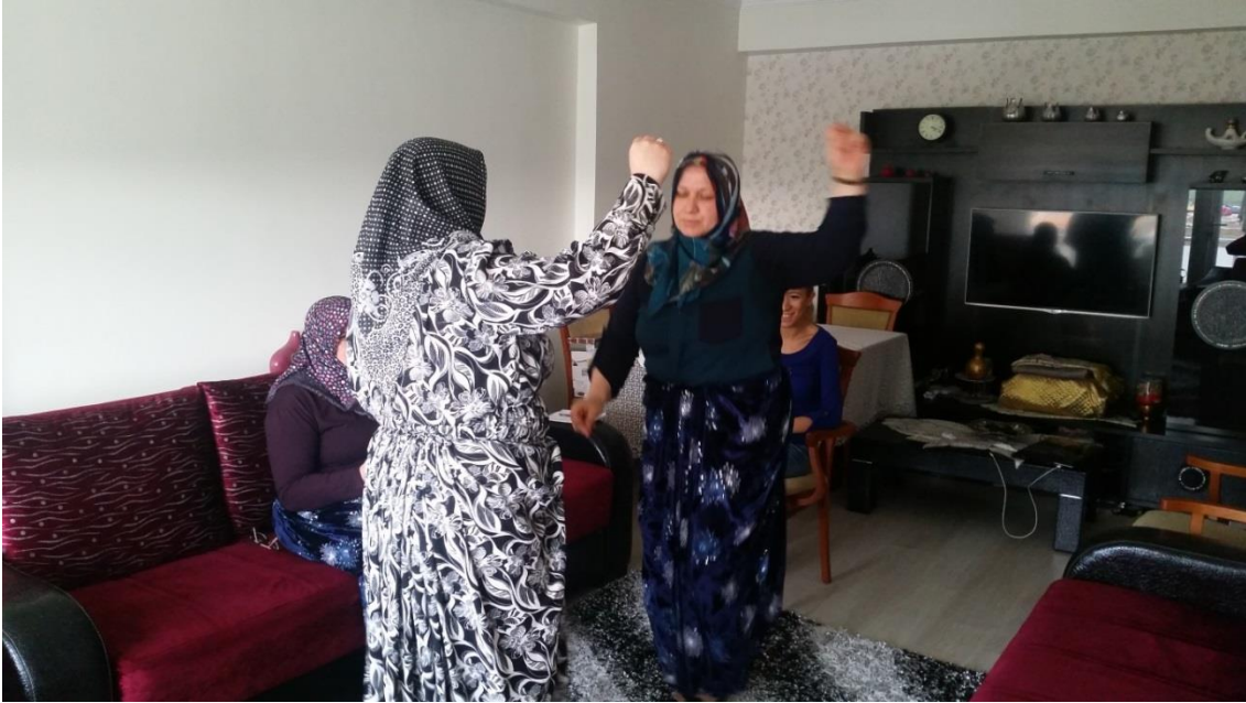
Düzağaç'ın Yöresel Oyunlarını Sergileyen Bayanlara Ait Bir Görünüm