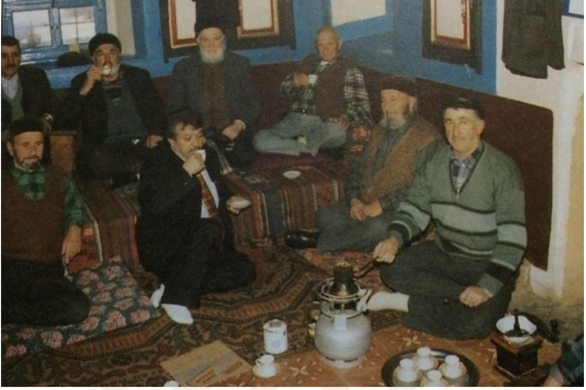
Düzağaç Köy Odası Sohbetlerinden Bir Görünüm (Kınık, 1998).