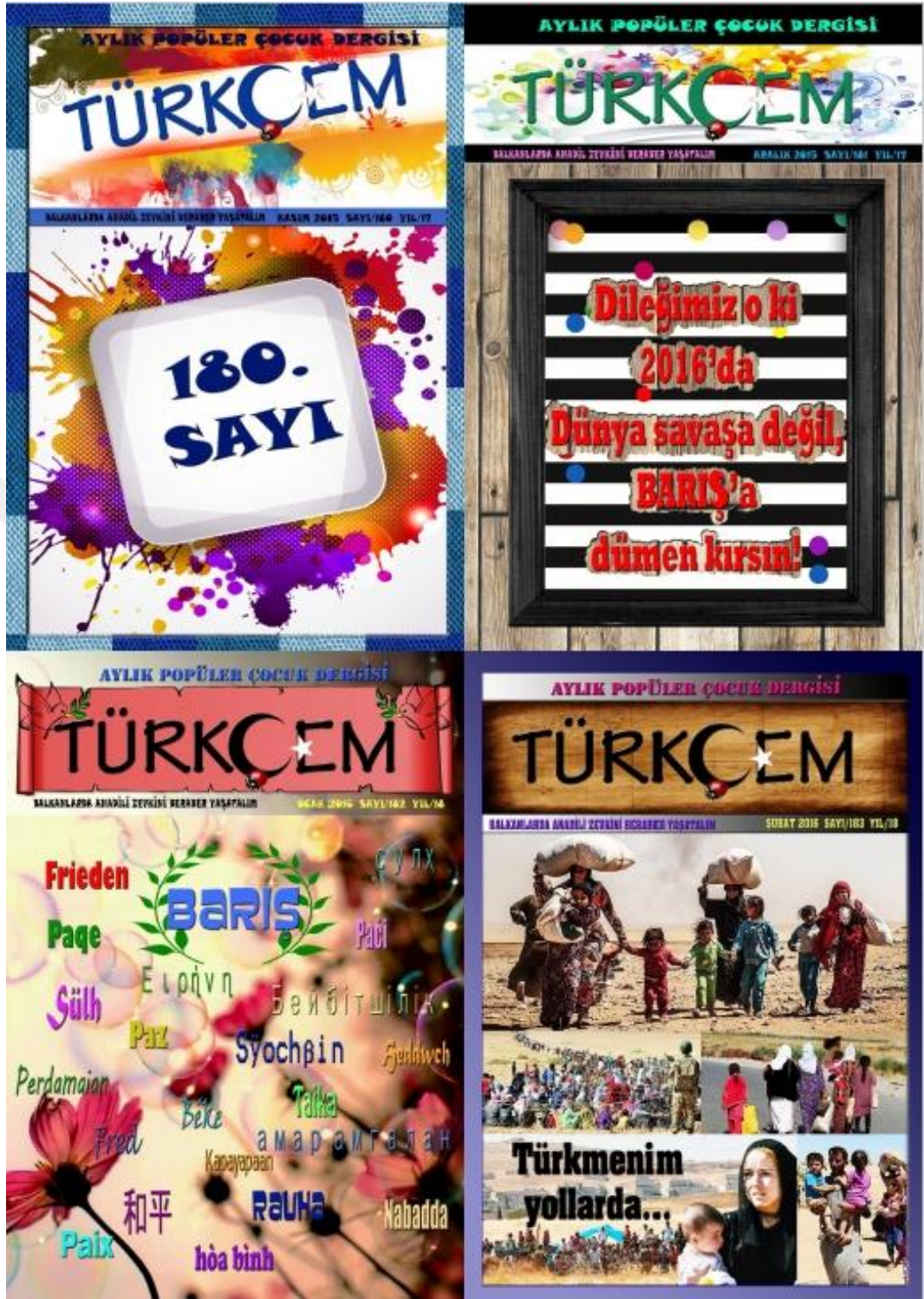
Fotoğraf 8: Türkçem Dergisi 2015 yılı Kasım, Aralık ve 2016 yılı Ocak, Şubat sayısı kapakları.