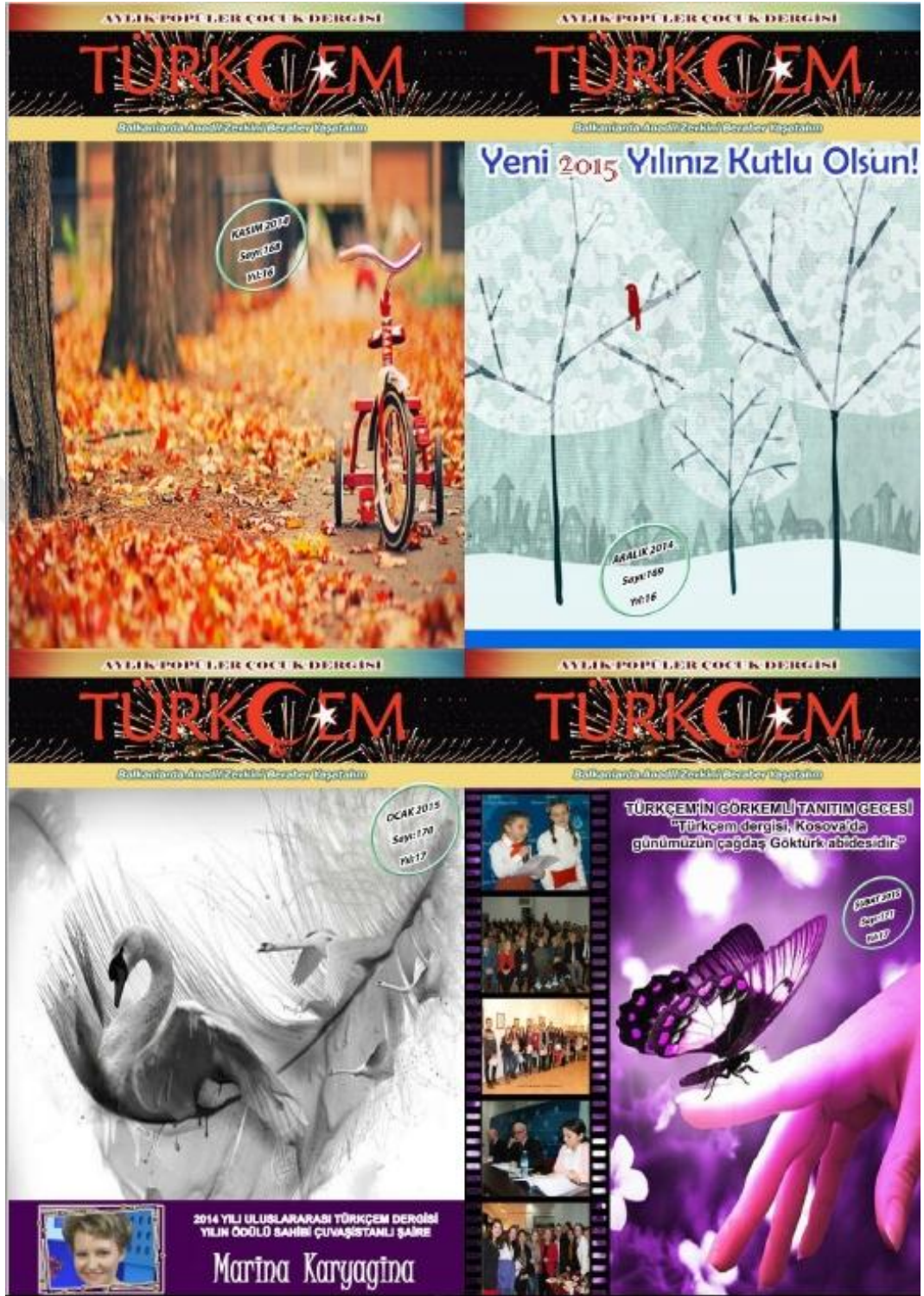
Fotoğraf 5: Türkçem Dergisi 2014 yılı Kasım, Aralık ve 2015 yılı Ocak, Şubat sayısı kapakları.