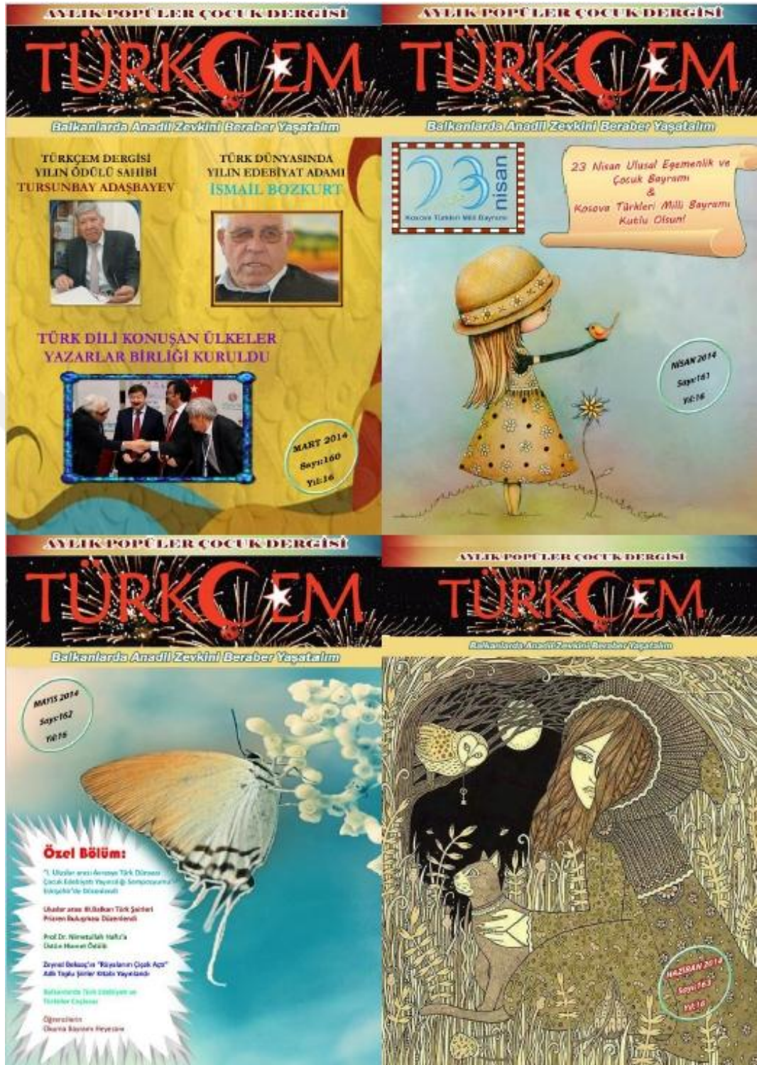
Fotoğraf 3: Türkçem Dergisi: 2014 yılı Mart, Nisan, Mayıs, Haziran sayısı kapakları.