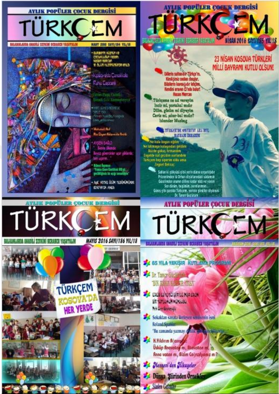
Fotoğraf 9: Türkçem Dergisi 2016 yılı Mart, Nisan, Mayıs, Haziran sayısı kapakları.