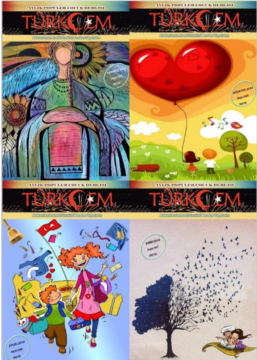
Fotoğraf 4: Türkçem Dergisi 2014 yılı Temmuz, Ağustos, Eylül, Ekim sayısı kapakları.