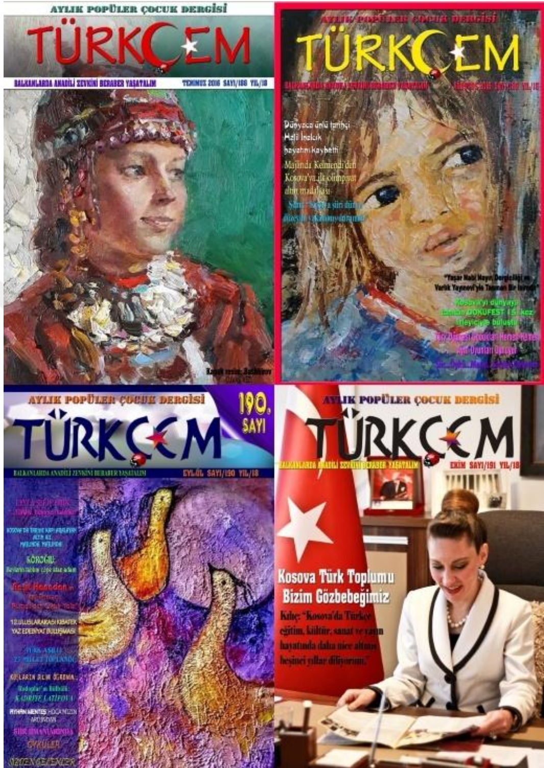
Fotoğraf 10: Türkçem Dergisi 2016 yılı Temmuz, Ağustos, Eylül, Ekim sayısı kapakları.