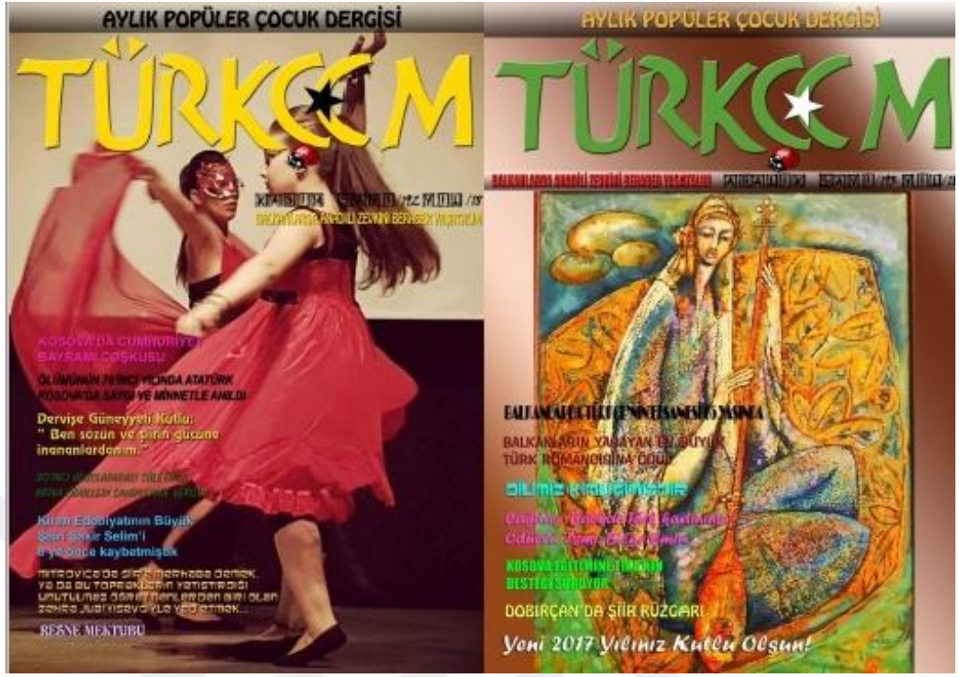
Fotoğraf 11: Türkçem Dergisi 2016 yılı Kasım, Aralık sayısı kapakları.