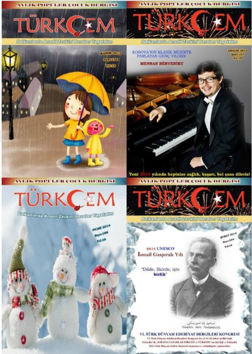
Fotoğraf 2: Türkçem Dergisi 2013 yılı Kasım, Aralık ve 2014 yılı Ocak, Şubat sayısı kapakları.