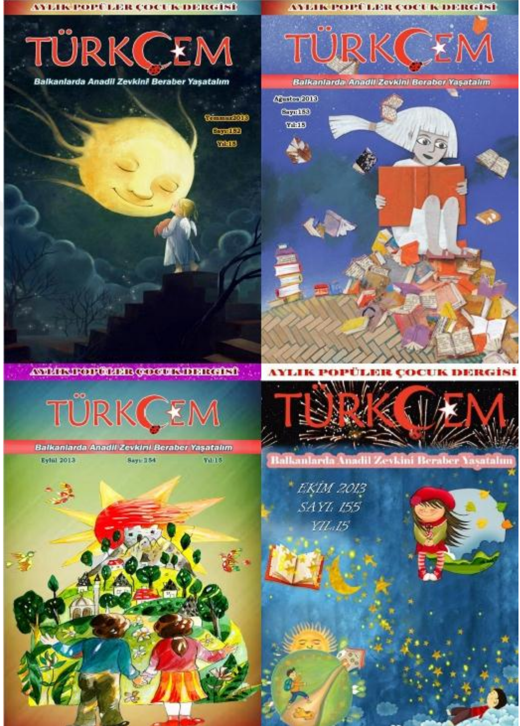
Fotoğraf 1: Türkçem Dergisi 2013 yılı Temmuz, Ağustos, Eylül, Ekim sayısı kapakları.