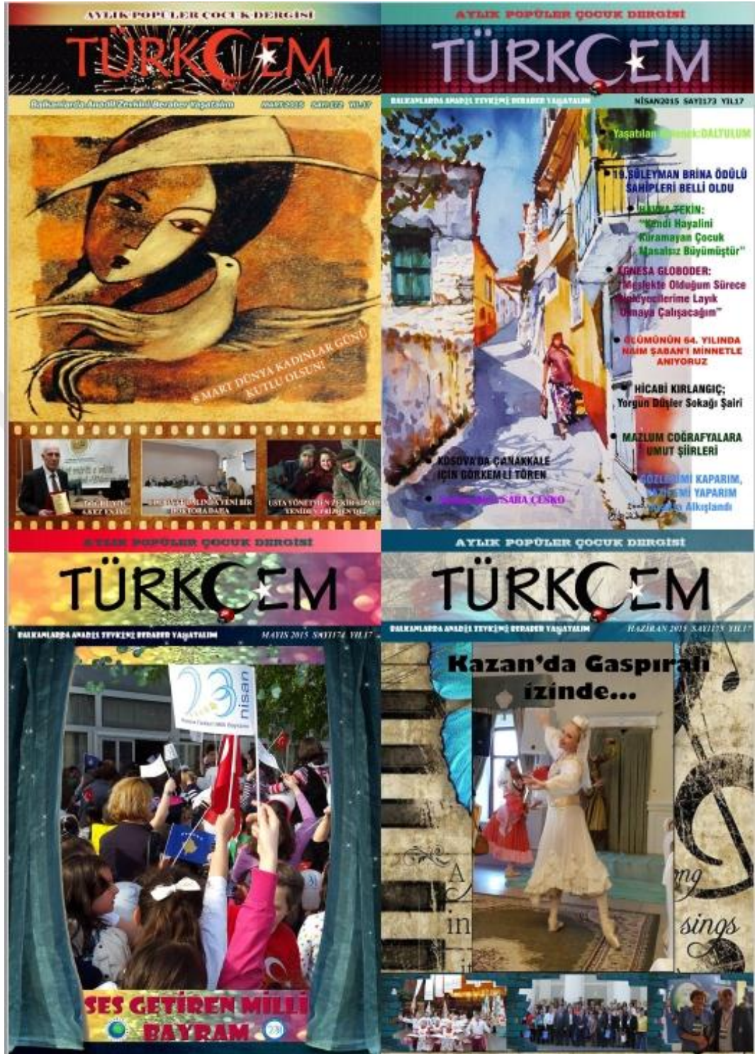
Fotoğraf 6: Türkçem Dergisi 2015 yılı Mart, Nisan, Mayıs, Haziran sayısı kapakları.