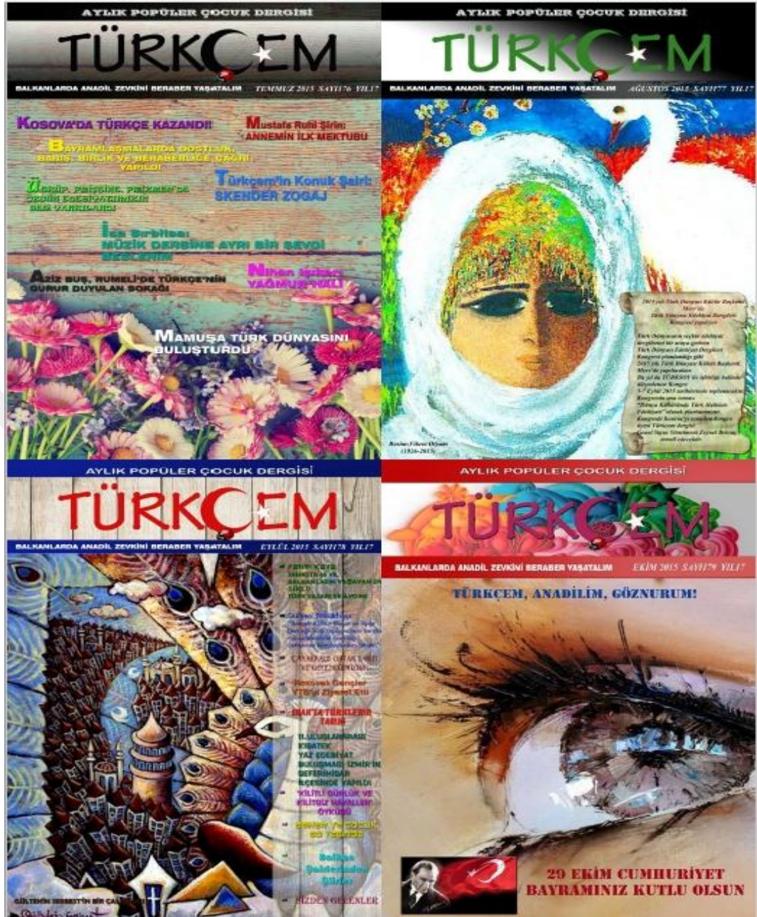
Fotoğraf 7: Türkçem Dergisi 2015 yılı Temmuz, Ağustos, Eylül, Ekim sayısı kapakları.