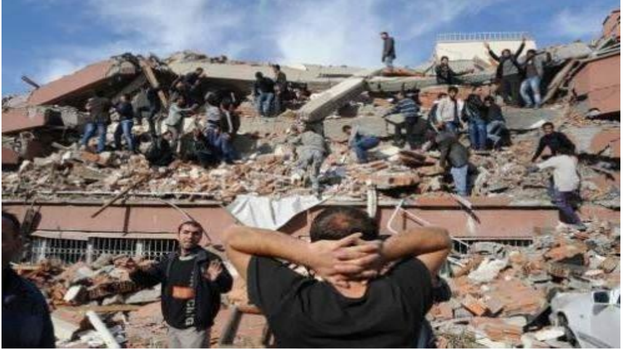
Şekil 3. 2011 Van Depremi Sonrası