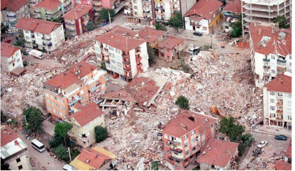
Şekil 2: 17 Ağustos 1999 Marmara Depremi Sonrası