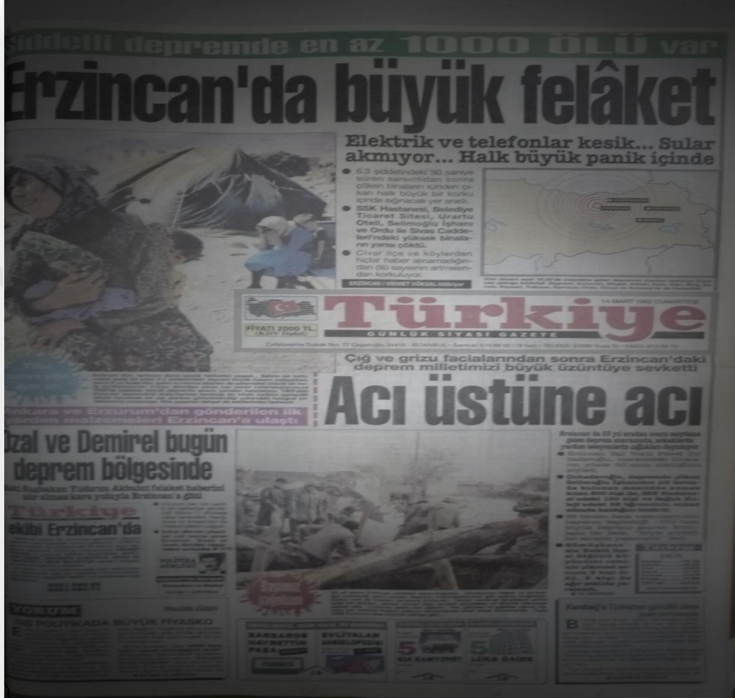
Şekil 4. Manşet: “Erzincan’da Büyük Felaket”