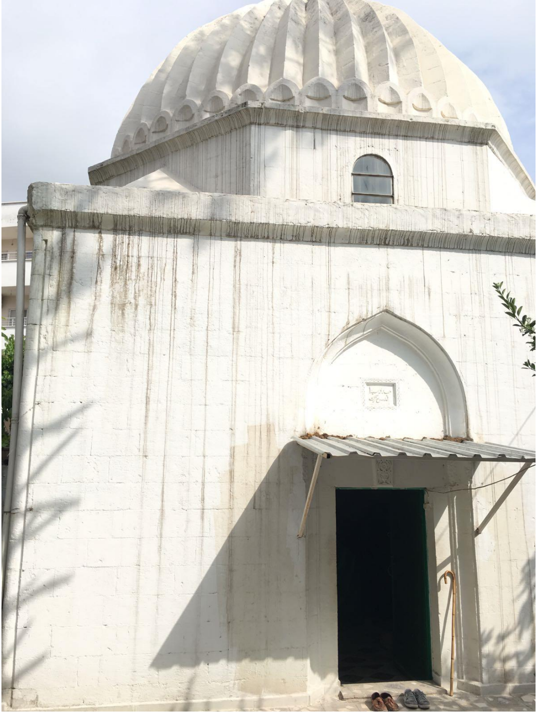
Şeyh Seydâ el-Cezerî'nin Türbesi.