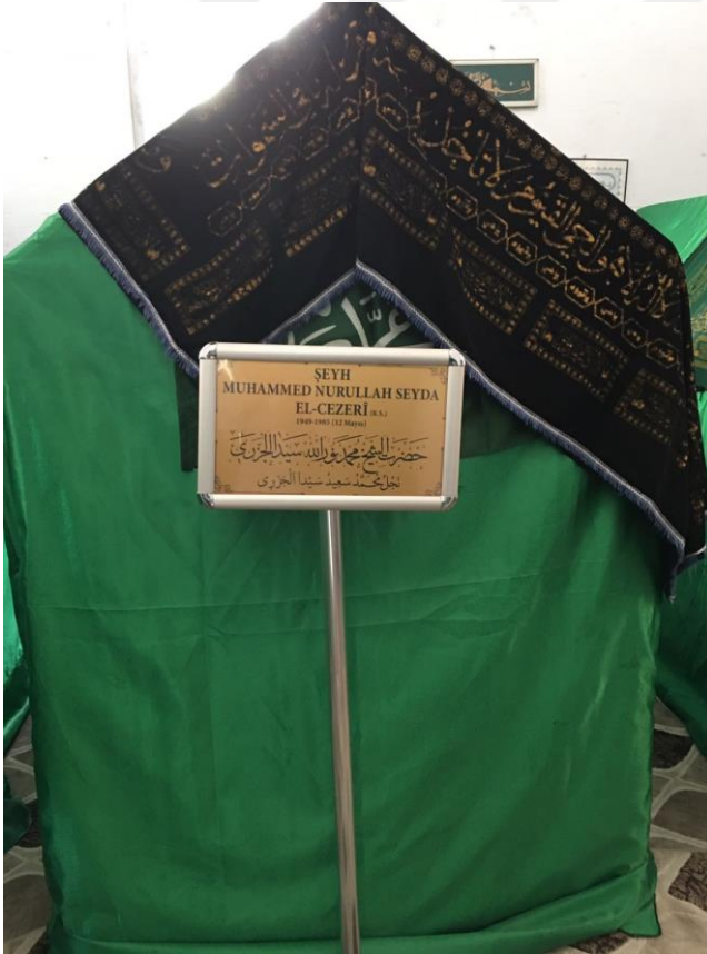
Şeyh Seydâ'nın Oğlu ve 6.Postnişin Muhammed Nurullah Seydâ el-Cezerî'nin Kabri