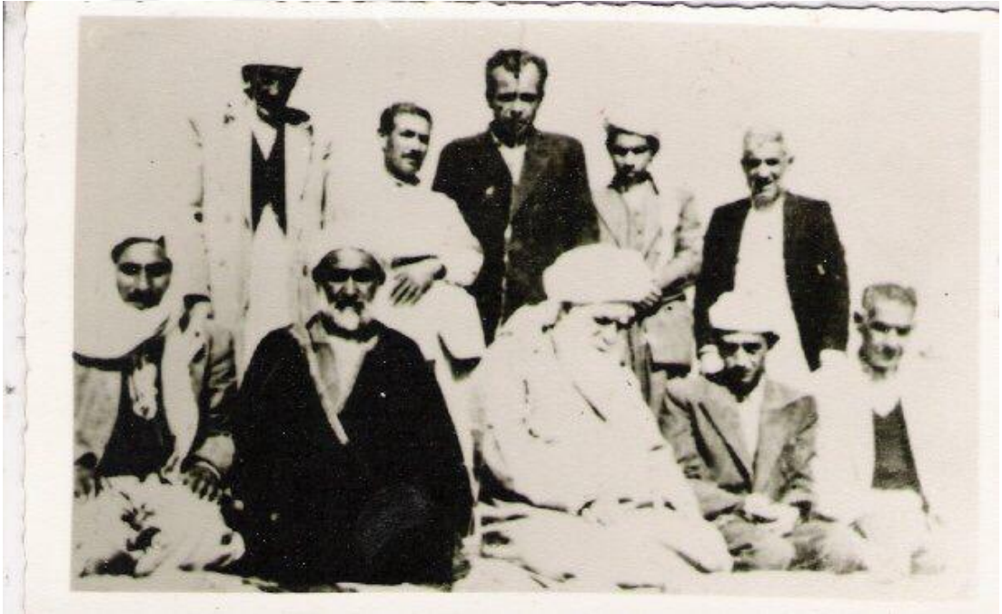
Talebe ve Müridleriyle Beraber Çekilen Bir Fotoğrafi.