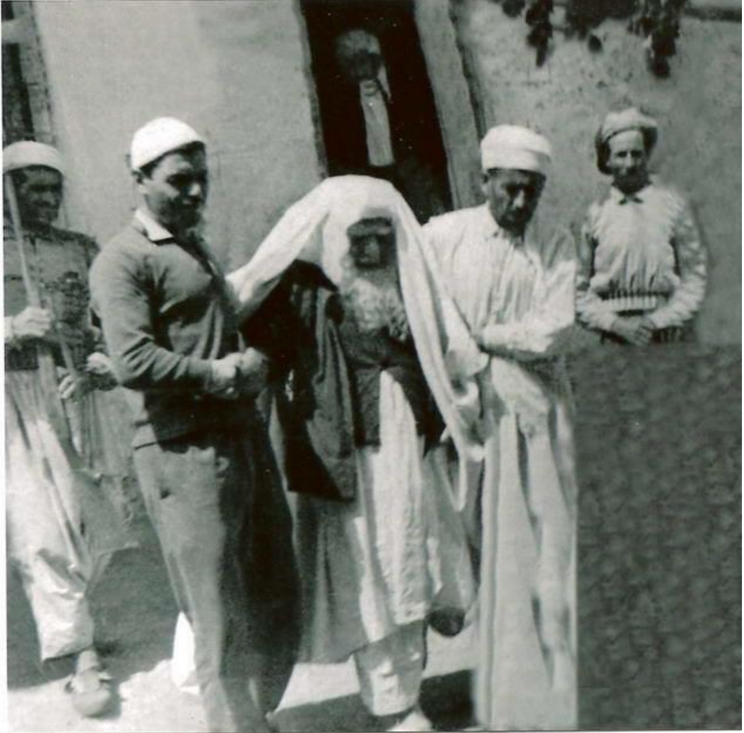
Ömrünün Son Yıllarında Ait Bir Fotoğraf