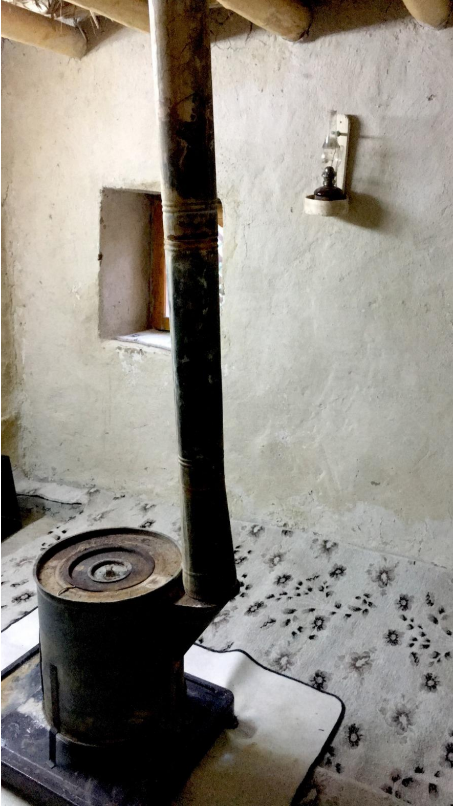
Şeyh Seydâ'nın Odası