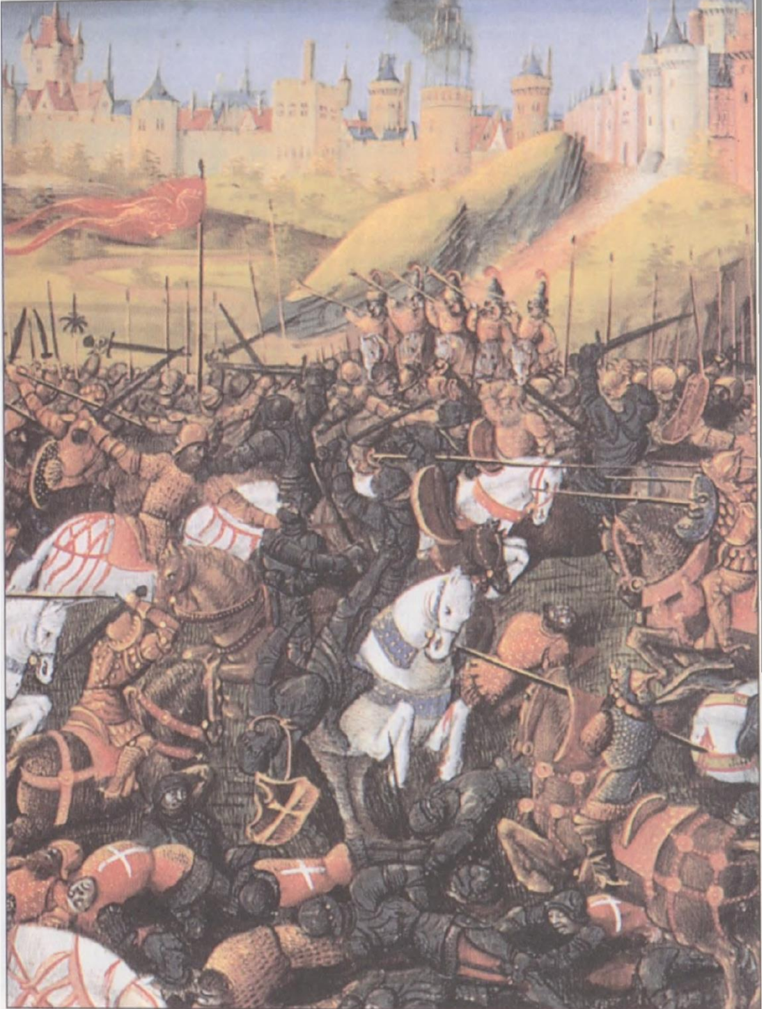
EK 4: 1149, Haçlılar'ın Müslümanlar'la Yaptığı Savaş (Nomiku, H.A., Haçlı Seferleri Tarihi, s. 190).