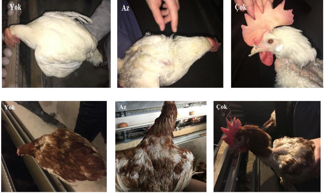
Şekil 2.2. Yumurtacı tavuklarda sırt bölgesinde tüy kaybı skorlaması