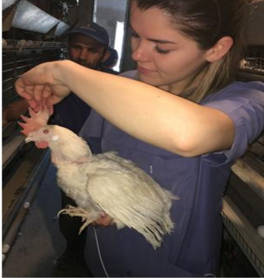
Resim 2.4. Araştırmada Hayvan Refahının Değerlendirmesi İçin Yapılan İnceleme ve Muayenelerden Bir Görüntü

Tavukların gaga yapısı görsel olarak incelenmiş, üst gaga ile alt gaganın birbirine göre şekil, boyut ve fonksiyonu yönünden uyumlu olması (Yok), tavuk genotipi ve yaşına göre olması gerekenden daha kısa gaga yapısı, üst veya alt gaganın bir diğerinden daha uzun ya da daha kısa olması veya gagada şekil bozukluğu olması gibi anormalliklerin az (Az) veya çok (Çok) olmasına göre skorlama yapılmıştır.