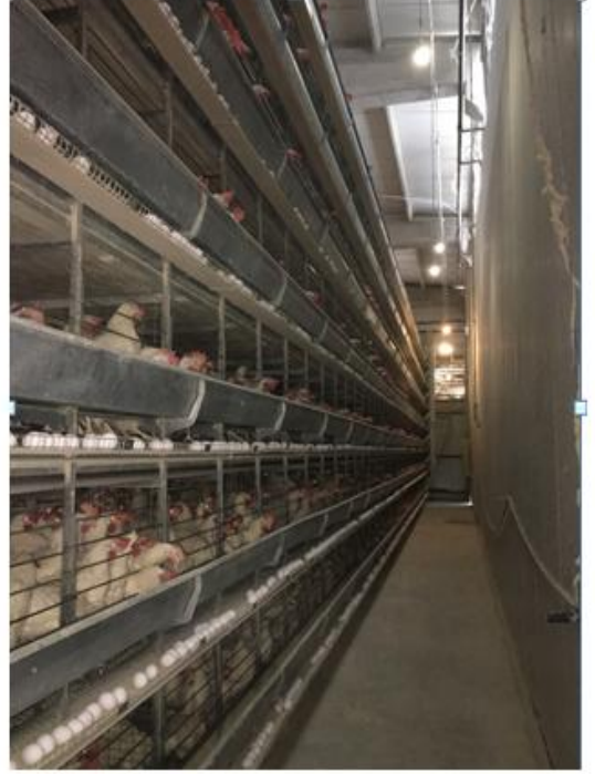
A: Kahverengi genotip, B: Beyaz genotip