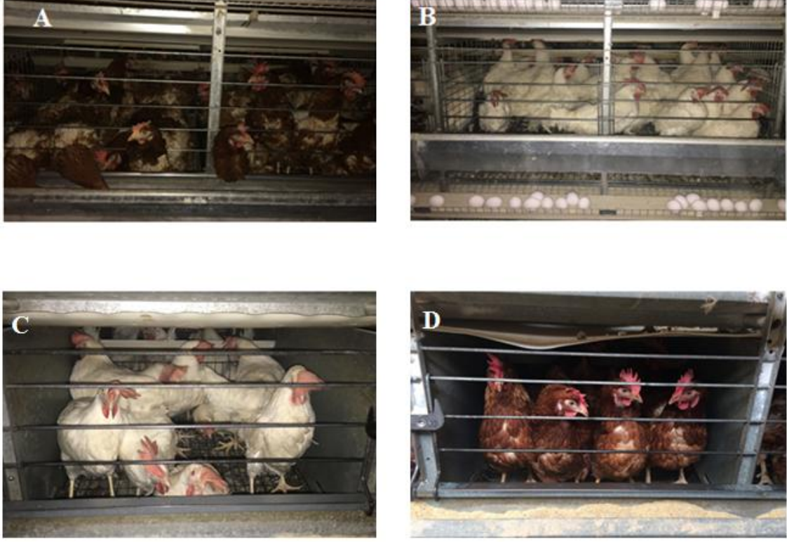
A ve B: Zenginleştirilebilir Kafes, C ve D: Geleneksel Kafes