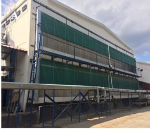
Resim 2.2. Arařtırmada Kullanılan Zenginleřtirilebilir Kafesli Kumesler