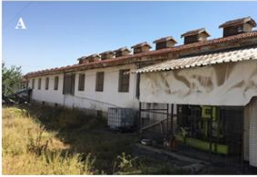
Resim 2.1. Araştırmada Kullanılan Geleneksel Kafesli Kümesler

Araştırmada, beyaz ve kahverengi ticari sürülerde yumurtaya giriş ile başlayarak 56 haftalık yaşa kadar sürüdeki hayvan sayısı, yumurta sayısı, kirli ve kırık yumurta sayısı ile ölen hayvan sayısı günlük olarak kaydedilmiştir. Her sürüde, yumurta verimi, kırık ve kirli yumurta oranı ile ölüm oranı günlük olarak hesaplanmıştır.