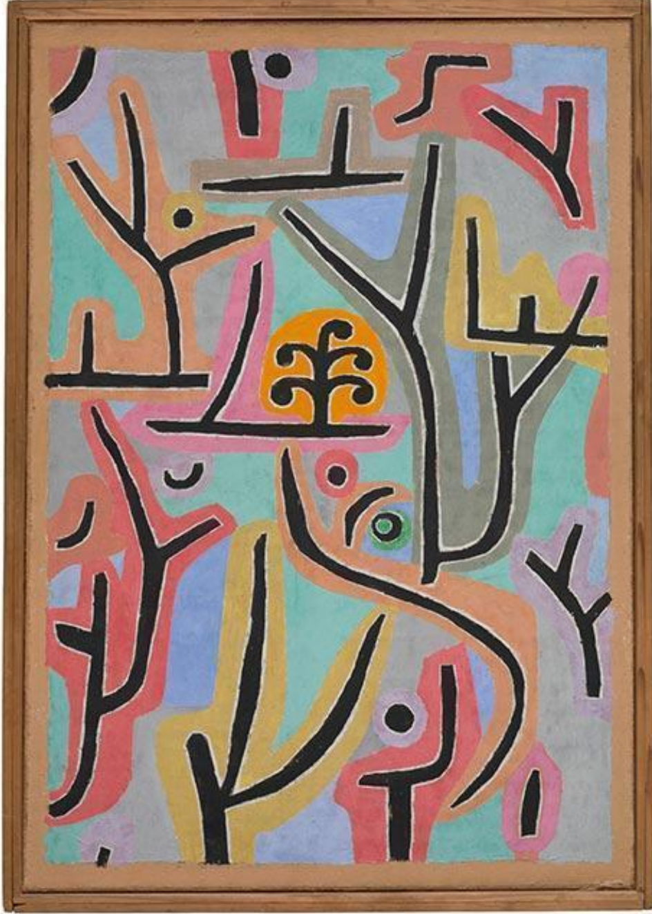
Resim 2. Paul Klee, Lucerne Parki

akademik sanat enstitüleri tarafından dışlandı. Dönemin sanatçılarının eserlerinde detaycı ve vurucu yaklaşımlarına nazaran Empresyonistler, anı yakalamayı ve bir manzaranın duyumsal etkisini vermeyi amaçladılar. Empresyonist nesnel göz önünde kısa süreli anda ortaya çıkar. Bu etkiyi yaratmak için empresyonist sanatçılar sokakta, açık havada, caddelerde ve kırsal alanlarda sanatlarını icra ederler.