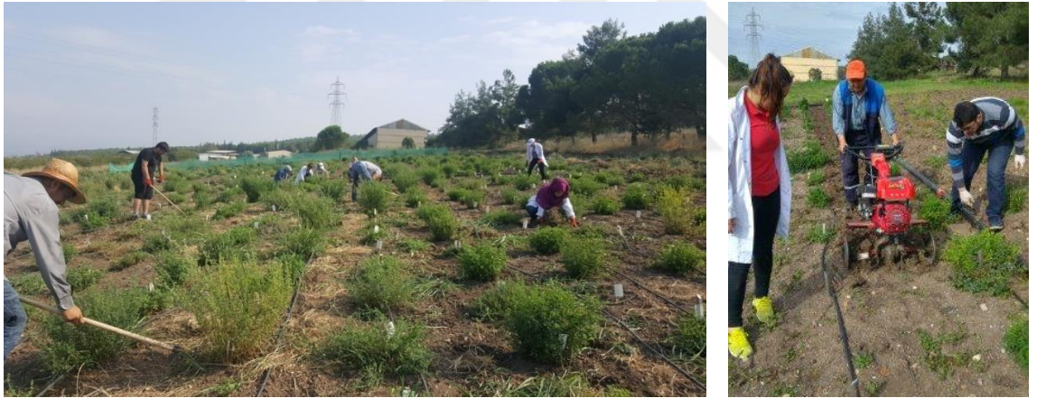
Şekil 3.2. Denemede yabancı ot mücadelesinin yapılması

Denemede yabancı otlara karşı elle ve çapa makinesi ile mücadele yapılmıştır (Şekil 3.2). Ayrıca denemede yaprak bitine karşı etkin maddesi imidacloprid olan İmidrid kullanılarak ilaçlamalar yapılmıştır.