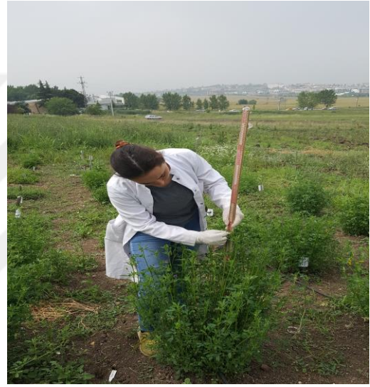
Şekil 3.3. Yonca genotiplerinde ana sap uzunluğunun ölçülmesi

Ana sap kalınlığı (mm): Her bir yonca genotipinde % 10 çiçeklenme döneminde genotiplerin ana sap kalınlığı bitkinin 6. ve 7. boğum arası belirlenerek dijital kumpas ile ölçülmüştür.