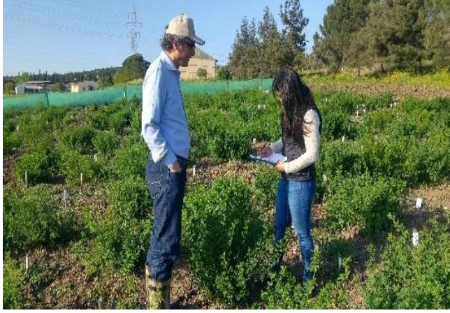
Şekil 3.4. Yonca genotiplerinde yaprak büyüklüğünün tespit edilmesi

Çiçeklenme gün sayısı (gün): Genotiplerin % 10 çiçeklenme dönemine kadar geçen gün sayısı sayılarak hesaplanmıştır.