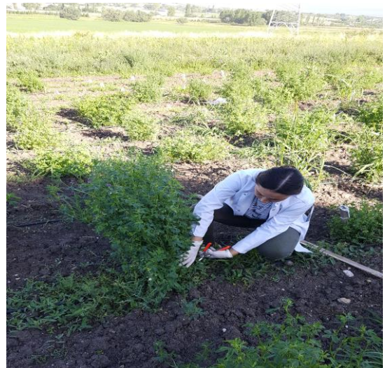
Şekil 3.5. Yonca genotiplerinde %10 çiçeklenme döneminde biçim yapılması