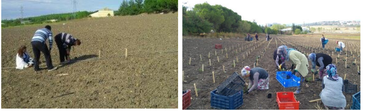
Şekil 3.1. Deneme alanında parselasyon işlemi ile şaşırtmanın yapılması

Denemede yabancı otlara karşı elle ve çapa makinesi ile mücadele yapılmıştır (Şekil 3.2). Ayrıca denemede yaprak bitine karşı etkin maddesi imidacloprid olan İmidrid kullanılarak ilaçlamalar yapılmıştır.