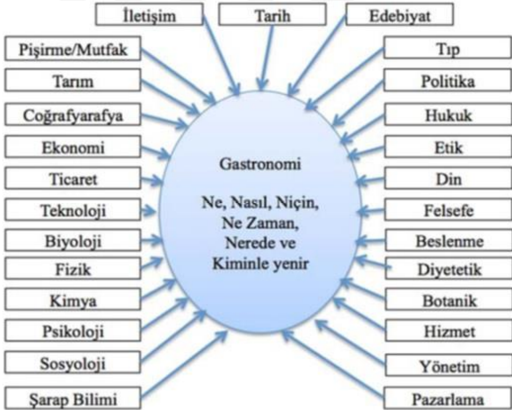
Şekil 1.1: Çok disiplinli gastronomi modeli (Öney,2016:196)

Scarpato'ya (2002:93) göre; "Gastronomi basit bir ifadeyle yeme-içme zevki ile ilgilidir ve insanlar tarafından tüketilen tüm yiyecek ve içecekler dahil olmak üzere beslenme ile ilgili her şeyi kapsayan geniş bir disiplindir" şeklinde ifade edilmektedir. Gillespie ve Cousins'a göre (2001) ise gastronomi hem fen bilimleri hem de sosyal bilimlerden yararlanır. Ayrıca fen bilimleri ve sosyal bilimler için zengin bir araştırma alanıdır. Konu yeme-içme ile ilgili olduğundan; beslenme bilimi ile doğrudan ilişkili olarak tadın fizyolojisi ve tat alma, şarap üretimi, besin öğelerinin insan vücudundaki işlevleri, gıda maddelerinin seçiminde özelliklerinin belirlenmesi, gıdaların fiziksel, kimyasal ve biyolojik olarak bozulmalarının önlenmesi için hijyen ve sanitasyon kurallarına uygun üretim süreçlerinin geliştirilmesi büyük oranda fen bilimlerine dayanmaktadır. Şekil 1.1'de Öney'in (2016), Santich (2007) ile Gillespie ve Cousins'den (2001) uyarladığı gastronomi ile ilişkili disiplinleri ifade eden model görülmektedir.