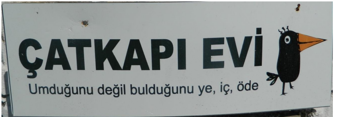
Görsel 2.10: Çat Kapı Evi Tabelası