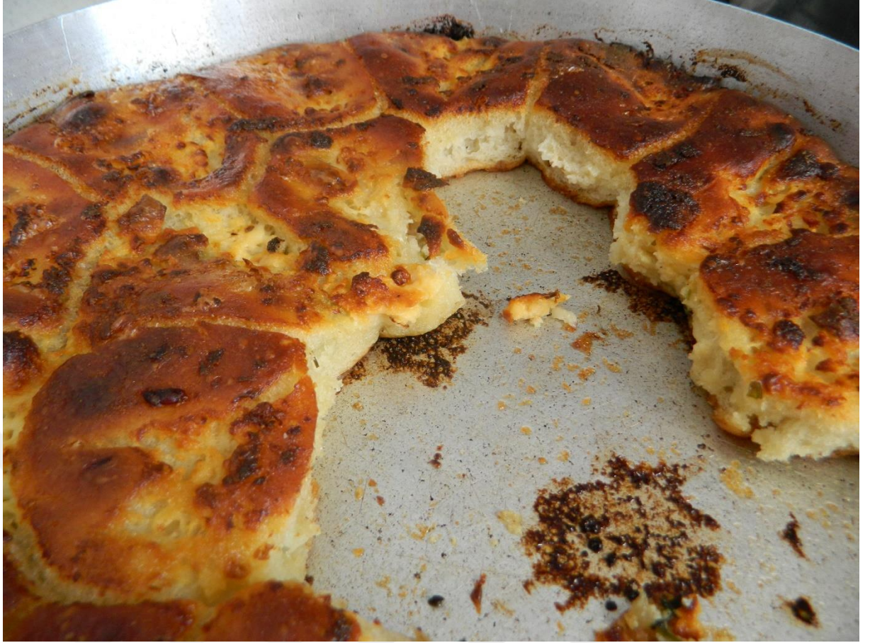
Görsel 2.7: Ekmek Böreği (Pidepide)