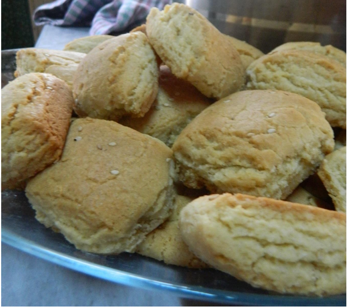
Görsel 2.8: Lokum