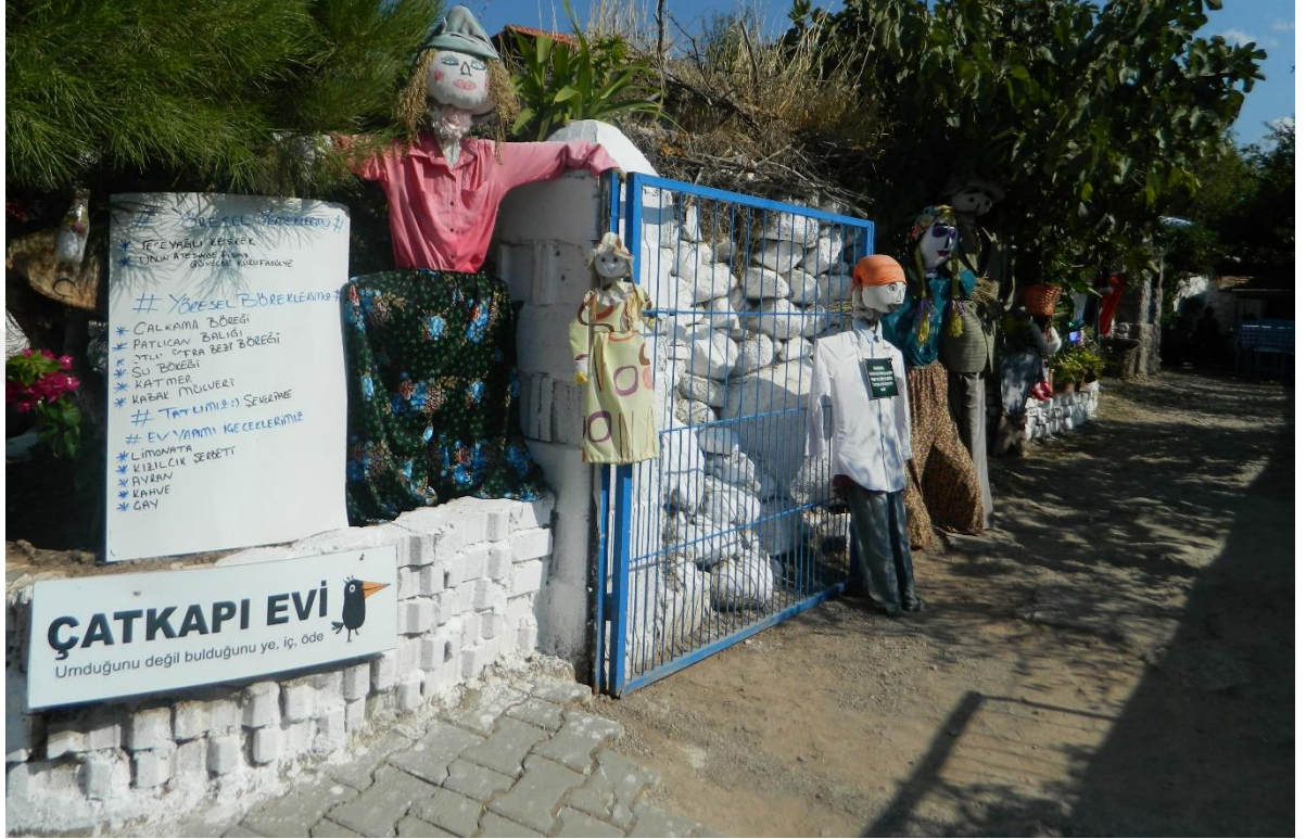
Görsel 2.11: Çat Kapı Evi Genel Görünüm