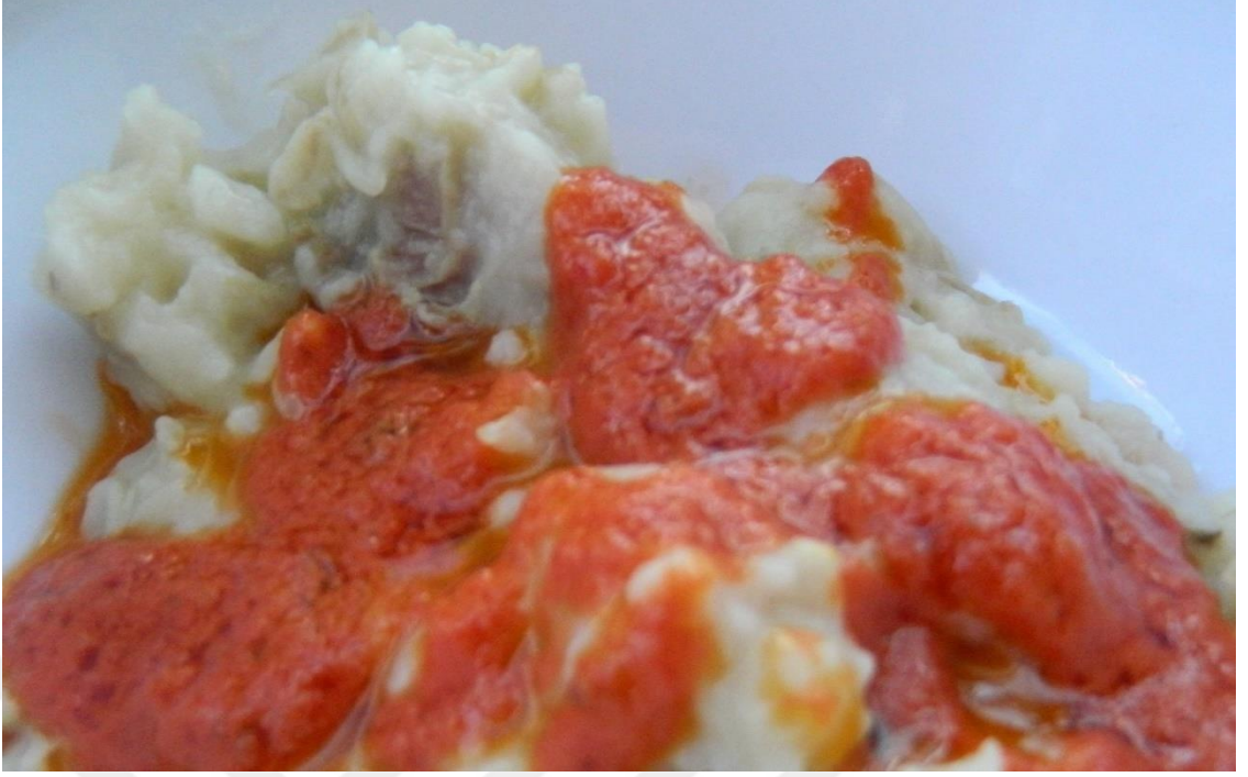
Görsel 2.9: Keşkek