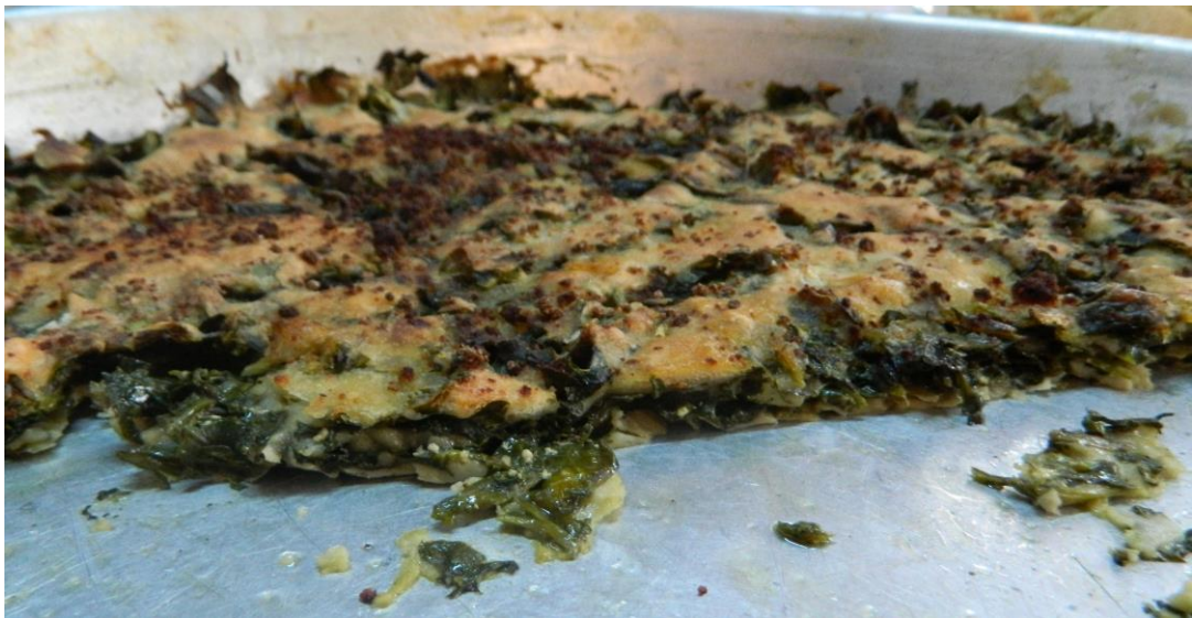
Görsel 2.5 Çalkama

Un, su ve tuzla hazırlanan cıvık hamurun yarısı tepsiye yarım parmak kalınlığında döküldükten sonra tepsideki hamurun üzerine hazırlanan harç konulur ve hamurun geri kalan yarısı biraz su eklenerek biraz daha cıvıttıldıktan sonra harcın üzeri kapanana kadar tepsi üzerine dökülür. Burada çalkamanın lezzetli ve kıvamlı olması için dikkat edilmesi gereken husus; tepsiye dökülen hamurun ince olması, bir parmak kalınlığını geçmemesidir. Harcın üzeri de hamurla kaplandıktan sonra tepsi üzerine zeytinyağı gezdirilir ve orta ateşte pişirilir. Tüketim esnasında yanında sos olarak yoğurt tercih edilmektedir.