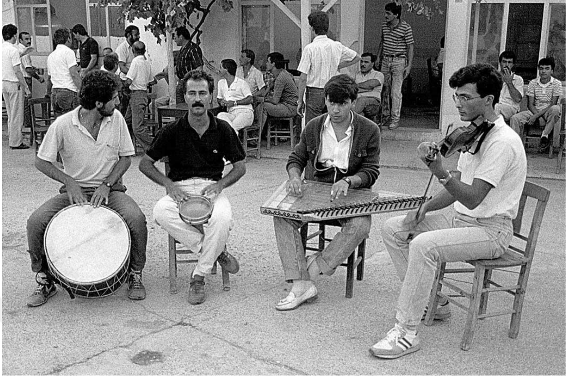
Görsel 2.1 70'lerde "Türk Gecesi" Etkinliğinde Müzisyenler (Köy Meydanı)