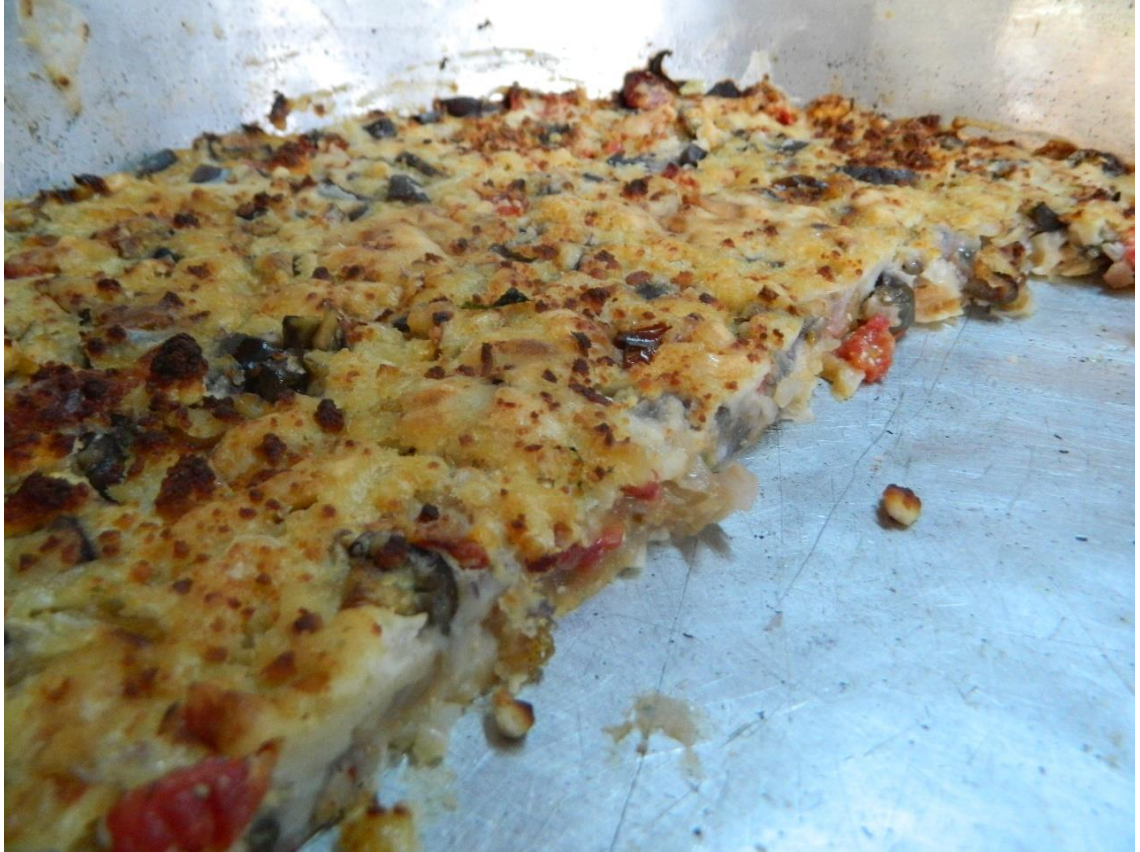
Görsel 2.6: Patlıcan Balığı

Patlıcan balığı, isminde yer alan kelime oyununun aksine balık içermeyip, sadece pişirme yöntemi olarak bir nevi balık pişirir gibi hazırlandığı için “patlıcan balığı” ismiyle anılmaktadır. Patlıcan, soğan ve domates doğranıp karıştırılır, üzerine çırpılmış hamur gezdirilir ve fırında pişirilir. Bir çeşit börek olan bu yemek köyde sıklıkla yapılmakta ve yenmektedir (Yaka, 2015). Yapımı ile çalkamayı andırsa da malzemelerin çeşidiyle yemeğin karakteri çalkamadan ayrılmaktadır.