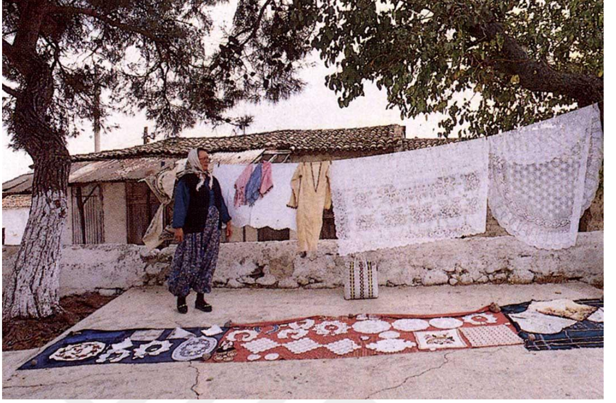
Görsel 2.3 70’lerde Turistlere Satış Yapan Barbaroslu Kadın (Eski Köy Camisinin Avlusu)

Günümüzden yaklaşık 50 yıl önce hiçbir resmi kanal ya da yerel yönetimin desteği olmadan bu özellikte organizasyonların yapıyor olması, köyde turizm potansiyelinin varlığını göstermektedir. Sonraki yıllarda köye turist getiren firmanın yatırımlarını o yıllarda rağbet görmeye başlayan, kitle turizmi akımının etkisi ve bir takım ticari kaygılarla Antalya bölgesine kaydırması sonucu köyde turizme uzun süreli bir ara verilmiştir.