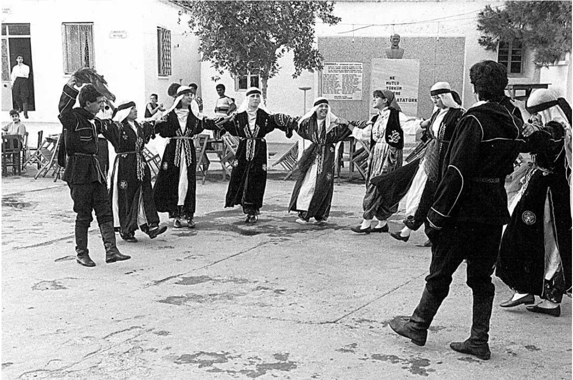
Görsel 2.2 70'lerde "Türk Gecesi" Etkinliğinde Folklor Ekibi (Köy Meydanı, Milli Mücadele Şehitleri Anıtı Önü)