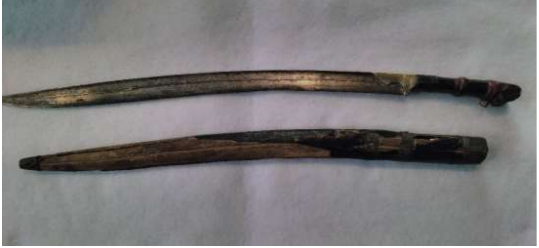
Görsel 1: Yatağan Kılıcı

Ateşli silah olarak kullanılan, ahşap kundak üzerinde namlu, nişangâh ve ateşleme sistemi olarak üretilen ilk tüfekler oldukça büyük ve ağır bir yapıda olup, birkaç kişi tarafından sabit bir alanda kullanılırdı. Zamanla silah teknolojisinin gelişmesiyle tüfekler, tek kişinin kullanabileceği hafif ve küçük bir forma büründü. 94