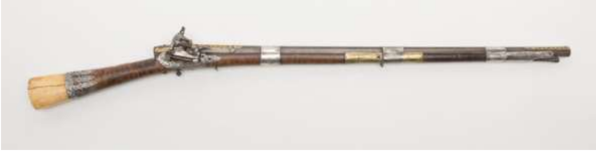
Görsel 2: Çakmaklı Tüfek

horoz adı verilen ateşleme çekicinin, hemen önüne yerleştirilen çakmak taşının, tetiğe basılınca hareket ederek namludaki barutun ateşlenmesiyle çalışmaktadır. 97