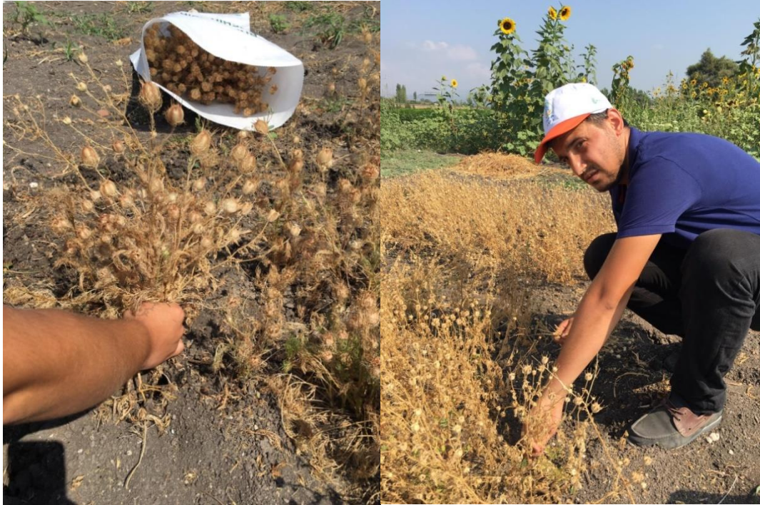
Şekil 3.7. Deneme alanında hasat işlemi

Hasat, bitkiler sararıp kapsüller koyulaşmaya başlayınca ilk yıl 08.08.2016, ikinci yıl 01.08.2017 tarihlerinde elle yapılmıştır. Her parsel çuvallanarak etiketlenmiştir (Şekil 3.6, Şekil 3.7).