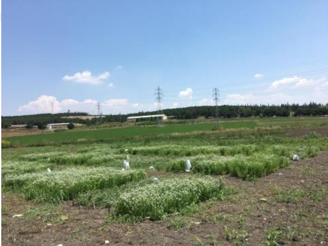
Şekil 3.5. Denemede çiçeklenme dönemi

Çalışmada çiçeklenme başlangıcı tarihleri genotiplere göre değişmekle birlikte 2016 yılında 25 Mayıs-18 Haziran, 2017 yılında 11 Haziran-27 Haziran tarihleri arasında değişmiştir. Yurtdışı menşeli genotipler diğer genotiplere göre daha erken çiçeklenmişlerdir (Şekil 3.5).