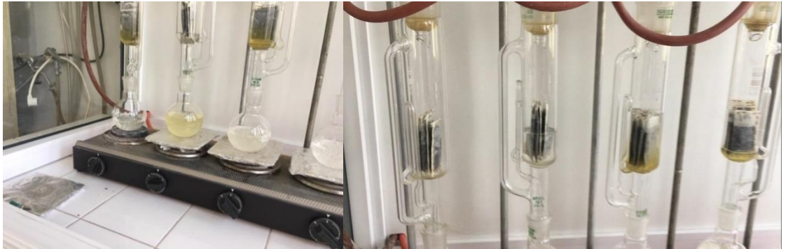
Şekil 3.10. Sokselet cihazı ile sabit yağ analizi

Sabit yağ oranı Tarla Bitkileri Bölümü Fizyoloji Laboratuvarı'nda her parselden alınan tohum örneklerinin öğütülmesi ve kuru ağırlıklarının tartılmasından sonra Sokselet cihazında ekstraksiyon yöntemiyle belirlenmiştir (Öğütçü 1979), (Şekil 3.10).