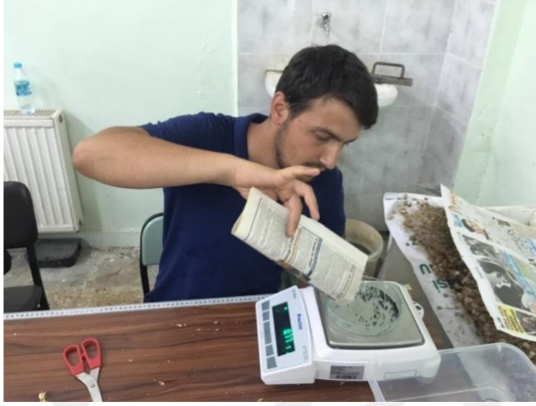
Şekil 3.9. Denemeden elde edilen tanelerin sayım ve tartım işlemleri