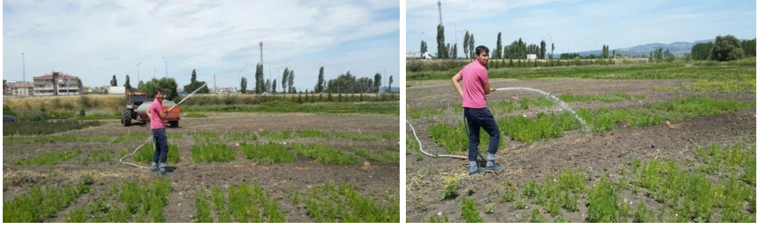
Şekil 3.4. Deneme alanında sulama işlemi