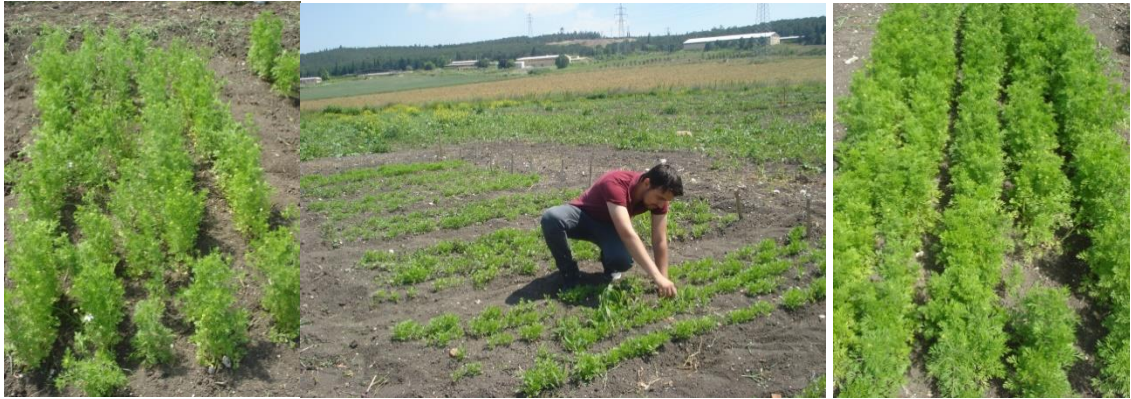
Şekil 3.3. Deneme alanında yabancı ot temizliği

Vejetasyon dönemi boyunca önemli bir hastalık ve zararlı sorunu ile karşılaşılmamış, gerekli zamanlarda sulama ve bakım işlemleri gerçekleştirilmiştir. (Şekil 3.3). İlk yıl çıkış ve çiçeklenme öncesinde sulama yapılırken 2. yıl yeterli yağış sebebiyle sulamaya ihtiyaç duyulmamıştır (Şekil 3.4).