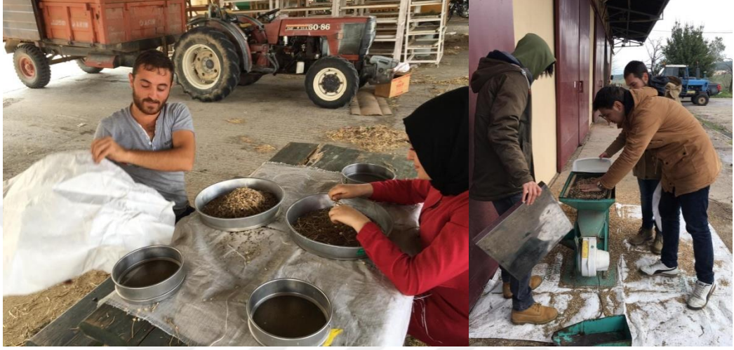
Şekil 3.8. Tohumları temizleme işlemi

Hasat edilen bitkilerin öncelikle kapsülleri ayrılmış daha sonra elekten geçirilerek tohumları elde edilmiş ve harmanlama işlemi tamamlanmıştır. Daha sonra makine yardımı ile tohumların içerisinde kalan artıklar temizlenmiştir (Şekil 3.8).