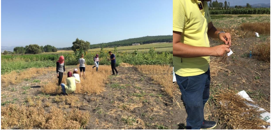
Şekil 3.6. Deneme alanında hasat işlemi

Hasat, bitkiler sararıp kapsüller koyulaşmaya başlayınca ilk yıl 08.08.2016, ikinci yıl 01.08.2017 tarihlerinde elle yapılmıştır. Her parsel çuvallanarak etiketlenmiştir (Şekil 3.6, Şekil 3.7).