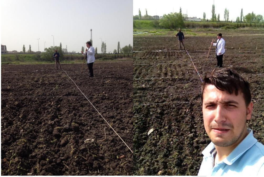
Şekil 3.2. Deneme alanında parselizasyon işlemi