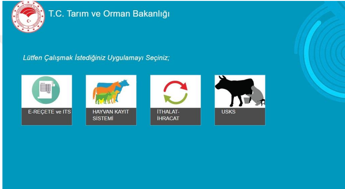
Şekil 1.2. Hayvan Bilgi Sistemi Ekran Görüntüsü

İnsan beslenmesinde tarım sektörü kadar hayati öneme sahip olan hayvancılık sektörü de TARBİL projesi kapsamına alınmış olup, Hayvan Bilgi Sistemi adı altında oluşturulmuş ve teknik personelin kullanımına sunulmuştur.