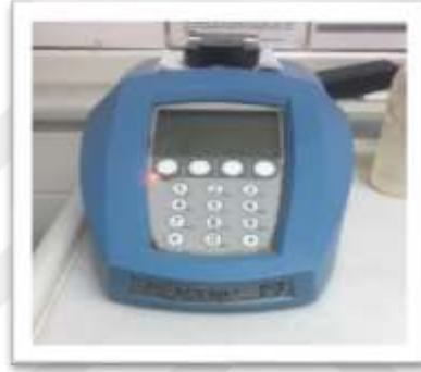
řekil 3.8. řeker oranı 3l3m cihazı (Refraktometre)

Olgunlařma d3neminde koanın ortasındaki taneler elle sıkılarak s3t3ms3 endosperm sıvısı refraktometre 3zerine akıtılarak toplam řeker % si belirlenmiřtir (Eřiyok ve ark. 2004).