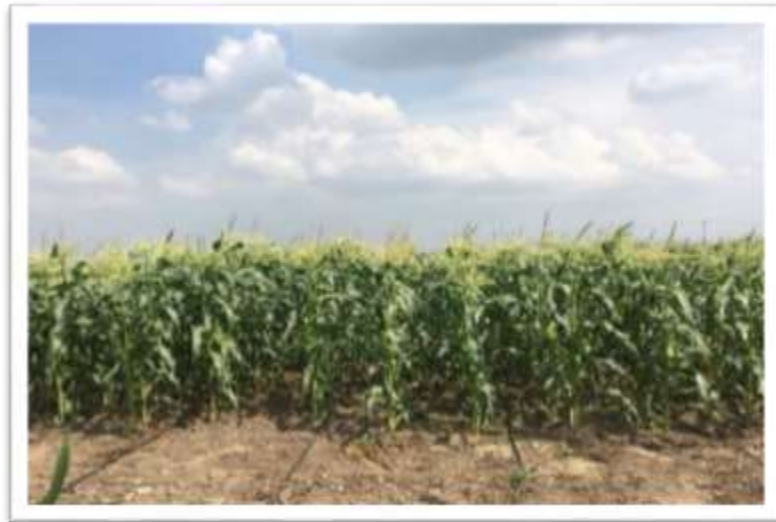
Şekil 3.3. Deneme alanı çiçeklenme dönemi

Deneme alanı buğday hasadından sonra derin bir şekilde işlenerek dekara 50 kg taban gübresi NPK (15-15-15) serpme şeklinde verilmiş, denemenin sulaması damla sulama yöntemine göre yapılmıştır. Yabancı ot kontrolü ve boğaz doldurma işlemleri el ile çapa yapılarak gerçekleştirilmiştir. Hasat kriteri olarak koçanların süt olum dönemi esas alınmıştır. Hasat 70 cm sıra aralığındaki parsellerin orta kısmında yer alan iki sıra, 25-45 cm sıra aralığındaki parsellerin orta kısmında yer alan 4 sıra olacak şekilde hasat edilmiş, sıra başlarından ve sonlarından 1'er bitki hasat edilmemiştir.