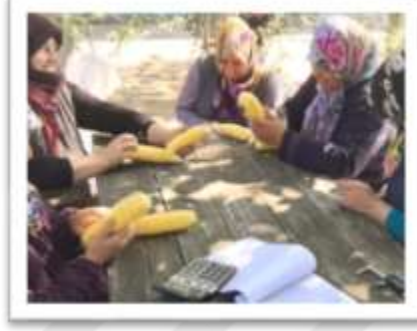
řekil 3.6. Koanlar 6zerinde yapılan 6l6mler

Hasat edilen 10 koan 6rneęinin her birinde koanda sıra sayısı ile sırada tane sayısı arpılıp koanda tane sayısı elde edilmiřtir (řekil 3.6).