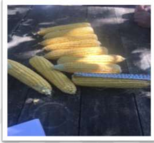
řekil 3.5. Koan uzunluęu ölçümü

Parselin ortasındaki sıralardan hasat edilen koanlardan tesadüfe baęlı olarak seilen on koan örneęinde, koan sapının tane ile birleřtięi noktadan koan ucuna kadar olan mesafe cetvelle ölçölüp ortalaması alınarak cm cinsinden ifade edilmiřtir (řekil 3.5).