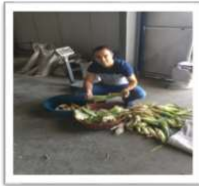
řekil 3.7. Kavuzlu ve kavuzsuz koan aęırlıęı

S6t olum d6neminde hasat edilen koanların kavuzları soyulmuř ve kavuzsuz olarak tartılan koanlar kg/da olarak ifade edilmiřtir.