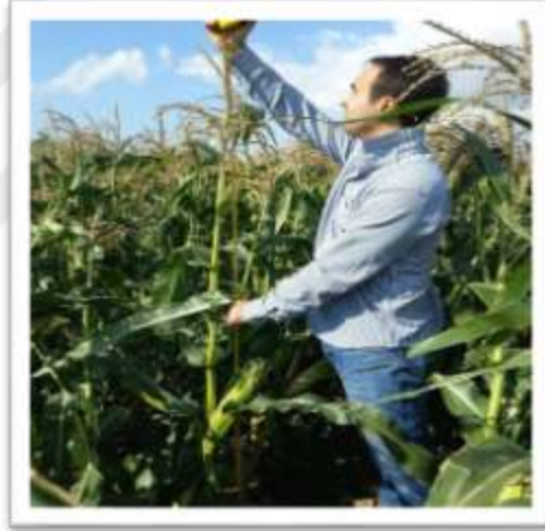
řekil 3.4. Bitki boyu ölçümü

Hasat öncesi parselin ortasındaki sıralarda tesadüfe bađlı olarak seçilen on bitkinin toprak yüzeyinden bitkinin tepe püskülünün ucuna kadar olan yüksekliđin ölçölüp ortalaması alınarak cm cinsinden ifade edilmiřtir (řekil 3.4).