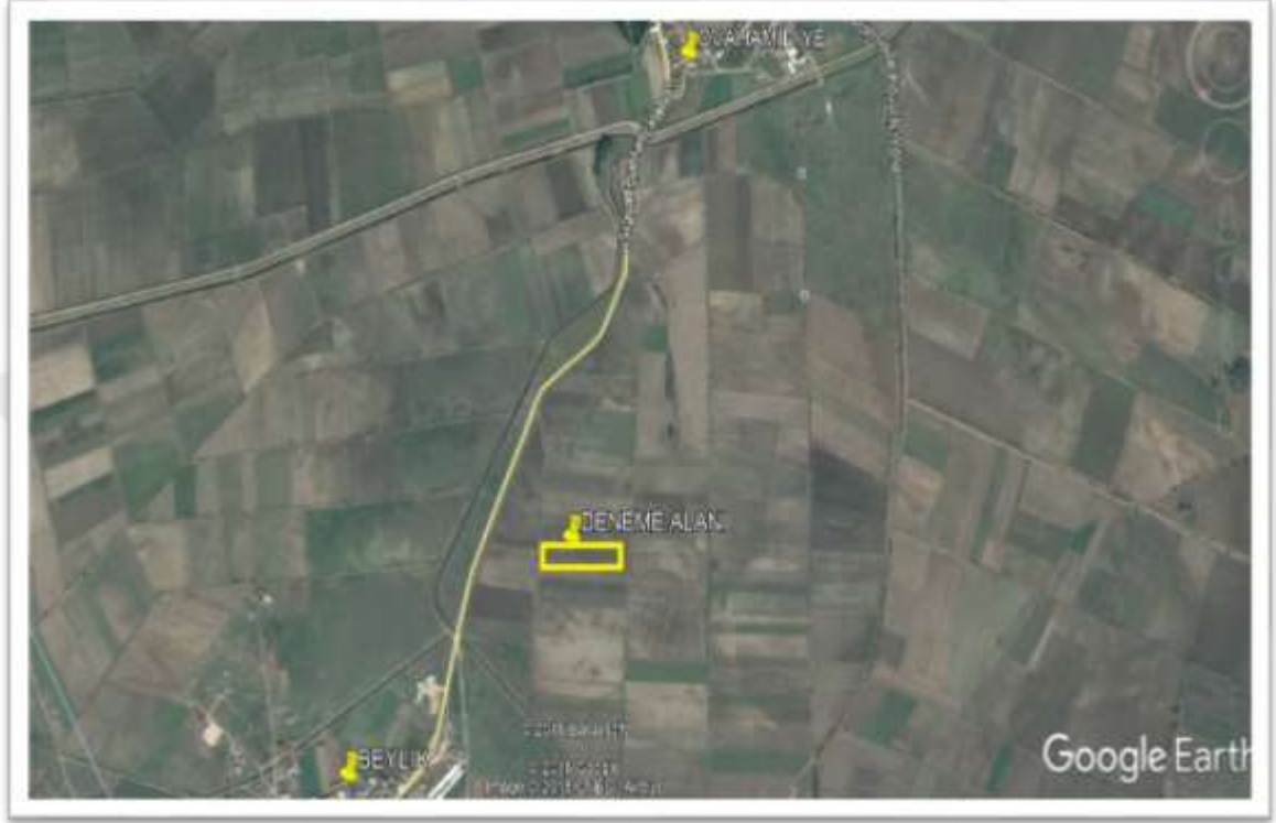
Şekil 3.1. Deneme alanı krokisi (Anonim 2017)

Deneme alanı ilçenin güneybatısında yer alır ve ilçeye 23 km uzaklıktadır. Deneme parselinin ada parsel numarası 142/20'dir. Koordinat bilgileri ise 40°06'23.10"K 28°11'29.83"D'dir (Şekil 3.1).