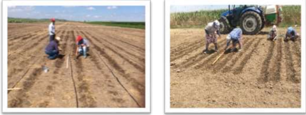
Şekil 3.2. Deneme alanı ekim dönemi