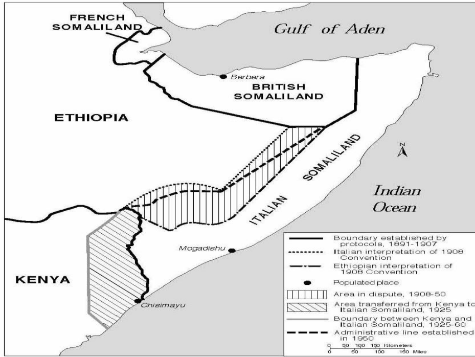
Şekil 1: Somali Sömürge Yönetimleri Haritası 220

Sömürge döneminde Fransız, İngiliz ve İtalyan Somalisi olarak üçe ayrılmış olan Somali topraklarında var olan kabile farklılıkları birbirinden ayrı Somali toplumlari yaratmıştır. Somali topraklarını savunacak güçlü merkezi bir hükümetin olmaması ve kabileler arası anlaşmazlıklarda sömürgeci güçlerden yardım istenmesi sömürgeci güçlerin Somali'yi kendi aralarında paylaşılmasını kolaylaştırıcı bir etkide bulunmuştur. 221