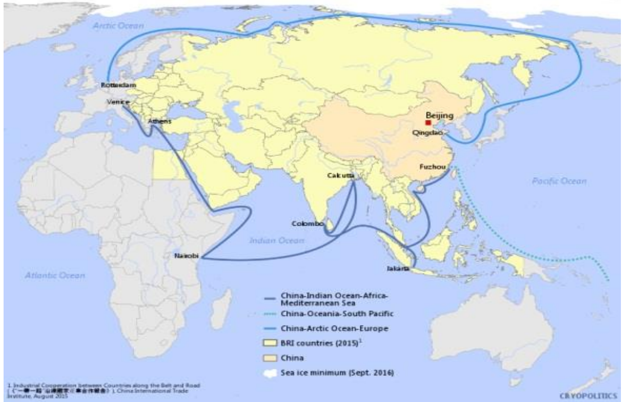
Resim 3. “21. Yüzyıl Deniz İpek Yolu” ve “Kutup İpek Yolu” Güzergahı.