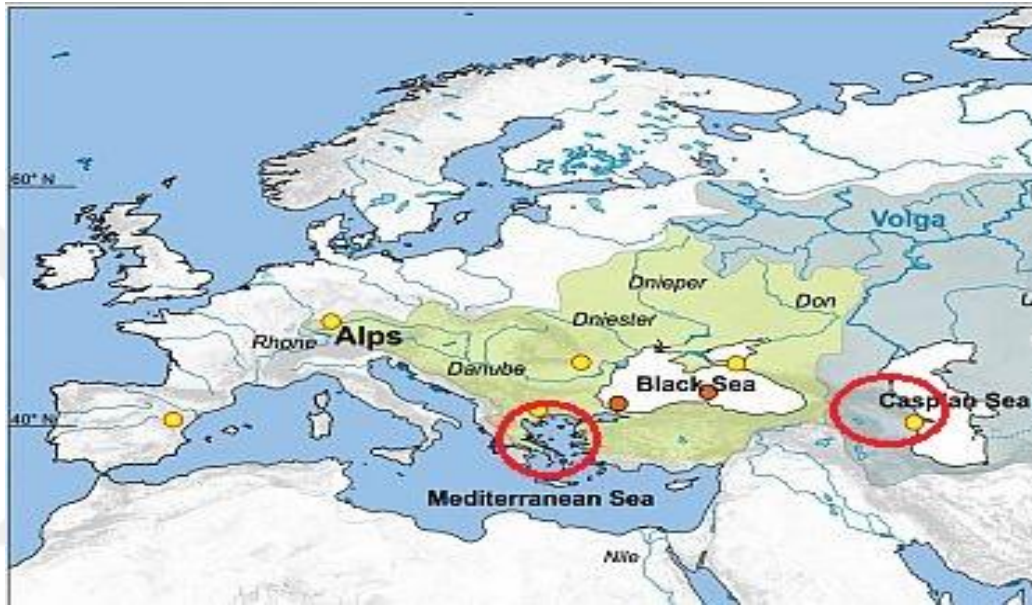
Resim 1. Karadeniz Havzası.

Kaynak: Christiaan van Baak, "Mediterranean-Paratethys Connectivity During the Late Miocene to Recent", Utrecht Universitesi, http://www.geo.uu.nl/~forth/people/ChrisvB/chrisvb_pd.htm , (e.t. 03.03.2018).