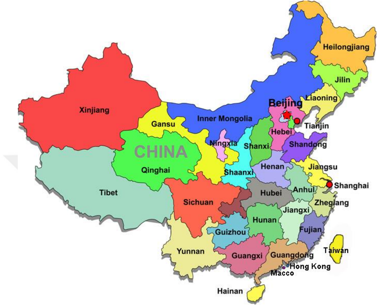
Resim 4: Çin'in Bölgesel Yapısı.