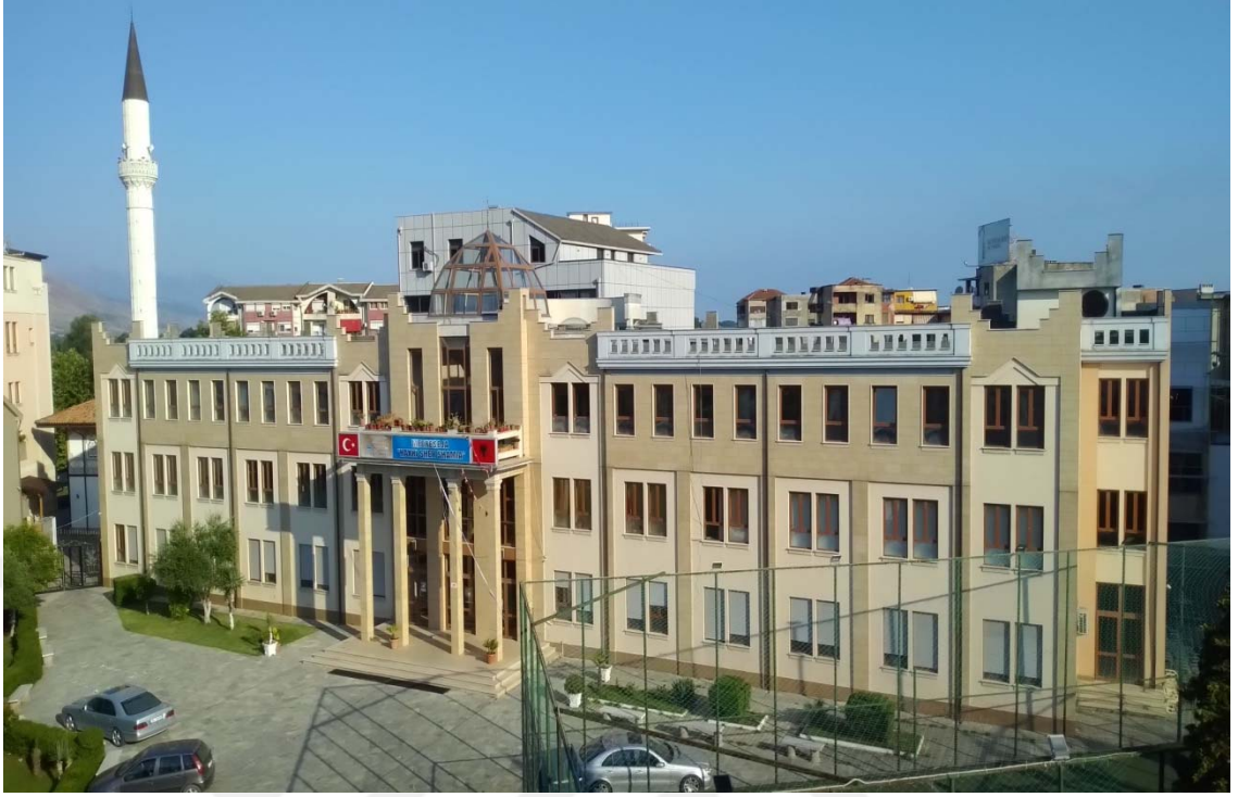
Resim 1: İřkodra Medresesi ve Caminin Dış Görüntüsü