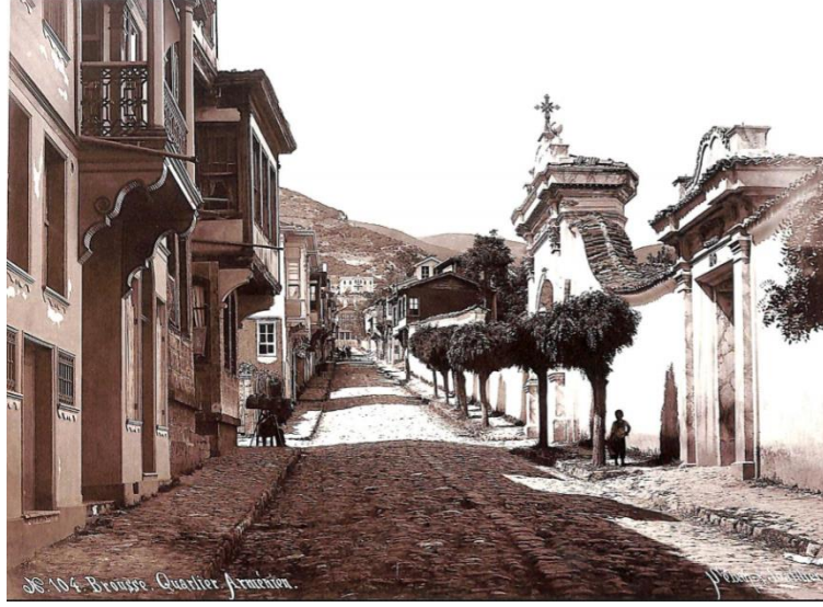
Resim 1. İpekçilik Caddesi 227

1900'lü yıllarda Bursa'da bulunan Ahmed Tevfik'in Seyahatnamesinde, Setbaşı'nın Bursa'nın en seçkin mahallesi olduğu belirtilmektedir. 228 Ahmet Vefik Paşa'nın valiliği döneminde, Setbaşı'ndaki İpekçilik Caddesi, Bursa kenti içindeki ayrışmanın artık etnik veya dinsel kimliklerle değil de gelir gruplarına göre yaşandığı yerleşim alanı olmuştur. İpekçilik Caddesi, ipek tüccarlarının ve fabrikatörlerinin tercih ettiği zengin bir semt haline gelmiştir. 229 İpekçilik Caddesi, fotoğrafta (Resim 1) da görüldüğü gibi Gregorian klisesinin yanından geçerek üst ucunda Hünkâr Köşkü ile son bulmaktadır. 230 Caddenin hükümet merkezlerine yakınlığı en önemli özelliklerinden biridir. Bursa'daki diğer bir bölgede ise, "Cilimboz" deresi civarında Rum nüfusun yaşadığı fabrikalar bölgesinde zengin tüccar evleri ve konsolosluklar bulunmaktadır. 231