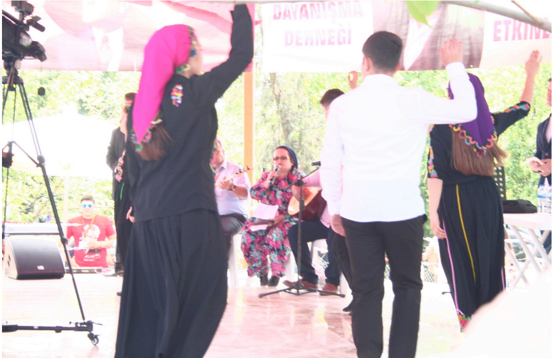
Resim 6: Nefes Söyleyen Kadın

Alanda gözlemlenen Semah pratiğinde kadınların da Zâkir'ler ile birlikte nefes söylediği gözlemlenmiştir. Resim 6 da bu duruma örnek görülmektedir.