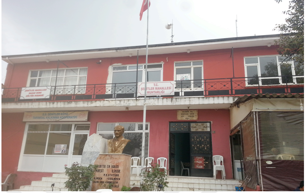
Resim 1: Köy Kütüphanesi Dış Görünüm