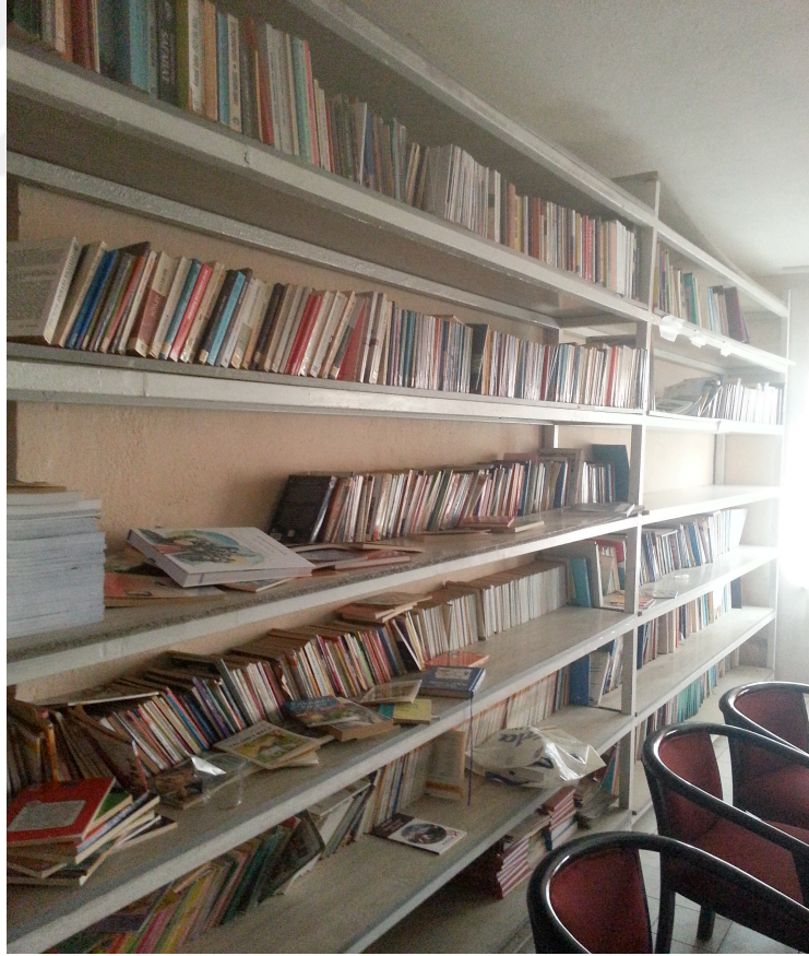
Resim 2: Köy Kütüphanesi İç Görünüm