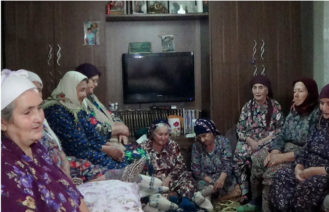
Resim 5: Şehitler Köyünde Ana-Bacılar

Resim 5 de nefes söyleyen kadınlar (Ana-Bacılar) görülmektedir.