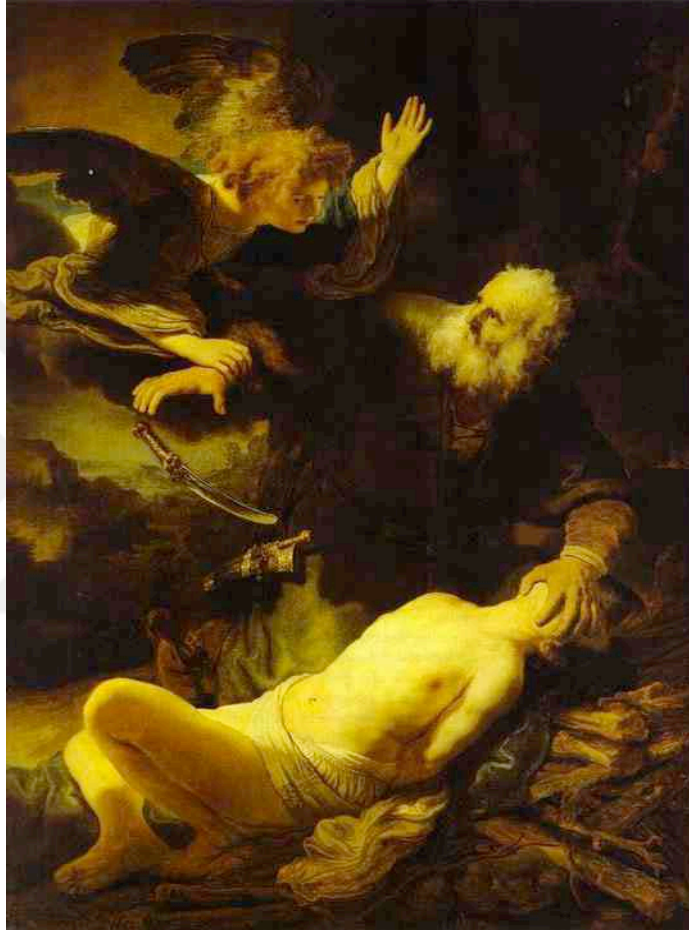
Resim 7: İbrahim Peygamberin Oğlunu Kurban Etme Tasviri

çabalarının ilk örneklerinden olabilir. “Değişik Türk boyları arasında IX-X. yüzyıllarda kullanılmaya başlanan kelimenin İbranice’den önce Arapça’ya oradan da din yoluyla dilimize geçtiği bilinmektedir. İslamiyet öncesi Türk boylarında ise kurban karşılığı olarak “yağış, tayılga, hayılga, Tengere tayıg (gök kurbanı), tolu, tolug” gibi kelimelerin kullanıldığını biliyoruz” (Bekki, 2004: 3).