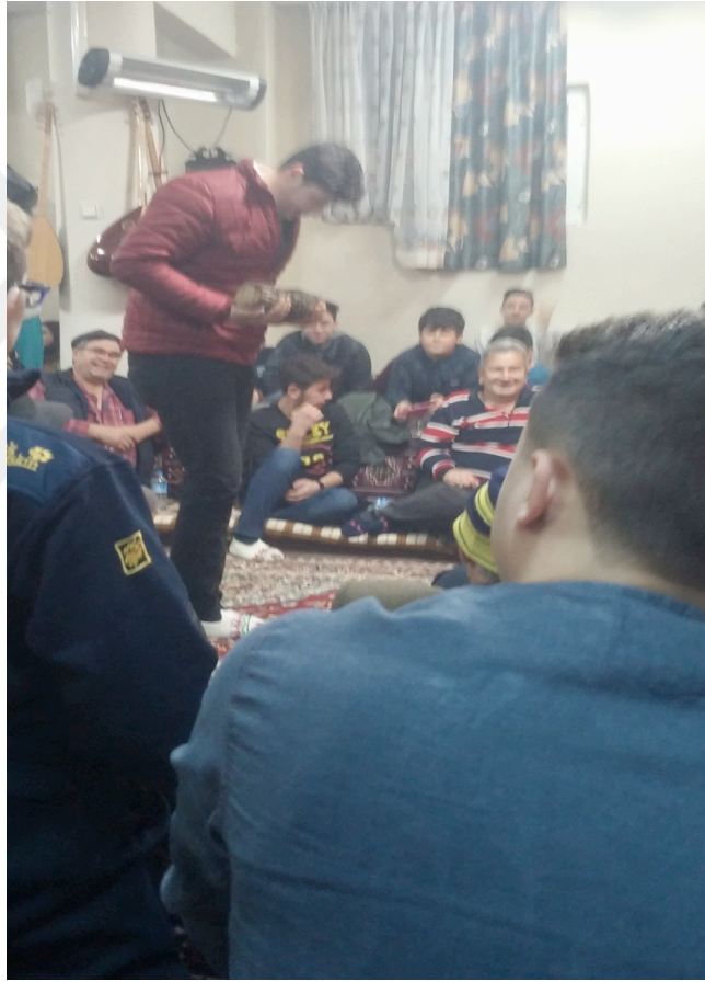
Resim 8: Gençlik Kurbanı Cemi, Saçı Örneği

Araştırmalarda kurban kavramı ile “kanlı” ve “kansız” kurban olarak karşılaşılabilmektedir. Kanlı kurban, toplum tarafından kurban edilmesi kabul görmüş canlılardan oluşurken, kansız kurban ise çeşitli yiyecek ve içeceklerin doğaya bırakılması olarak ifade edilmekte ve “saçı” olarak adlandırılabilir. Resim 8 de, Gençlik Kurbanı içerisinde yer alan saçı örneği görülmektedir.