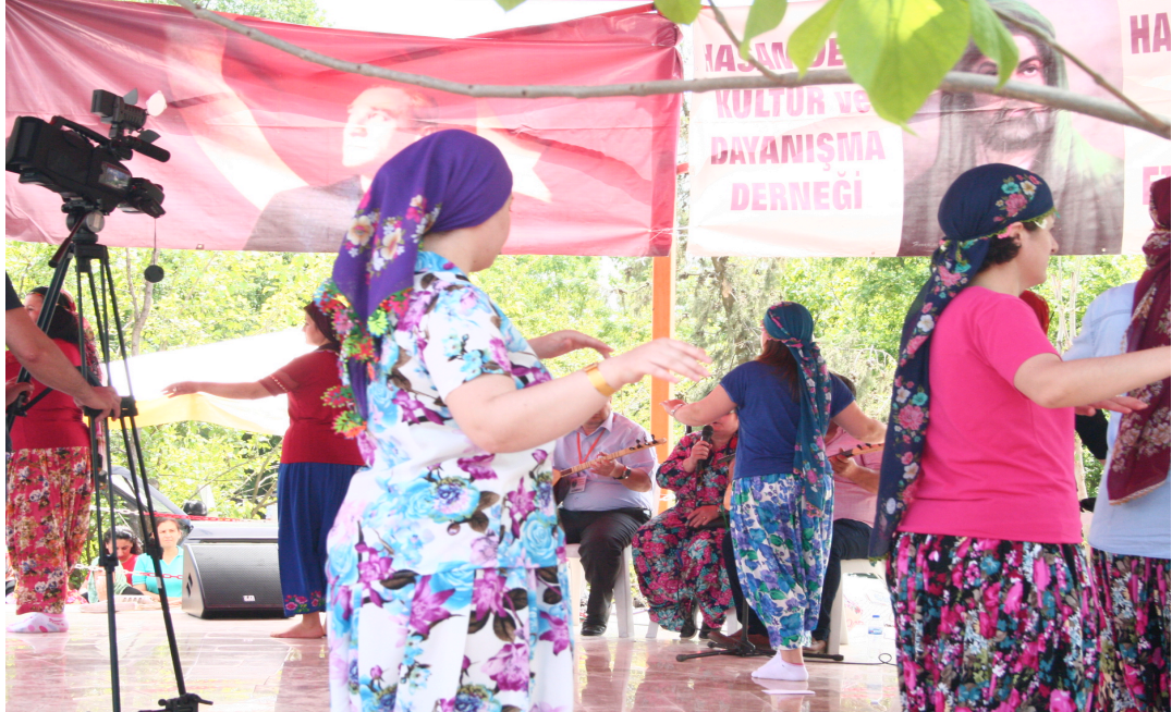
Resim 4: Semah Döner Kadınlar

Müzik ve dansın daha ok erkek temelli olduđu birok kültürel yapıya karřın Őehitler köyünde müzik pratiklerinin icracılarının daha ok kadınlardan oluřması, erkek-kadın icracıların yanında, yalnızca kadınlar tarafından gerekleřtirilen semah örneklerinin de olması bölgenin ayırt edici özelliklerinden biri olarak kabul edilebilir. Resim 4'de yalnızca kadınların yer aldıđı semah örneđi görülmektedir.