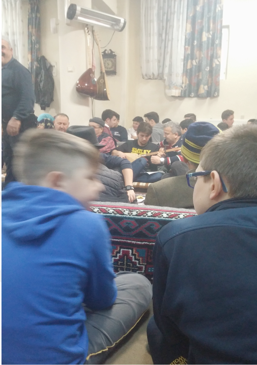
Resim 10: Zakirlik Görevi Aktarımı

Yukarıda açıklanan tüm hizmetler Gençlik Kurbanı Cem törenleri içerisinde yer almaktadır. Tüm bu sembolleri bir araya getiren ve anlamı ortaya koyan ritüel ise Cem törenleri olarak ifade edilebilir.