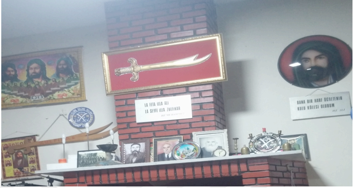
Resim 9: Cemevi İçerisinde Yer Alan Bazı Önemli Semboller

Yukarıda sıralanan semboller ilk olarak göze çarpanlar olarak ifade edilebilir. Bunların haricinde ayrıntıda yer alan mitsel anlam barındıran karakter ve sembollerin bazıları da şu şekilde sıralanabilir: Meydancı ve elindeki çubuk, carcı ve süpürgesi, ibrikçi ve ibrik, Zâkir ve bağlama, Saka suyu, Semah.