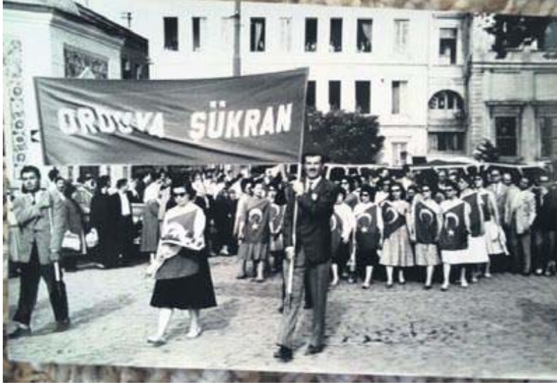
Fotoğraf 1: http://wowturkey.com/forum/viewtopic.php?t=57523&start=60

Türk siyasi hayatında ilk kez gerçekleşen 27 Mayıs askeri darbesi kendisini laik ve Atatürkçü olarak ifade eden kesimler tarafından desteklenmiştir. (EK1, EK2, EK3, EK4). Ordunun halk nezdinde koruyucu ve kurucu hüviyete sahip olması, siyasi otorite ve halk üzerinde gücünü arttırmasına ve itaat algısı yaratmasına sebep olmuştur. 27 Mayıs 1960 darbesinden sonra diğer darbelerin halk tarafından kabul edilmemesine rağmen darbecilere karşı çıkmak ve onları yargılamak mümkün olmamıştır. 19