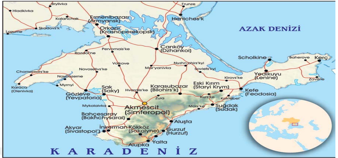
Harita 2. Kırım Siyasi Haritası