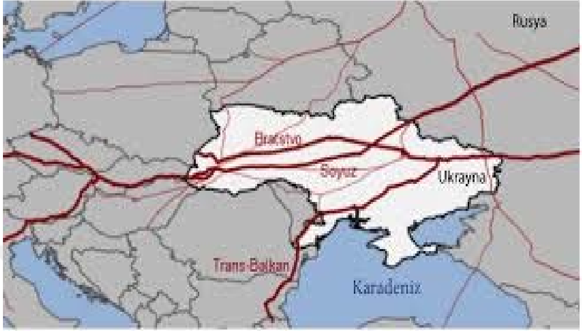
Harita 3. Rus Gazını Avrupa'ya Ukrayna Üzerinden Taşıyan Hatlar