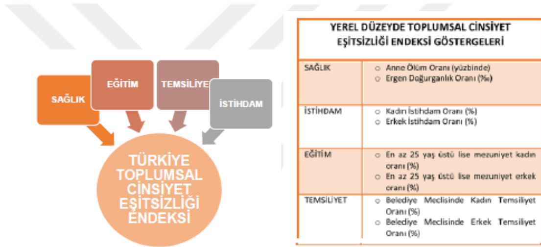
Şekil 2. 1:Türkiye Toplumsal Cinsiyet Eşitsizliği Endeksi

Toplumsal cinsiyet, bireylerin doğdukları andan itibaren üzerlerine yüklenen görevler ile bağdaştırılan kadın ve erkek olma öğretisinin benimsetilmesi sonucu cinsler ayrımının yaşanması durumudur (Korukcu vd., 2012; Ergöçmen vd., 2009). Bu ayrımdan dolayı erkeğin kadın üzerinde birtakım yaptırımlar uygulaması ve şiddete varan eylemlerde bulunması hak gibi görülebilmektedir. Türkiye Ekonomi Politikaları Araştırma Vakfı (2016) tarafından hazırlanan “81 İl İçin Toplumsal Cinsiyet Eşitliği Karnesi” adlı çalışma verileri sonuçları şu şekildedir.