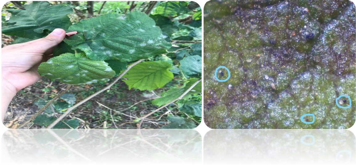
Şekil 1.1. Küllemenin fındık yaprağı üzerindeki belirtileri (sol) ve kleystotesyum yapıları (sağ)