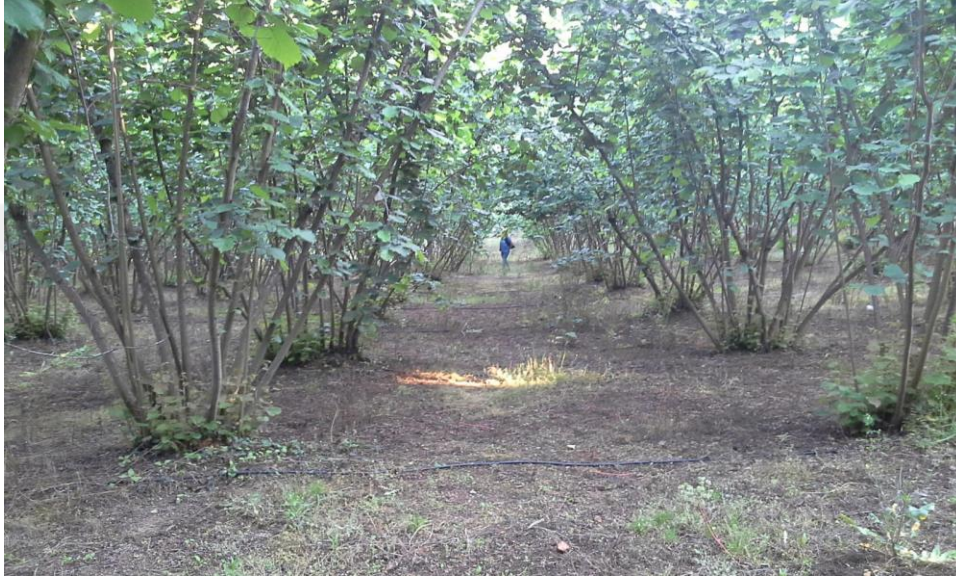
Şekil 3.1 Deneme yapılan fındık bahçesi

Denemenin yer aldığı bahçenin toprak tipi homojen bir özellik gösterip, kumlu killi toprak yapısına sahiptir. Denemenin yürütüldüğü bahçelerde fındık ocakları 15-20 yaşlı verim çağında olup 4 x5 m sıra arası ve sıra üzeri mesafelerle dikilmiştir. Deneme deseni tesadüf blokları deneme desenine göre 4 tekerrürlü olarak kurulmuştur. Her bir tekerrürde 3 ocak olacak şekilde düzenlenmiştir. Bloklar arasında birer ocak bırakılmıştır (Şekil 3.1).