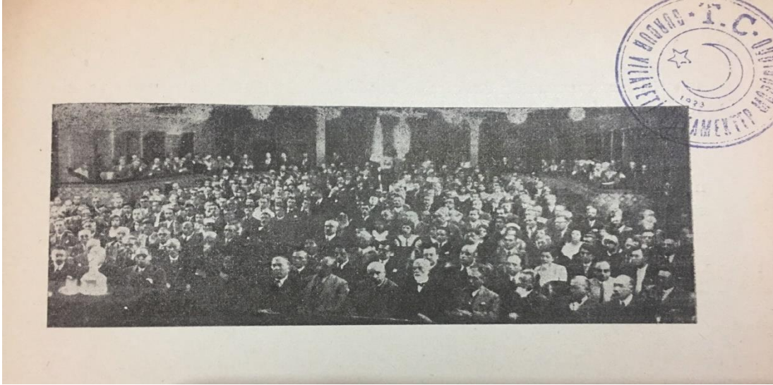
Şekil 1. Birinci Türk Tarih Kongresi'nden bir fotoğraf (Mf.V., 1932, s.V).

Kongrenin açılış konuşmasında Maarif Vekili Mahmud Esad Bey, kongrenin amacını şöyle açıklamıştır: