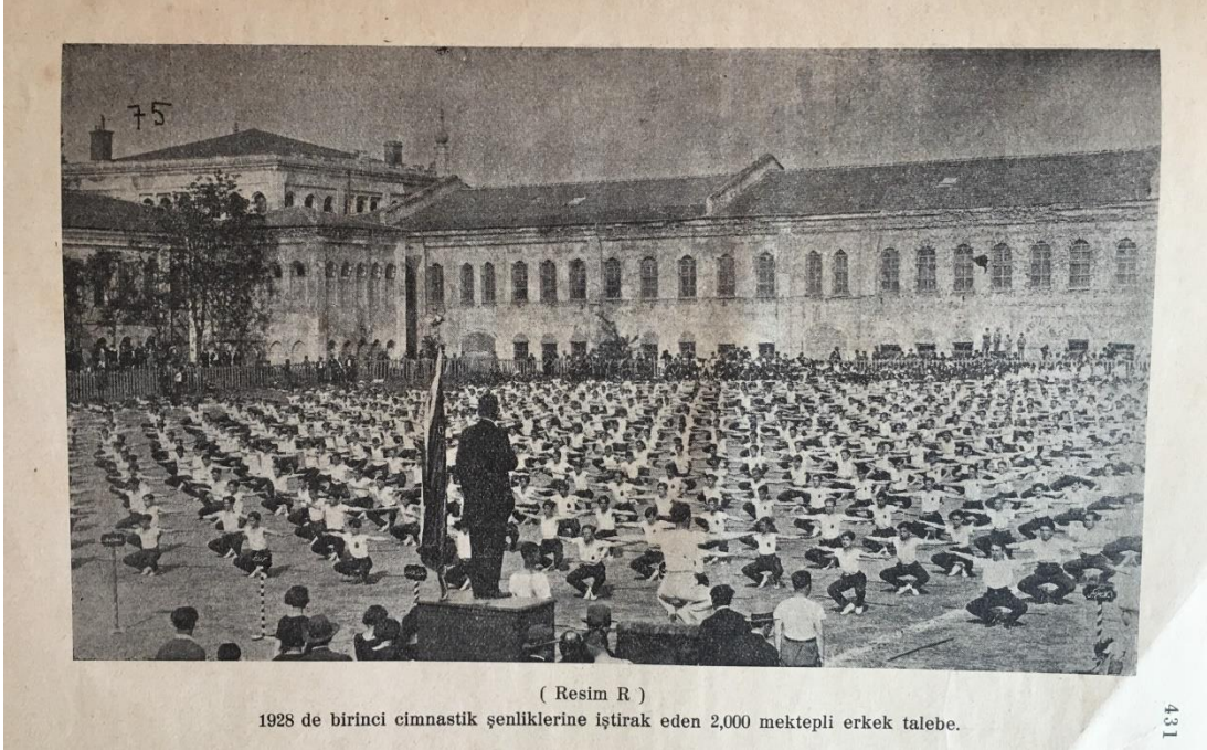
Şekil 3. 1928’de birinci jimnastik şenliklerine iştirak eden 2000 mektepli erkek talebe (Tarcın,1932,s.431).

gençliğinin aktif, enerjik bir imaj çizmesini sağlamıştır. Milletın gelecek kuşaklarının gücünün, hareketliliğinin, dinçliğinin temsilinde önemli olan şenlikler düzenlenmiştir. İlk 19 Mayıs Şenliğı, İstanbul Taksim’de 1928’de yapılmıştır (Tarcın, 1932, s.431).