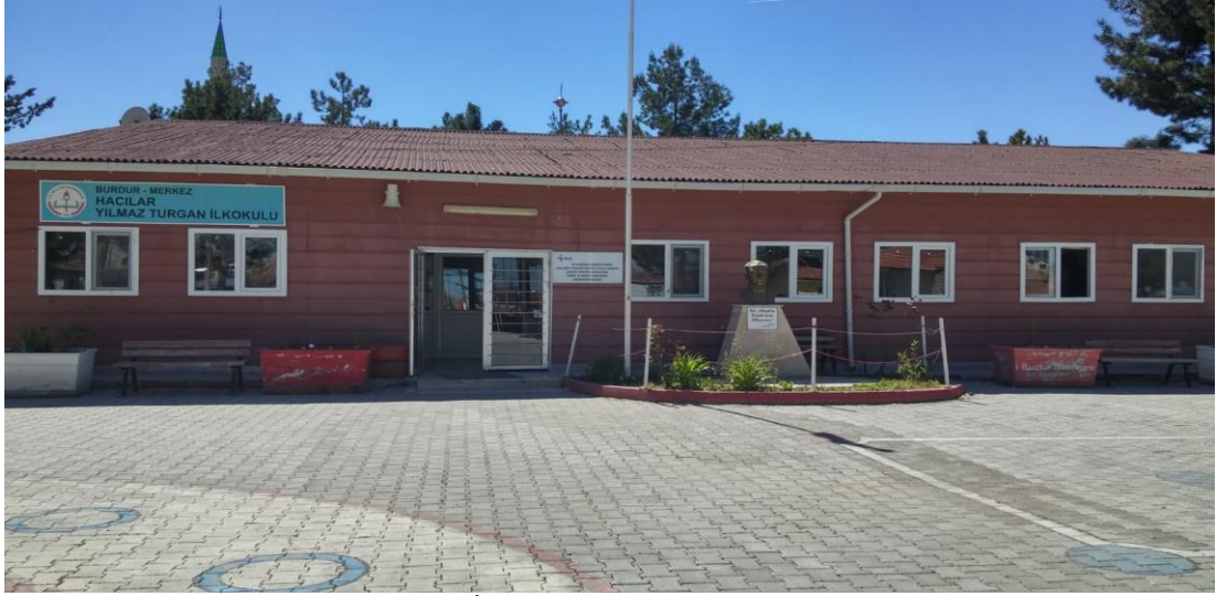
Şekil 30. Hacilar Yılmaz Turgan İlkokulu günümüzde eğitim veren binası.

4.2.2.2. Ortaokullar. Türkiye Cumhuriyeti'nin kurulduktan sonra ortaöğretimin ilk devresini oluşturan ortaokullar, ilk on yıl sadece liselere öğrenci yetiştiren okullar olarak açılmıştır. 1930 yılından sonra orta dereceli meslek okullarının açılmasıyla, bu okullar öğrencileri hem belli bir mesleğe yöneltmeye, hem de liseye hazırlayan kurumlar haline getirilmiştir (Özodaşık, 1999, s. 222).