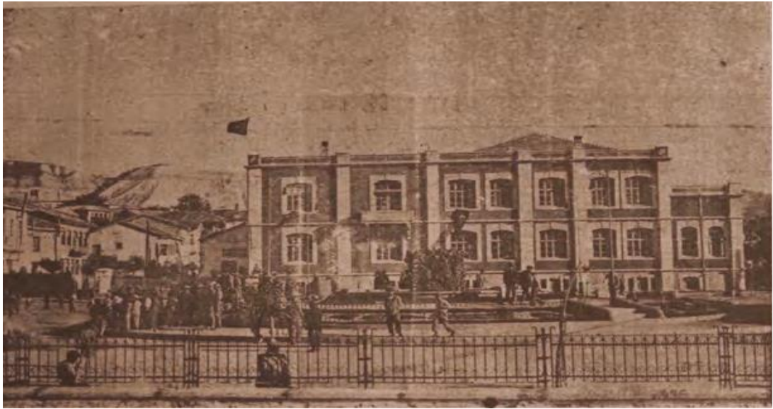
Şekil 34. Halkevi Kütüphanesi'nin içerisinde yer aldığı Halkevi Binası 1936 (Burdur, C.I, Sayı:1, Şubat 1939, s.2.)

Burdur Maarif Müdürlüğü bünyesinde bulunan vakıf kütüphanesi ve halk okuma odasına ait kitaplar 1935 yılında halkevinin açılmasıyla birlikte halkevi kütüphanesine devredilmiştir. Vakıf kütüphane defterine göre devredilen bu kitapların sayısı 2226 cildi eski ve 955 cildi yeni olmak üzere toplam 3181 adettir. Aradan geçen 3 yılda Burdur Halkevi kütüphanesindeki kitap sayısında artış görülmüş, 1938 yılında kitap sayısı 4789’a çıkmıştır. Halkevi kütüphanesinde 1937-1938 yıllarında bir yıllık süre zarfında 24.300 kişi faydalanmıştır. Haziran 1938’den Haziran 1939’a kadar bir yıllık sürede 22.947 kişi halkevini ziyaret etmiş, çeşitli konulara ilgili 1944 kitaptan faydalanmıştır. Kütüphanede yeni eserlerden zaman zaman sergiler düzenlenmiştir. 1940 yılı Mart ayında yapılan sergiye vatandaşlar yoğun bir ilgi göstermiştir. Kütüphanenin haftanın her günü açık olmasına ve okuyucuların kütüphanelerden olabildiğince yararlanmasına dikkat edilmiştir. Kütüphaneye gelen yeni kitaplar ve eserler le ilgili okurlara bilgilendirilmiştir. 1948 yılında kütüphanede bulunan eser sayısı on bini bulmuştur (Özer, 2015, s. 349).