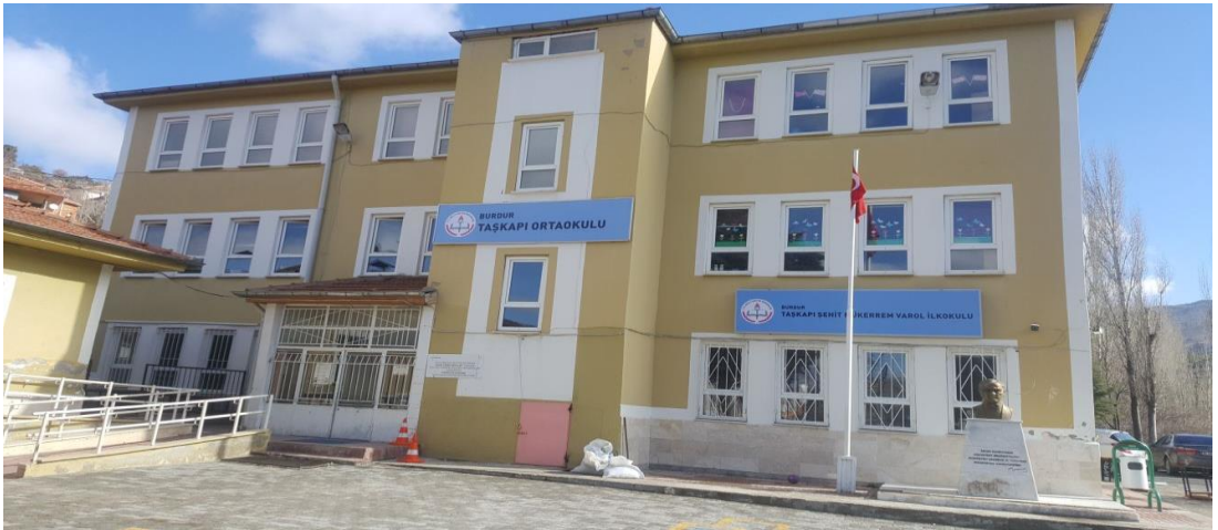
Şekil 23.Taşkapı İlkokulu günümüzde eğitim veren binası.

Taşkapı İlkokulu, 1938 yılında mescit şeklinde yapılan okulda eğitimci Mustafa Acar tarafından 25 öğrenci ile 3 yıllık eğitime başlanmıştır. 1945- 1946 eğitim öğretim yılında 34 kız öğrenci, 31 erkek öğrenci bu okulda öğrenim görmüştür (Erdem, 1946, s. 91).1949 yılında tek derslikli 5 yıllık eğitim veren ilkokul yapılmıştır. 1951 yılında devlet tarafından yeni bir okul binası yapılarak eğitim-öğretime açıldı. Bu okulun ihtiyaca cevap vermemesi yüzünden 1977 yılında yeni okul binası yapılmıştır ve eğitim öğretim günümüzde bu okul binasında devam etmektedir (Özdemir, 1998, s. 63).