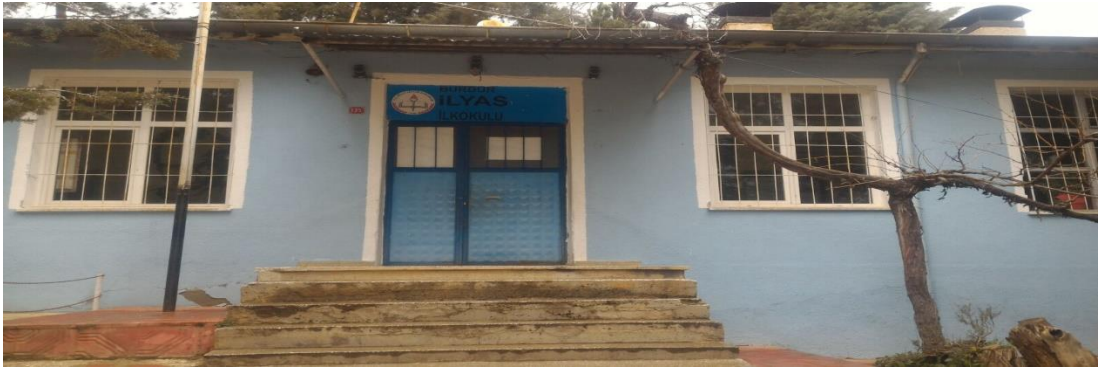
Şekil 20. İlyas Köyü İlkokulu günümüzde eğitim veren binası.

İlyas İlkokulu, 1933 yılında köylü tarafından yapılan binada 3 sınıflı İlyas Köyü İlkokulu olarak açılmıştır. 1945 yılında yapılan yeni okul binasına taşınarak 5 sınıflı ilkokul durumuna geçmiştir. Yeni binaya 1965 yılında ek olarak 2 derslik yapılmıştır. 1978 yılında geçici binada ortaokul açılmıştır. Köylü tarafından yapılan ortaokul 1980 yılında tamamlanmış ve ortaokul yeni binasında eğitim öğretime devam etmiştir (Özdemir, 1998, s. 63).