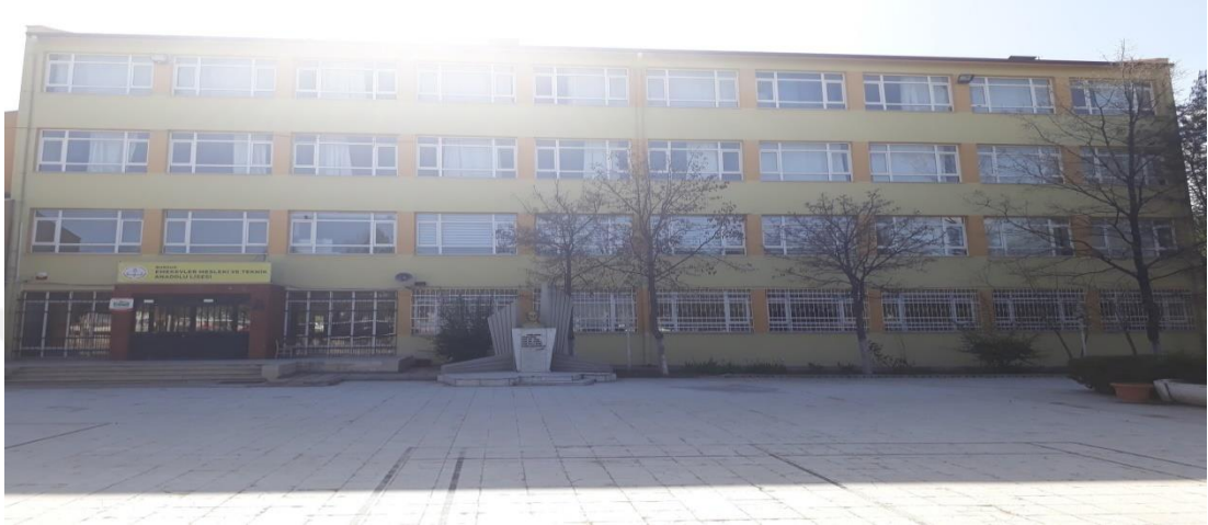
Şekil 32. Burdur Kız Meslek Lisesi günümüzde eğitim veren binası.

ilçede kadın kursu bulunmaktaydı (Burdur Valiliği, 1967, s. 167-168). 1974-1975 öğretim yılında 3. Beş yıllık kalkınma planı hedeflerine ve 9. Milli Eğitim şurası kararlarına uygun olarak Kız Meslek Lisesi adını almıştır (Özdemir, 1998, s. 53). Günümüzde Emekevler Mesleki ve Teknik Anadolu Lisesi ismiyle eğitim-öğretime devam etmektedir.