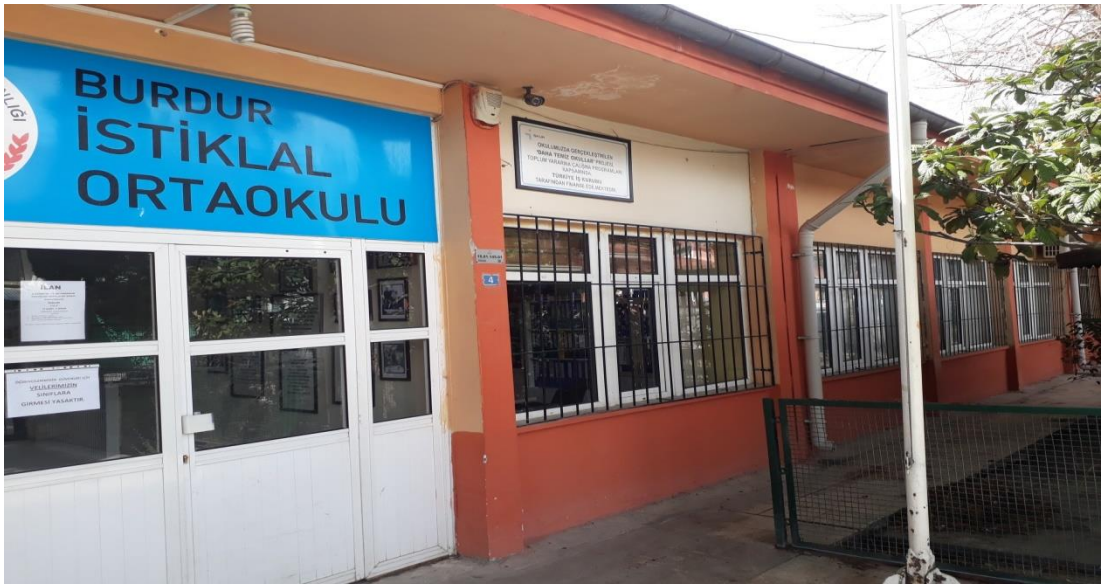
Şekil 26. İstiklal Ortaokulu günümüzde eğitim veren binası.

İstiklal İlkokulu, Okul 1905 yılında Karasenir Mahallesi'nde iki odalı bir evde Fevziye Okulu adında eğitim-öğretime başlamıştır. Okulun ilk öğretmeni Hasan Tecimen'dir. 1922 yılında Ekmekçi Tomos'un evi, Başöğretmen İsmail Hakkı tarafından okul olarak kullanılmaya başlanmıştır. İki katlı, 6 odalı olan bu binada 5 sınıfla eğitim-öğretime devam etmiştir. 1943 yılına kadar Fevziye İlkokulu olarak eğitime devam eden okulun ismi, 1944 yılında İnönü İlkokulu olarak değişmiştir. 1953 yılında okulun adı İstiklal İlkokulu olarak değiştirilmiştir. 1965 yılında 10 derslikli olarak hizmete açılan okul günümüzde de bu binada eğitim öğretime devam etmektedir (Özdemir, 1998, s. 55).