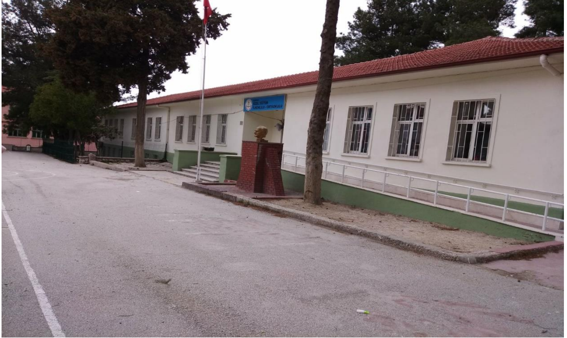
Şekil 9.Cumhuriyet İlkokulu binası günümüzde Özel Eğitim İlkokulu ve Ortaokulu