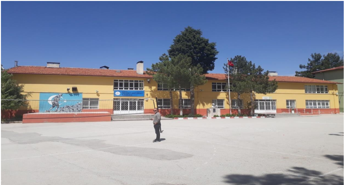
Şekil 11. Mehmet Akif Ersoy İlkokulu günümüzde eğitim veren binası.