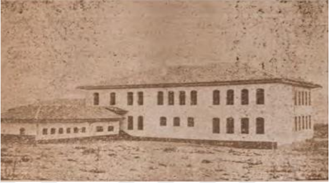
Şekil 13. Askeriye Yatılı Okulu-1939 (Burdur Halkevi Dergisi, C.1, Sayı:3, s.9)