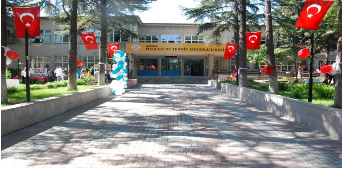
Şekil 33. Burdur Mesleki ve Teknik Anadolu Lisesi günümüzde eğitim veren binası.

4.2.2.4. Üniversiteler. Cumhuriyet Dönemi'nde Burdur'da araştırma zamanımız olan 1923-1950 yılları arasında bir üniversite bulunmamaktadır.