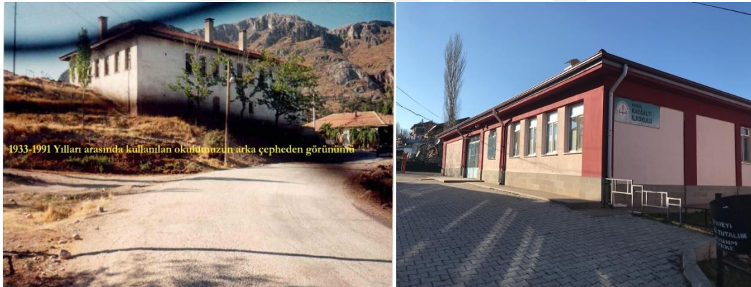
Şekil 21. Kayaaltı İlkokulu eski binası ve günümüzde eğitim veren binası.

yapmışlardır (Pamukçuoğlu,1939,s.12). Son iki öğretmenin Cumhuriyet Dönemi öğretmenleri oldukları anlaşılmaktadır. Tahir Efendi 1933-34 senelerinde köyde yeni bir okul binası yapımına öncülük etmiş ve 1939’da 400 lira harcanarak okulun üzeri kiremitle örtülmüştür (Pamukçuoğlu,1939,s.12; Pamukçuoğlu,1939,s.10). Okula ait 1924-1925 eğitim öğretim yılında Osmanlıca olarak yazılmış sınıf geçme defterlerinde bulunmaktadır. Sınıf geçme defterinde 1 nolu öğrenci olarak Hüseyin Efendi yazmaktadır. Latin harfleri ile ilk kayıtlar 1928-1929 öğretim yılına ait şahadetname ve tasdikname defterlerinden anlaşılmaktadır. Ders yılı raporlarındaki kayıtlara göre 1932-1933 eğitim öğretim yılından 1934-1935 eğitim öğretim yılı sonuna kadar “Kıravkaz İlk Mektebi” olarak anılmış, 1934-1935 öğretim yılı sonundan 1949-1950 eğitim öğretim yılı sonuna kadar da “Kıravkaz Köyü İlkokulu” olarak adlandırılmıştır. 1945- 1946 eğitim öğretim yılında 72 kız öğrenci, 110 erkek öğrenci bu okulda öğrenim görmüştür (Erdem, 1946, s. 91). 1974-1975 eğitim-öğretim yılında ortaokul açılmıştır. 1991-1992 öğretim yılında ilkokulla ortaokul birleştirilerek ilköğretim okulu olmuştur (Özdemir, 1998, s. 63).