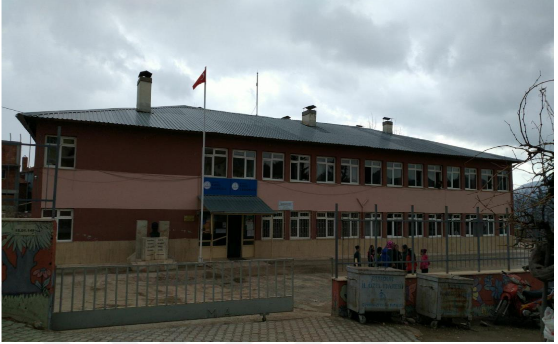
Şekil 22.Kayış İlkokulu günümüzde eğitim veren binası.

Taşkapı İlkokulu, 1938 yılında mescit şeklinde yapılan okulda eğitimci Mustafa Acar tarafından 25 öğrenci ile 3 yıllık eğitime başlanmıştır. 1945- 1946 eğitim öğretim yılında 34 kız öğrenci, 31 erkek öğrenci bu okulda öğrenim görmüştür (Erdem, 1946, s. 91).1949 yılında tek derslikli 5 yıllık eğitim veren ilkokul yapılmıştır. 1951 yılında devlet tarafından yeni bir okul binası yapılarak eğitim-öğretime açıldı. Bu okulun ihtiyaca cevap vermemesi yüzünden 1977 yılında yeni okul binası yapılmıştır ve eğitim öğretim günümüzde bu okul binasında devam etmektedir (Özdemir, 1998, s. 63).