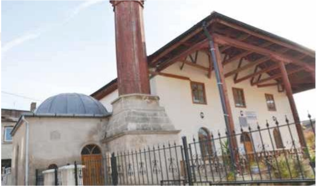
Şekil 5.Hacı İsmail Ağa Camii ve Kütüphanesi