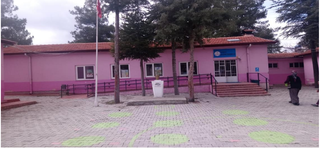
Şekil 15. Aziziye İlkokulu günümüzde eğitim veren binası.

Çatağıl İlkokulu, Köyde eğitim-öğretim 1935 yılından 1946 yılına kadar eğitimciler tarafından 3.sınıfa kadar sürdürülmüştür. 1946 yılında planlı bir okul binası yapılmıştır. Yaşar Özkan ve Hasan Çeliker isimli öğretmenlerle 5 yıllık eğitim-öğretime başlanmıştır. 1995 yılına kadar bu binada faaliyetlerini sürdüren okul yıkılmış yerine 1995 yılında yeni okul binası yapılmıştır (Özdemir,1998,s.63).