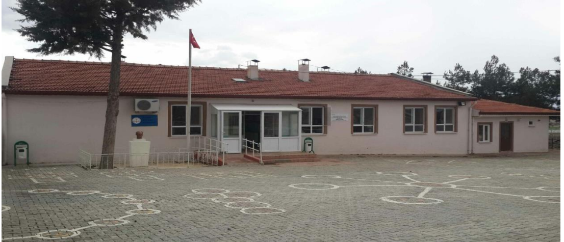
Şekil 16. Çatağıl İlkokulu günümüzde eğitim veren binası.

Çatağıl İlkokulu, Köyde eğitim-öğretim 1935 yılından 1946 yılına kadar eğitimciler tarafından 3.sınıfa kadar sürdürülmüştür. 1946 yılında planlı bir okul binası yapılmıştır. Yaşar Özkan ve Hasan Çeliker isimli öğretmenlerle 5 yıllık eğitim-öğretime başlanmıştır. 1995 yılına kadar bu binada faaliyetlerini sürdüren okul yıkılmış yerine 1995 yılında yeni okul binası yapılmıştır (Özdemir,1998,s.63).