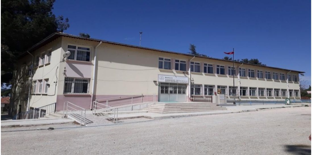
Şekil 14. Şehit Hazım Bey (Askeriye) İlkokulu günümüzde eğitim veren binası.

Aziziye İlkokulu, 1945 yılında imece usulü ile yapılan okul binada Aziziye İlkokulu eğitim öğretime başlamıştır. 1947 yılında bahçe ağaçlandırılması yapılmıştır. 1945-1946 eğitim öğretim yılında 67 kız öğrenci, 137 erkek öğrenci bu okulda öğrenim görmüştür (Erdem, 1946, s. 92) 1971 yılında depremden hasar gören okul binasının yerine 2 ek bina yapılmış ve 1973 yılında hizmete girmiştir (Özdemir, 1998, s. 63).