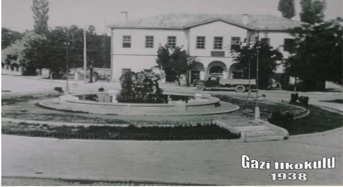
Şekil 7.1938 Gazi İlkokulu