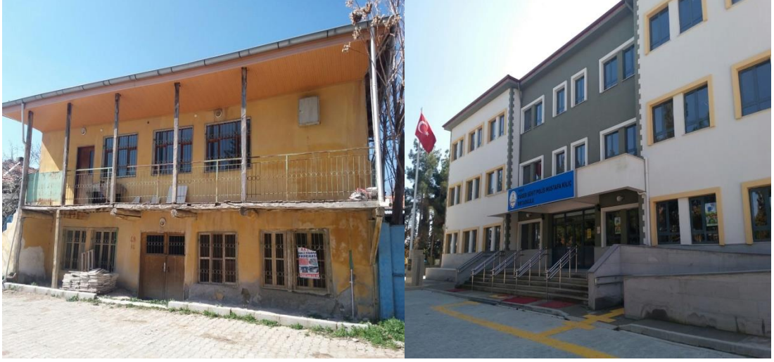
Şekil 17. Düğer İlkokulu eski binası ve günümüzde eğitim veren binası.

Gökçebağ İlkokulu, 1940 yılında bir evde 3 yıl olarak bir eğitimle eğitim-öğretime yapılmaya başlanmıştır. 1943 yılında bir derslik, bir işlik ve lojman olarak yapılan okul 1981 yılına kadar kullanılmıştır. Günümüzdeki okul binası 1981 yılında 2 katlı, 14 derslikli olarak inşa edilmiş ve eğitim öğretime günümüzde bu binada devam edilmektedir (Özdemir, 1998, s. 63).