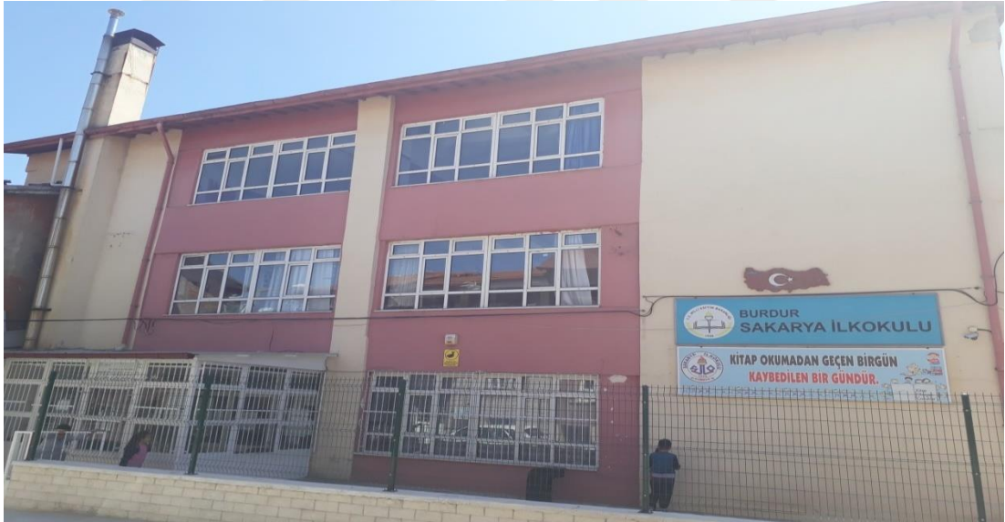
Şekil 27. Sakarya İlkokulu günümüzde eğitim veren binası.

Sakarya İlkokulu, Burdur'un Yoğurtçu Mahallesi'nde 1895-1896 yılları arasında açıldığı tahmin edilen bu okul Burdur'da açılan ilk mekteptir. Burdur'da açılan ilk iptidai mektebine 18 Aralık 1893 tarihinde Mustafa Efendi adında bir öğretmen atanmıştır. Mustafa Efendi'nin 1893 tarihinde atanması bu mektebin 1893 tarihinde açıldığının kuvvetli bir göstergesidir. Toprak dam bir kiliseden çevrilerek sağ tarafta Mescid-i Osman, sol tarafta Muallim Sıbyan gibi bölümler yapılarak bir eğitim yuvası haline getirilmiştir. Hacıoğlu Sıbyan Mektebi diye anılmaya başlanan okul 1903 yılında yeniden yapılmıştır. Öğretmeni Konyalı Mustafa Efendi olduğu için Konyalı Mektebi diye anılmıştır. Burdur'da meydana gelen 1914 depreminde yıkılan okulun yerine yeni bir bina yapılmıştır. 1917 yılında bazı değişiklikler yapılarak Rehber-i İntizam adıyla ortaokul seviyeli bir okul haline getirildi. Kurtuluş Savaşı'ndan sonra okulun adı Sakarya olarak değiştirilmiştir. 1925 yılında okul bahçesi genişletildi. 1959-1960 yılında 5 sınıflı bir okul yapıldı. Okul günümüzde Sakarya Mahallesinde ilkokul olarak eğitim öğretime devam etmektedir (Özdemir, 1998, s. 55).