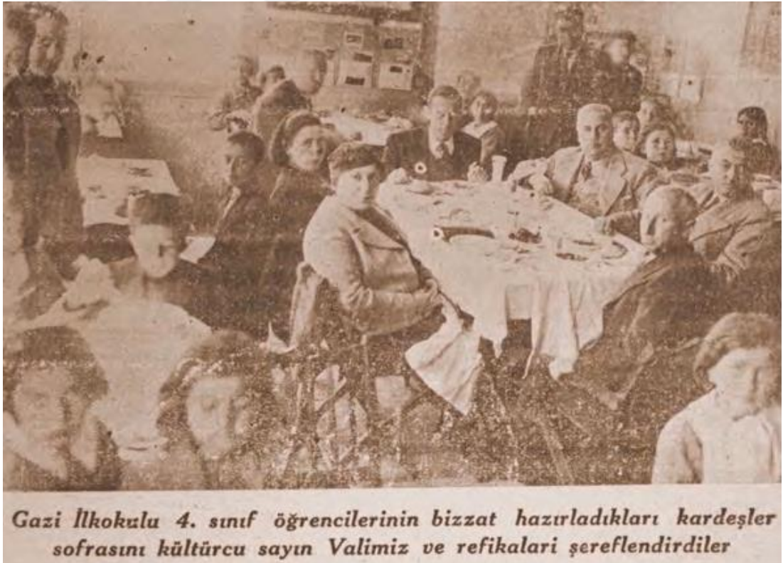
Şekil 6. Dönemin Valisi Abdülhak Savaş Gazi İlkokulu öğrencileri (Burdur Halkevi Dergisi, C.1, Sayı:5, s.13).

4.2.2.1.1. Burdur'da Açılan İlkokullar. Gazi İlkokulu, Atatürk Burdur'a geldiğinde (6 Mart 1930) kendisine hediye edilmek üzere günümüzde Belediye Sarayı'nın olduğu yerde bir köşk inşa edilmiştir. Atatürk bu hediye kabul ederek, okul olarak kullanılmak üzere Burdur halkına armağan etmiştir. Bina 29 yıl kesintisiz eğitime devam etmiştir. 1959 yılından 2017'ye kadar Gazi Caddesi'nde bulunan ve 2018 yılında yıkılan binada eğitim öğretime devam etmiştir. Gazi İlkokulu Burdur'un hem eğitim hem de kültürel hayatında oldukça önemli rol oynamış bir okuldur. Cumhuriyet'in ilk yıllarında devlet erkânı bu okuldaki törenlere katılır ve verilen eğitimi bizzat takip ederlerdi. Mesela şekil 6'da görüldüğü gibi dönemin Burdur Valisi öğrencilerin hazırladıkları bir etkinliğe katılmıştır. Bu ziyaretler hem teftiş hem de öğrenci ve öğretmenlere destek özelliği taşımaktaydılar. Ziyaretler şekil 6'da görüldüğü gibi haber değeri taşıyan olaylardı. Kardeşlik sofrası daha sonra yerli malı olacak haftanın ilk örneğidir. Kardeşlik sofrası gününde öğrenciler derslerde öğrendikleri teorik bilgileri pratiğe dökerek hazırladıkları yemek vs. diğer şeyleri arkadaşları ile paylaşırlardı. 1939'da okulun başöğretmeni Hüseyin Gülyurd idi. Masa'nın başında ev sahibi konumunda olan kişidir. Sağ üstte ise vali görülmektedir.