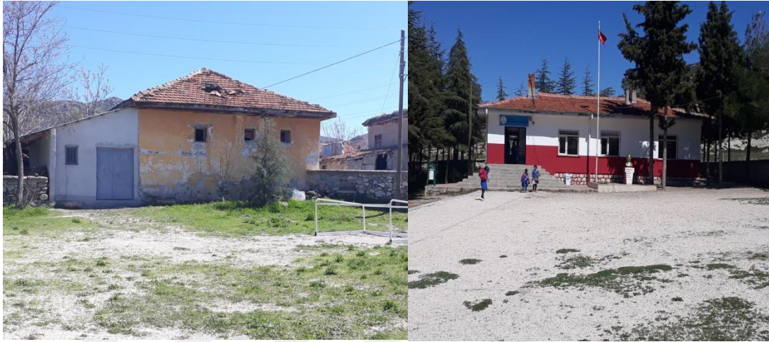
Şekil 12. Akyaka İlkokulu eski binası ve günümüzde eğitim veren binası.

Akyaka İlkokulu, Akyaka köyünde eğitim-öğretime 1925-1926 yıllarında cami avlusu içindeki 2 odalı bir binada başlanmıştır. 3 yıllık eğitim-öğretim yapan okulun ilk öğretmeni Fahriye Hanım'dır. Kayıtlara göre ilk resmi öğrenci kütüğü 1939 yılında eğitimci Mustafa Kılınç tarafından tutulmuştur. 1944-1945 yılında yeni bina yapılarak 5 sınıfla eğitim öğretime devam etmiştir (Özdemir, 1998, s. 62-63). 1945-1946 eğitim öğretim yılında 38 kız öğrenci, 930 erkek öğrenci bu okulda öğrenim görmüştür (Erdem, 1946, s. 90).