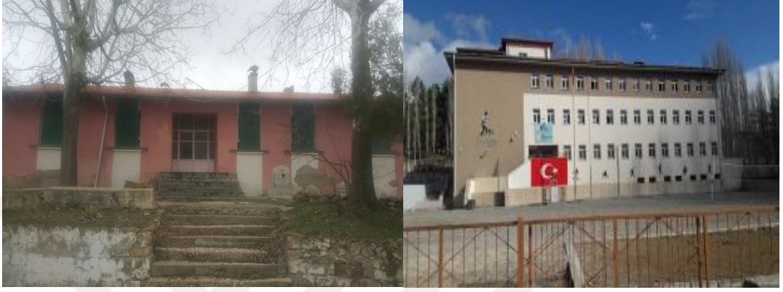
Şekil 19. Halıcılar Vefik Kitapçığı İlkokulu eski ve günümüzde eğitim veren yeni binası.

öğrenci, 89 erkek öğrenci bu okulda öğrenim görmüştür (Erdem, 1946, s. 91). Köyün adının Karcılar olarak değiştirilmesiyle, okulun adı da Karcılar İlkokulu olmuştur. Halıcılığın gelişmesiyle 1973 yılında köyün adı Halıcılar, okulun adı ise Halıcılar İlkokulu olmuştur (Özdemir, 1998, s. 63). Günümüzde Vefik Kitapçığı İlkokulu adını almıştır.