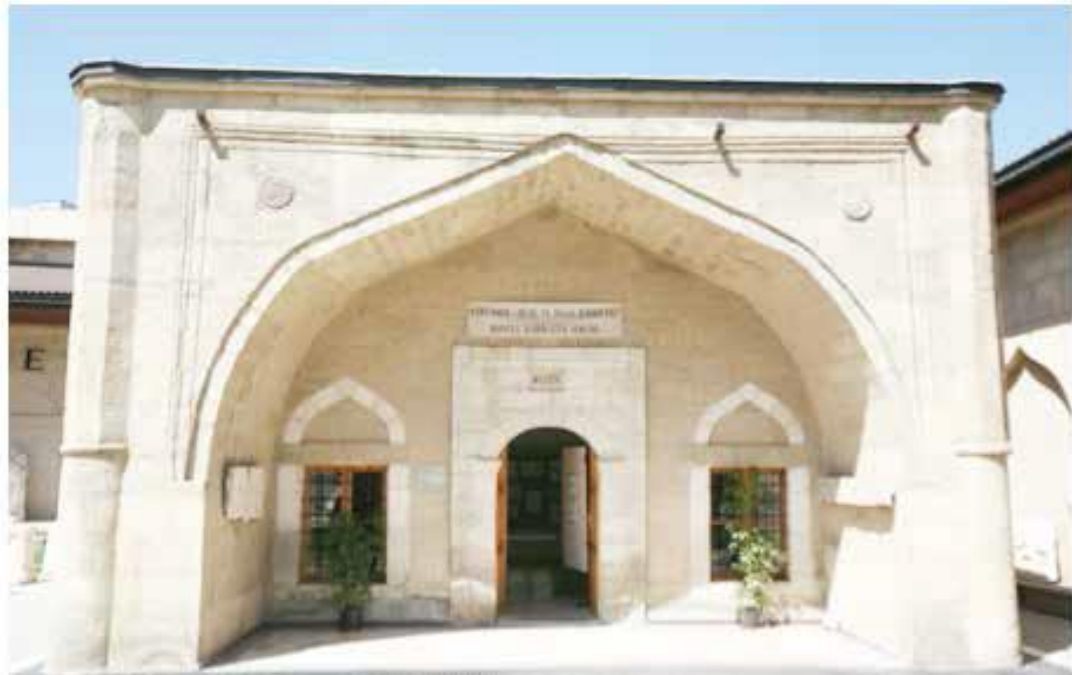
Şekil 4. Küçük Şeyh Mustafa Kütüphanesi.

1971 Burdur depreminde ağır hasar gördüğünden dolayı Eski Eserler ve Müzeler Genel Müdürlüğü tarafından 1972 yılında onarılmıştır. Günümüzde de ayakta olan bu bina bir dönem Kültür ve Turizm Bakanlığı Yayınları Satış Mağazası olarak hizmet vermiştir. Günümüzde ise Müze Müdürlüğü tarafından sergi salonu olarak kullanılmaktadır (Yılmaz, 2015, s. 956).