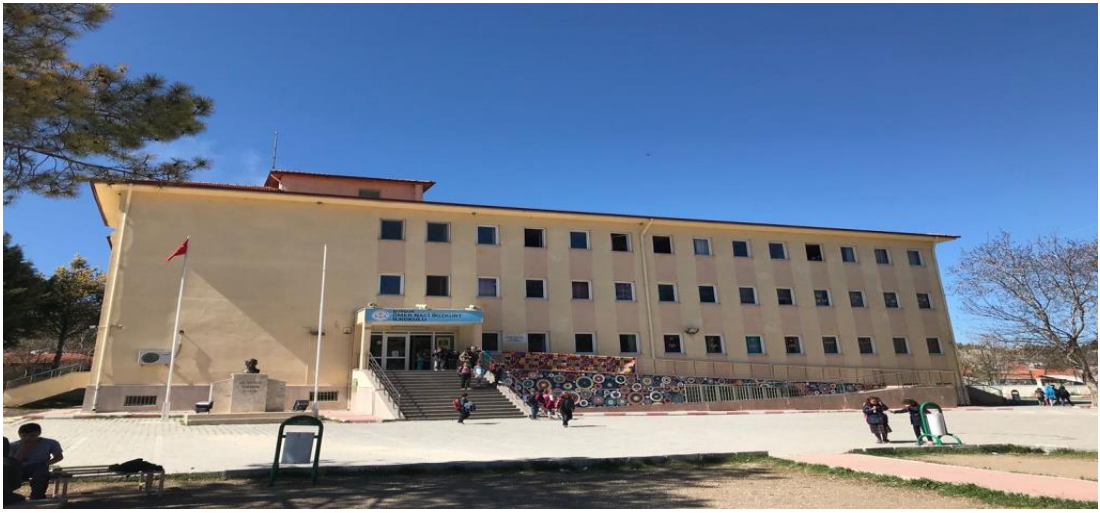
Şekil 29. Buğdüz Ömer Naci Bozkurt İlkokulu günümüzde eğitim veren binası.

Buğdüz Ömer Naci Bozkurt İlkokulu, Buğdüz Köyü İlkokulunun eğitim-öğretime ne zaman başladığı kesin olarak bilinmemektedir. 1927'den önce Arap harfleriyle eğitim veren okul 5 yıl üzerinden mezun vermiştir. 1928 yılından sonra Latin alfabesiyle eğitim öğretime devam etmiştir. 3 sınıfı bulunan okulda eğitim-öğretim 1944 yılına kadar devam etmiştir. 1944 yılında köylülerin katkısıyla yeni bir okul yapılmıştır. 1944-1945 yılında 5 yıllık öğretime geçmiştir. (Özdemir, 1998, s. 55). 1945- 1946 eğitim öğretim yılında 52 kız öğrenci, 112 erkek öğrenci bu okulda öğrenim görmüştür (Erdem, 1946, s. 91).