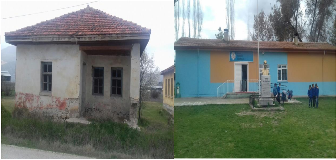
Şekil 24. Yarıköy İlkokulu eski binası ve günümüzde eğitim veren binası.

Yarıköy İlkokulu, 1929 yılında Yeni Türk Alfabesiyle öğretmen Şükrü Öner ile 3 sınıflı olarak eğitim-öğretime başlamıştır. 4. ve 5. Sınıflar Hacılar Köyü'nde eğitim öğretime devam etmiştir. 1946 yılında 5 sınıflı okul yapılarak hizmete girmiş, Hacılar köyüne giden öğrenciler kendi köylerinde öğrenimlerini sürdürmeye başlamışlardır. 1945- 1946 eğitim öğretim yılında 42 kız öğrenci, 59 erkek öğrenci bu okulda öğrenim görmüştür (Erdem, 1946, s. 91). Okul ilk mezunlarını 1947 yılında vermiştir. 1971 yılında depremde yıkılan okul yerine devlet aracılığı ile 1972 yılında yeni okul binası yapılmıştır (Özdemir, 1998, s. 63).