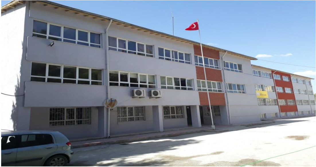
Şekil 31. Burdur Lisesi günümüzde eğitim veren binası.

Lise binası ise 1971 yılında depremden dolayı tamamen hasar görmüş, aynı yıl 7 adet baraka inşa ettirilerek eğitim öğretim barakalarda devam etmiştir. Günümüzde eğitim veren okul binasının temeli 1972 yılında atılmış ve 1974 yılında inşaat bitirilerek ortaokul ve lise olarak öğretime açılmıştır ( http://burdurlisesi.meb.k12.tr/ )