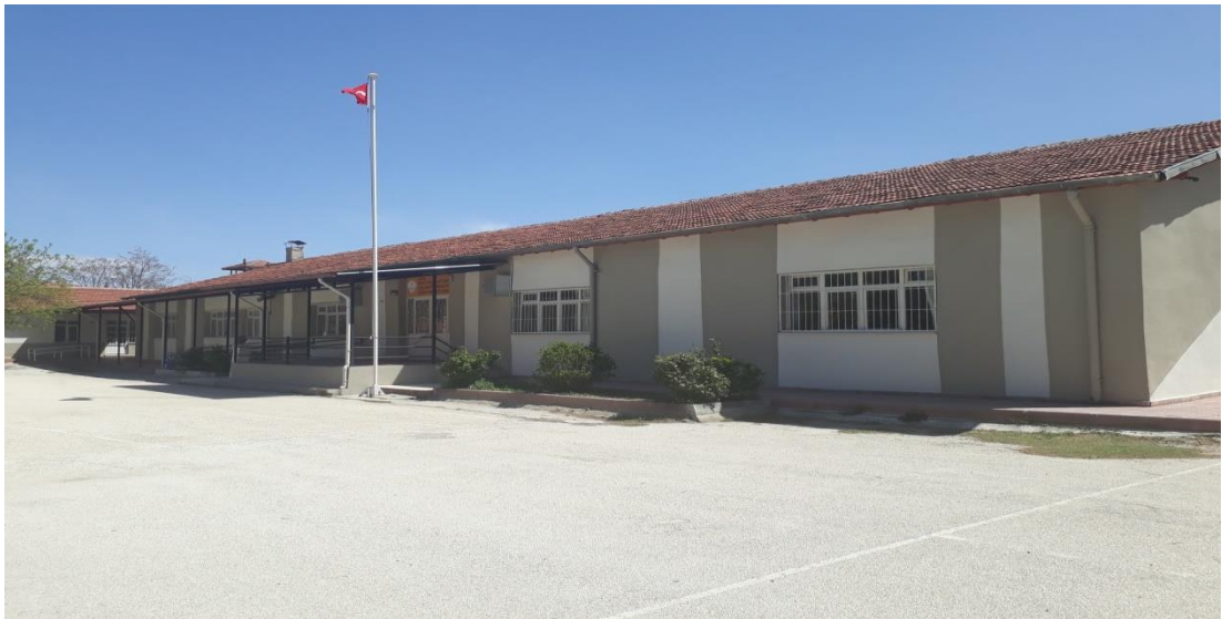
Şekil 28. Turan İlkokulu binası günümüzde Şehit Hakan Aktürk Özel Eğitim Mesleki Eğitim Merkezi.