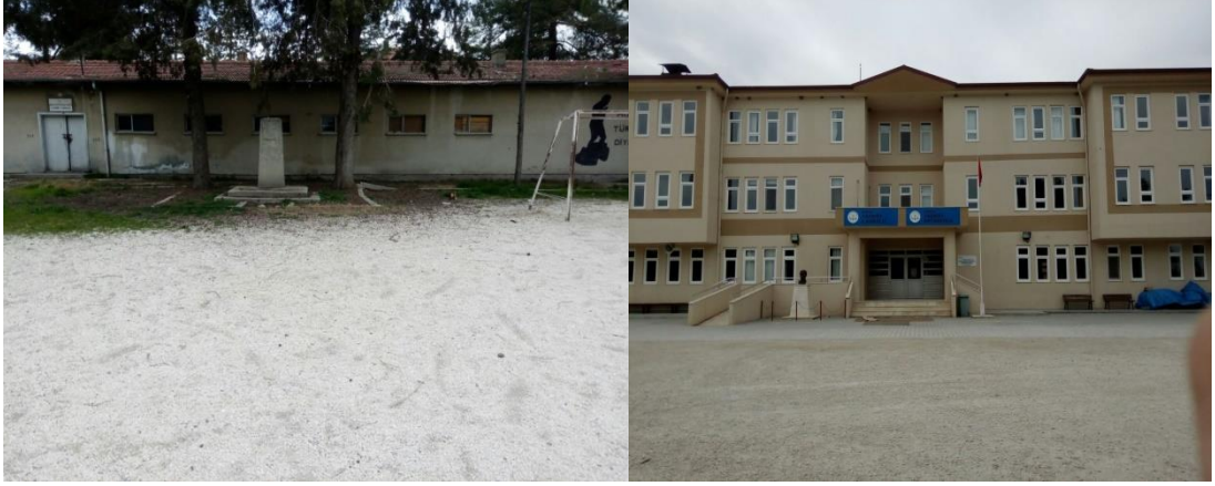
Şekil 25. Yazıköy İlkokulu eski binası ve günümüzde eğitim veren binası.

İstiklal İlkokulu, Okul 1905 yılında Karasenir Mahallesi'nde iki odalı bir evde Fevziye Okulu adında eğitim-öğretime başlamıştır. Okulun ilk öğretmeni Hasan Tecimen'dir. 1922 yılında Ekmekçi Tomos'un evi, Başöğretmen İsmail Hakkı tarafından okul olarak kullanılmaya başlanmıştır. İki katlı, 6 odalı olan bu binada 5 sınıfla eğitim-öğretime devam etmiştir. 1943 yılına kadar Fevziye İlkokulu olarak eğitime devam eden okulun ismi, 1944 yılında İnönü İlkokulu olarak değişmiştir. 1953 yılında okulun adı İstiklal İlkokulu olarak değiştirilmiştir. 1965 yılında 10 derslikli olarak hizmete açılan okul günümüzde de bu binada eğitim öğretime devam etmektedir (Özdemir, 1998, s. 55).