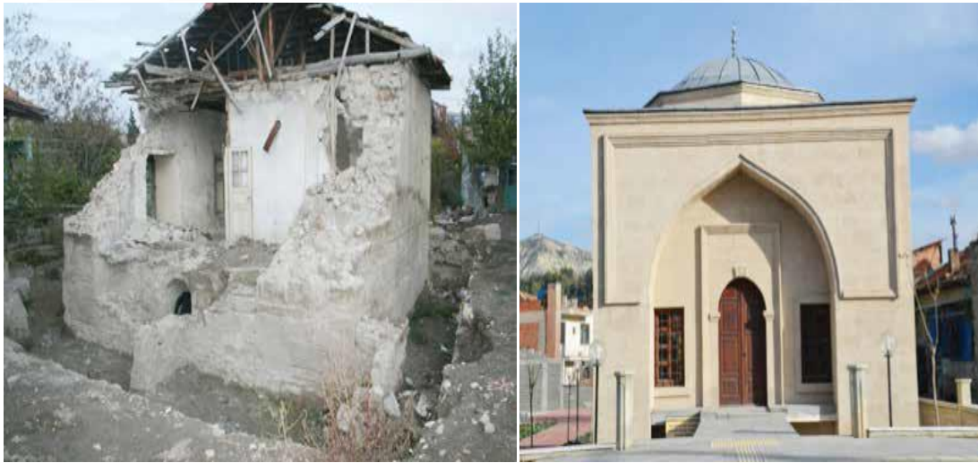
Şekil 3. Sadrazam Derviş Mehmed Paşa Kütüphanesi'nin restore edilmeden önceki hali (Yeni Gün Gazetesi, 31 Mart 2017 Cuma) ve günümüzdeki hali.

Kütüphane binası 1914 depreminde çok ağır hasar görmüş ve yıllarca bakımsız halde kalmış, kütüphane binası uzun bir zaman ev olarak kullanılmıştır. Bu binanın Derviş Mehmet Paşa Kütüphanesi olduğu tespit edilince Burdur Belediyesi kütüphaneyi tescil ettirip satın almıştır. Kütüphane binası aslına uygun bir şekilde restore edilmiş; ancak hâlihazırda hizmete açılmıştır.