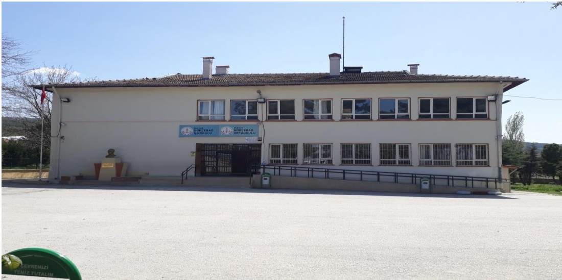
Şekil 18. Gökçebağ İlkokulu günümüzde eğitim veren binası.

Gökçebağ İlkokulu, 1940 yılında bir evde 3 yıl olarak bir eğitimle eğitim-öğretime yapılmaya başlanmıştır. 1943 yılında bir derslik, bir işlik ve lojman olarak yapılan okul 1981 yılına kadar kullanılmıştır. Günümüzdeki okul binası 1981 yılında 2 katlı, 14 derslikli olarak inşa edilmiş ve eğitim öğretime günümüzde bu binada devam edilmektedir (Özdemir, 1998, s. 63).