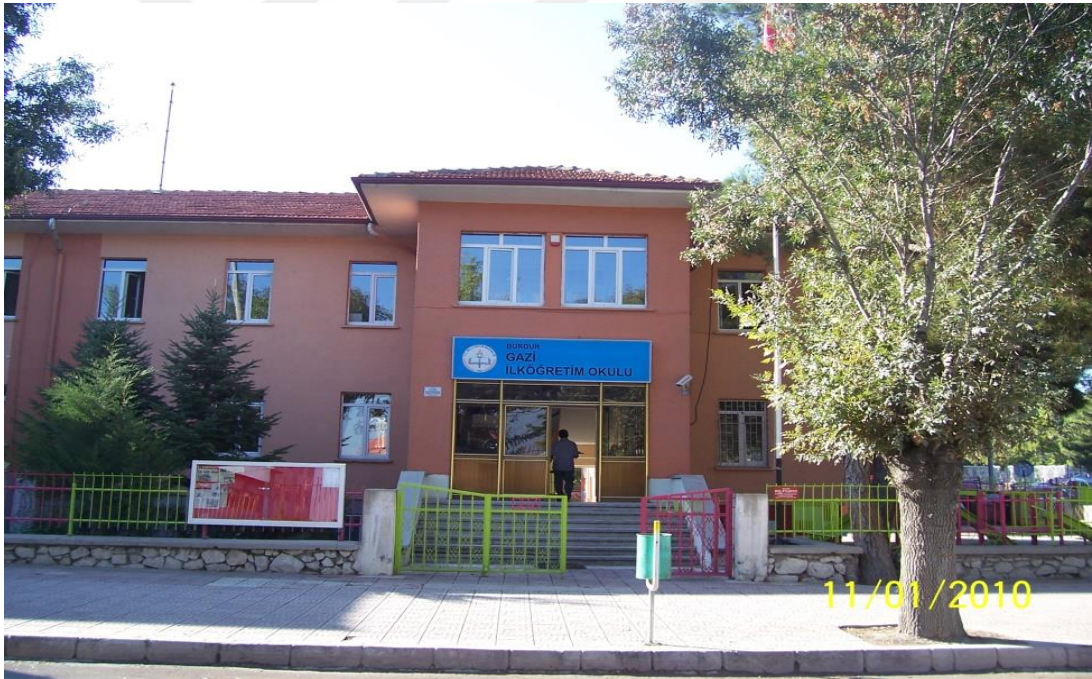
Şekil 8.Yıkılmadan önce Gazi İlköğretim Okulu