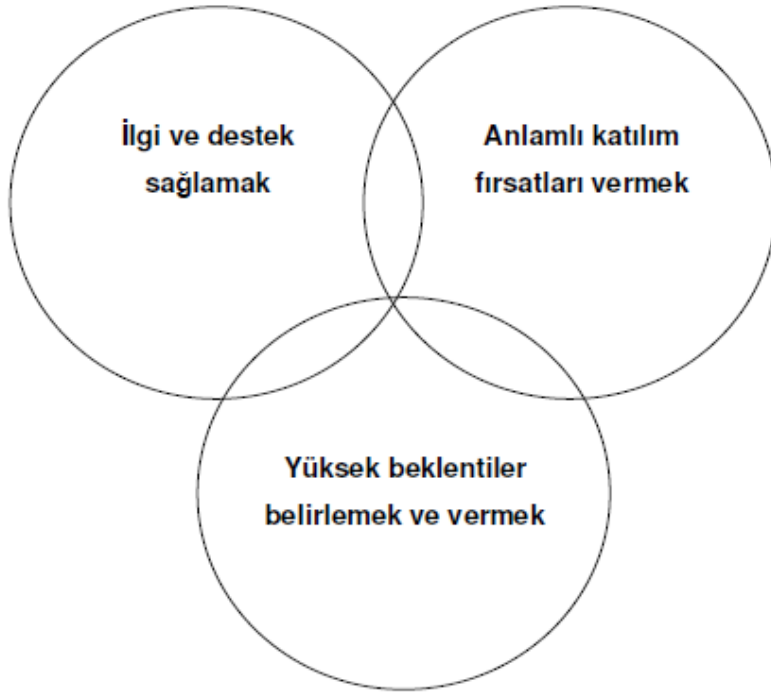
Şekil 2. Yılmaz gençler yetiştirme anahtarı

Şekil 2 incelendiği zaman dairelerin birbirleri ile ilişkili oldukları görülür. Çocuğa ilgi ve destek sağlamak, anlamlı katılım ve fırsatlar vermek, ondan beklentileri olduğunu hissettirmek çocuğun yılmazlığını geliştirmesinde etkilidir.