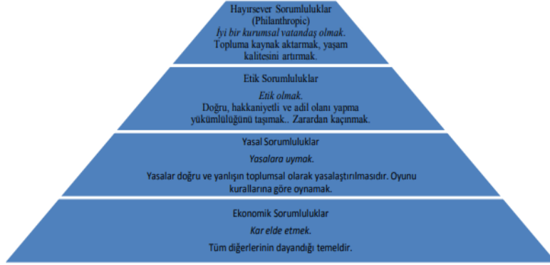
Şekil 1: Carroll'un Sosyal Sorumluluk Piramidi