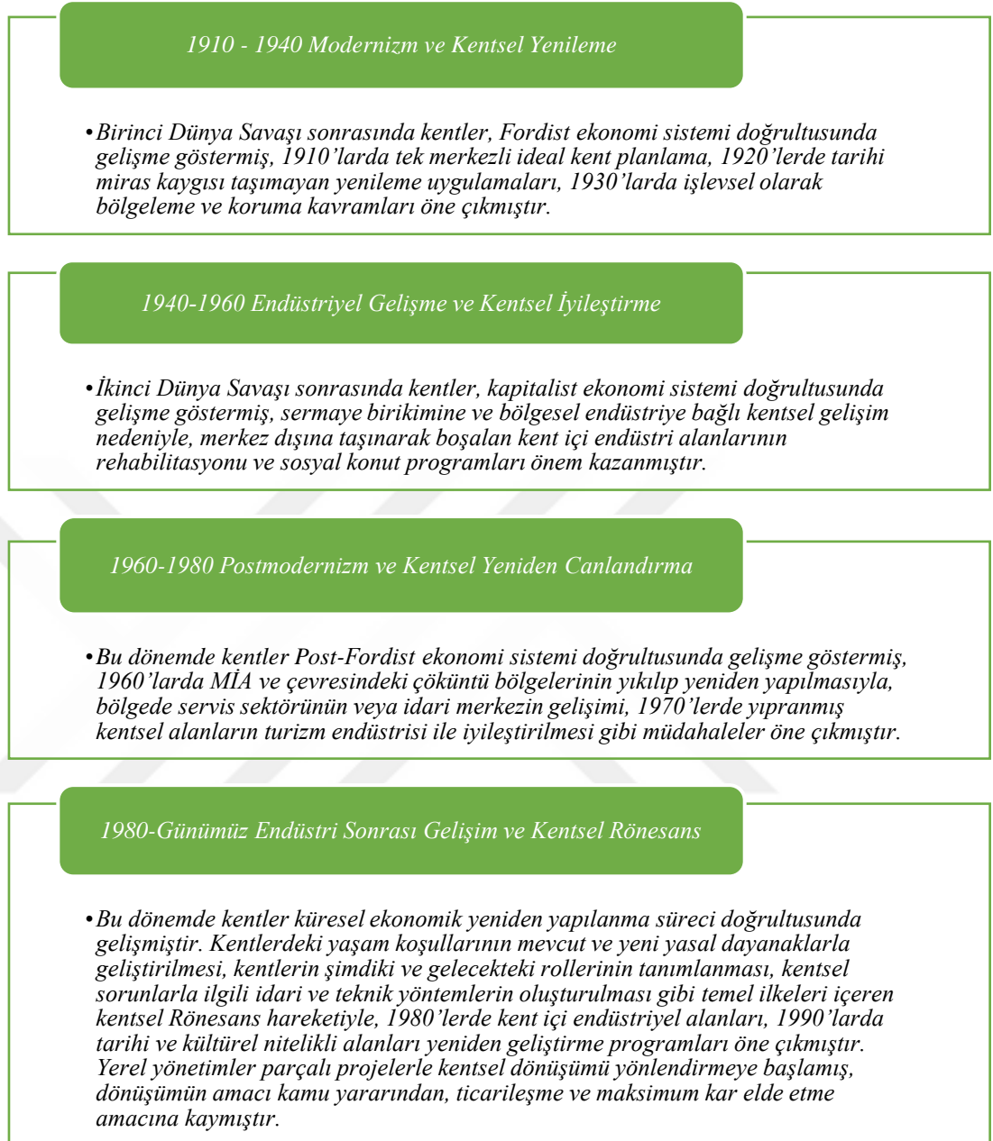
Şekil 2. Kentsel Dönüşümün Tarihsel Süreci