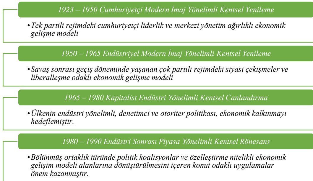
Şekil 3. Türkiye’deki Kentsel Dönüşümün Tarihsel Süreci

Türkiye’de kentsel dönüşüm uygulamalarının gelişimi incelenecek olursa, kentleşme sürecindeki planlama sistemine yönelik yaklaşımlar dört dönem altında değerlendirilebilir. Şekil 3’te Türkiye’de kentsel dönüşüm sürecinin tarihsel süreci açıklanmaktadır (Gürler, 2004: 139).