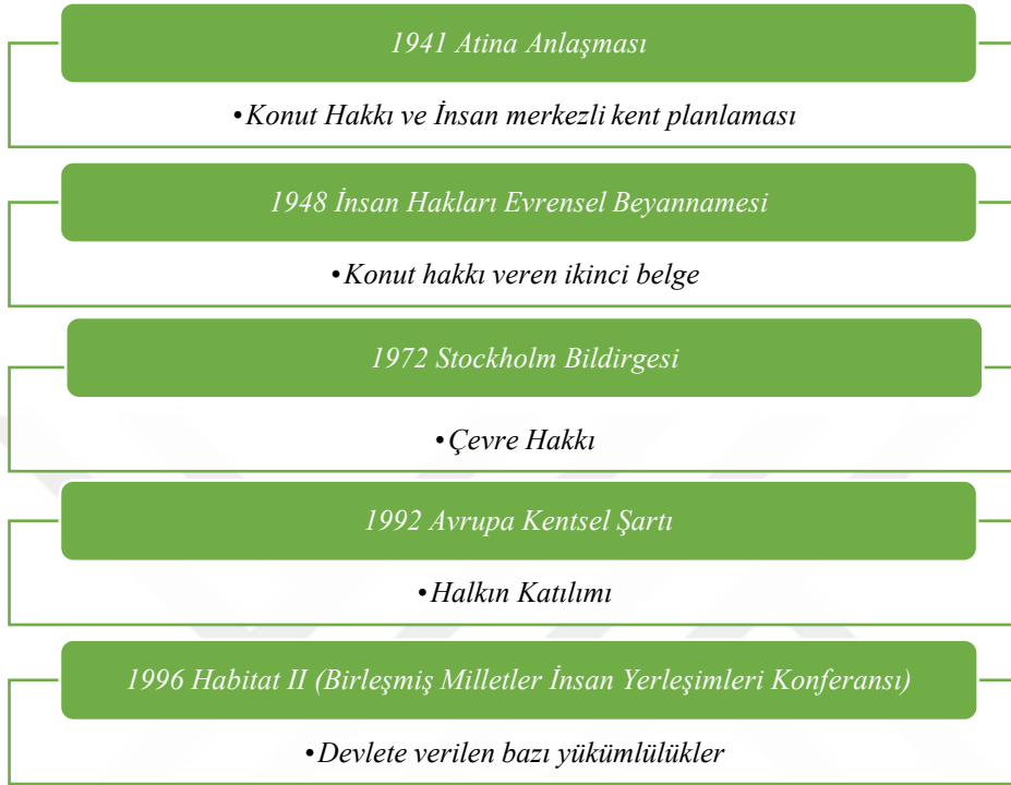
Şekil 6. Kentsel Dönüşüm Kapsamında Uluslararası Anlaşmalar

Kaynak: (Akkoyunlu, 1997: 32; Demirkol ve Baş, 2013: 28; Kaboğlu, 1994: 286-287; Balkır, 2012: 352; Çoban, 2012: 77).