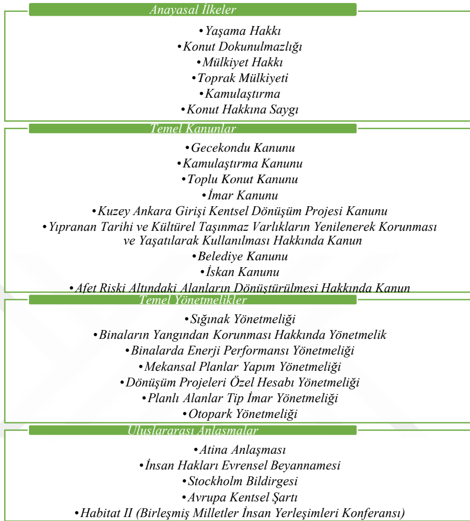
Şekil 4. Kentsel Dönüşümün Hukuki Altyapısı 8