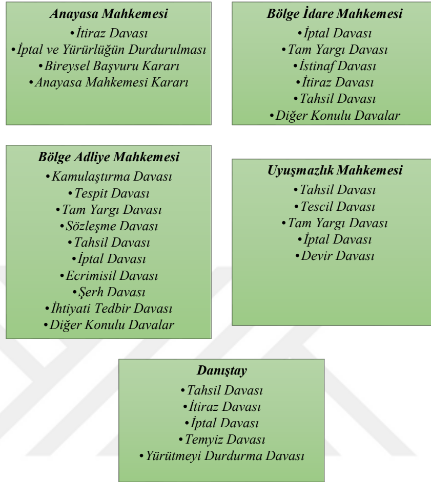
Şekil 7. Mahkemelere Göre Kentsel Dönüşüm Dava Konuları

Şekil 7’de belirtildiği gibi, Uyuşmazlık Mahkemesinde yer alan dava konuları şu şekildedir: