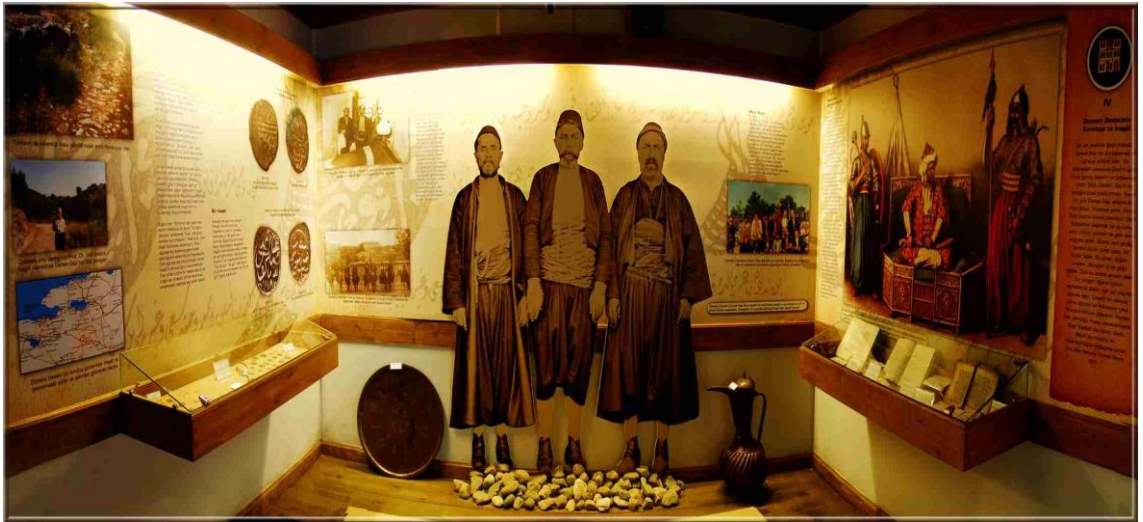
Şekil 2.6. İnegöl Kent Müzesi-Osmanlı Devleti'nin Kuruluş ve İnegöl'ün Fethi