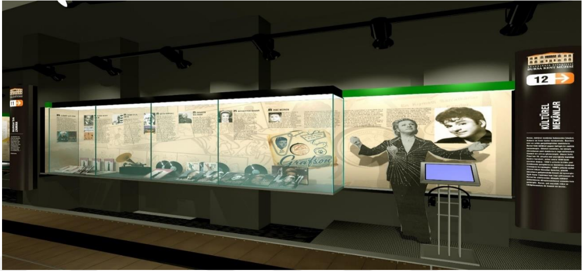
Şekil 2.7. Bursa Kent Müzesi-Bursa'da Zaman