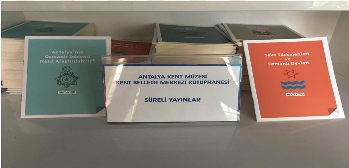
Şekil 3.8. Antalya Kent Müzesi Kent Belleği Merkezi Kütüphanesi Süreli Yayınlar