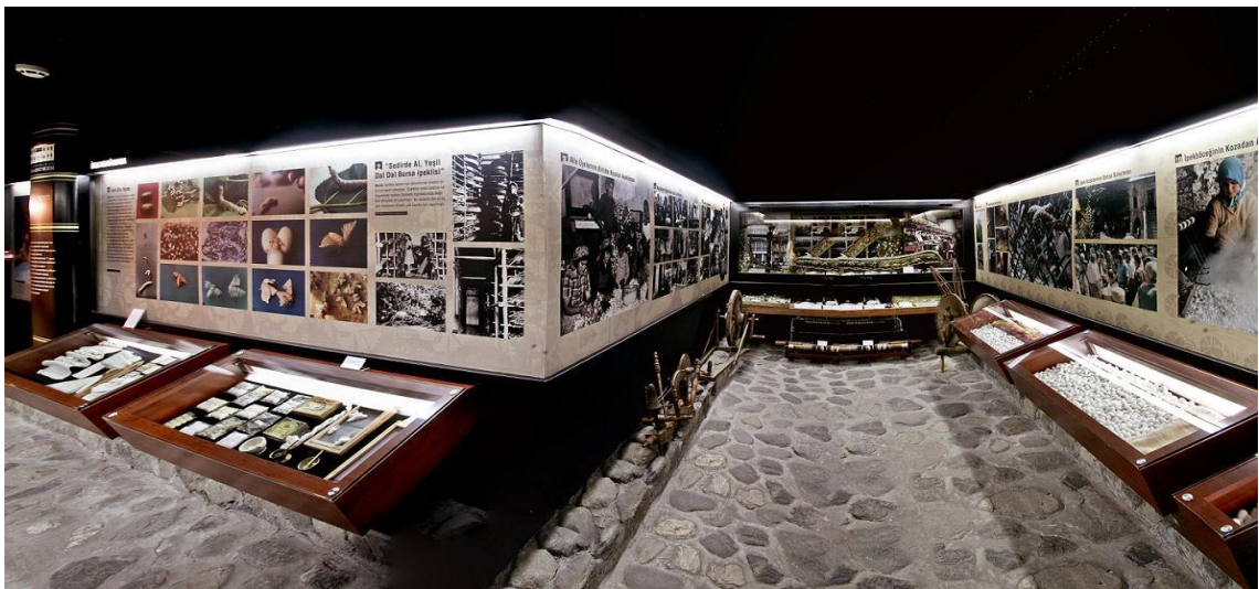
Şekil 2.8. Bursa Kent Müzesi- İpek Kenti Bursa