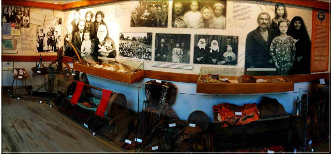
Şekil 2.5. İnegöl Kent Müzesi-Göçler ve Göçmenler

Kaynak: http://www.inegolkentmuzesi.gov.tr/tr/Medya/ (E.t. 10.03.2019).