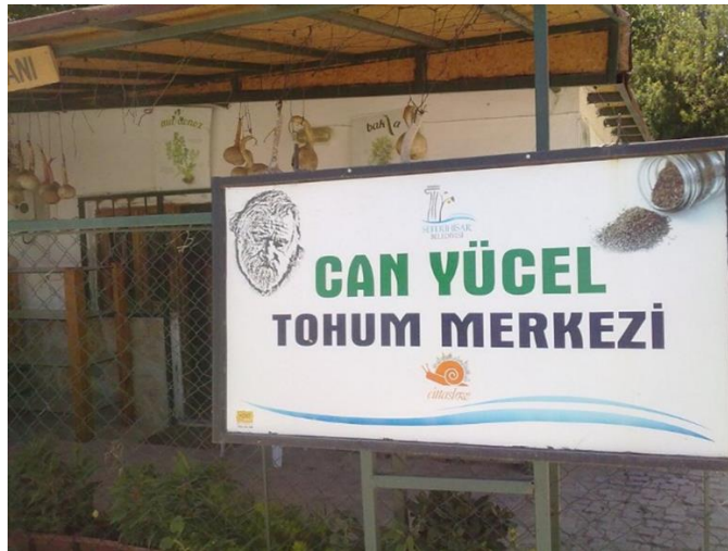
Şekil 4: Can Yücel Tohum Merkezi