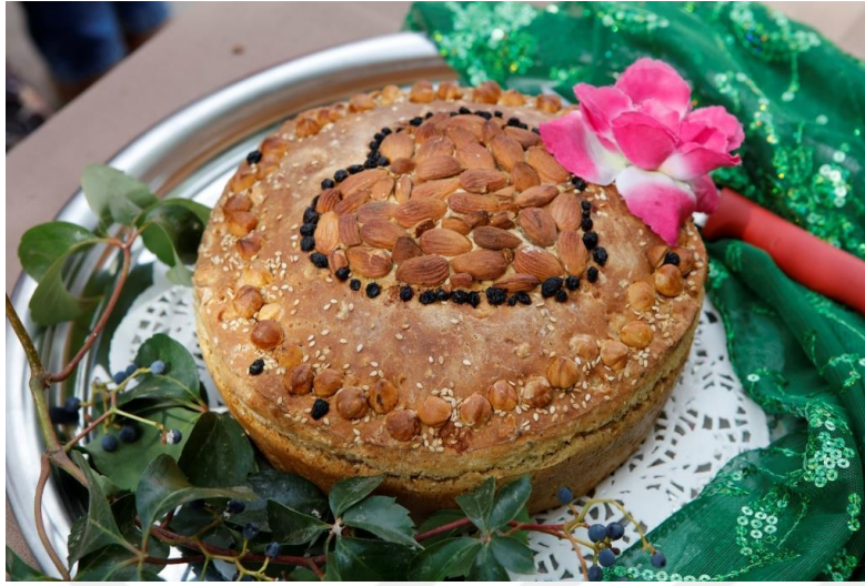
Şekil 8: Germiyan Ekmeđi