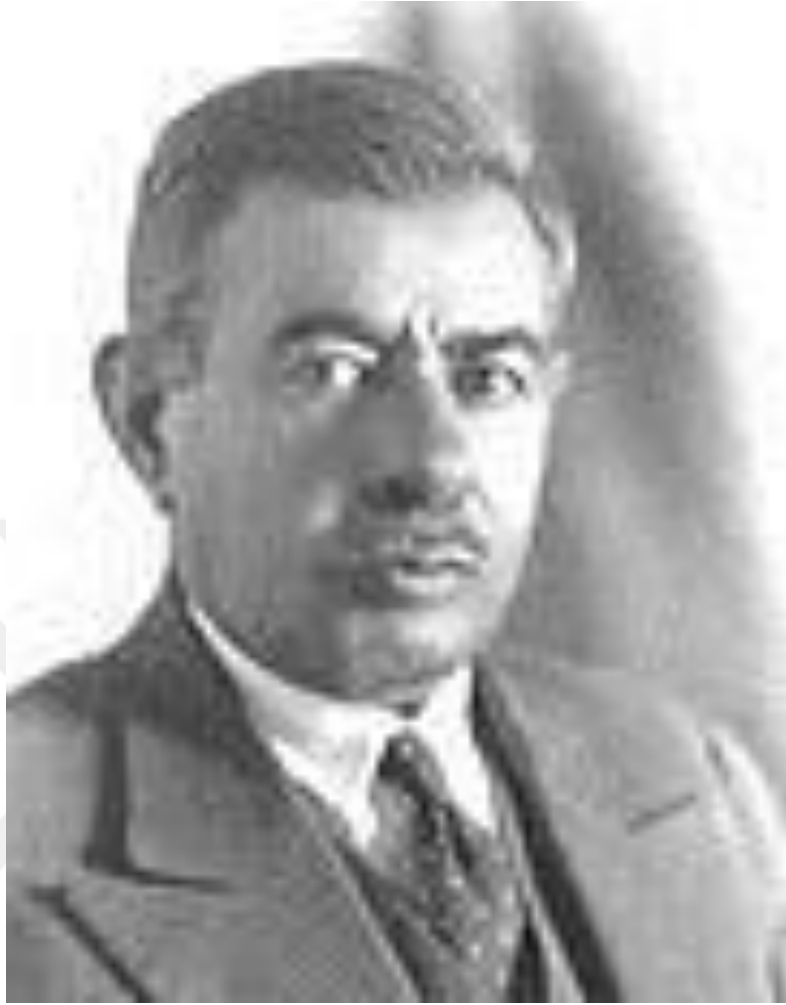
Hüseyin GÖKÇELİK (1876 – 1933)