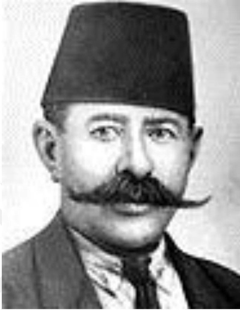
Hüseyin GÖKÇELİK (1876 – 1933)