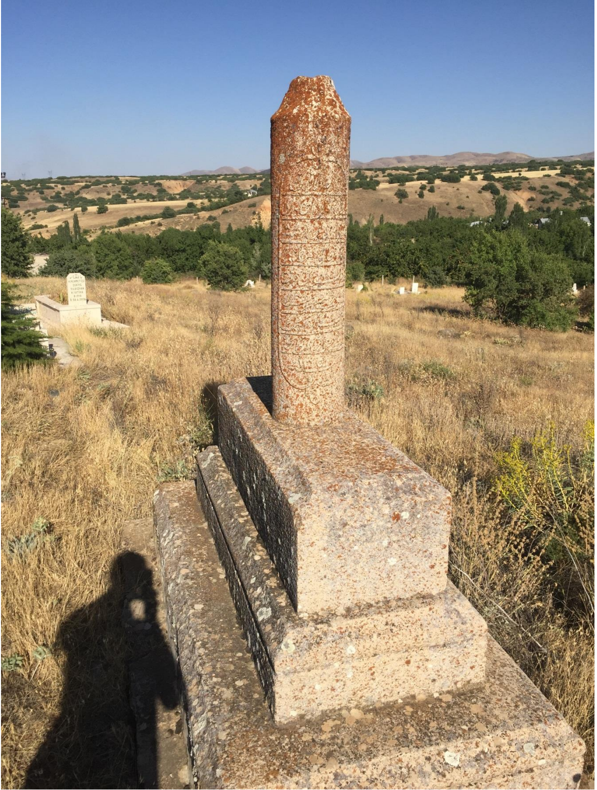
Hüseyin GÖKÇELİK'İN BÖLÜKLÜ KÖYÜNDEKİ MEZARI