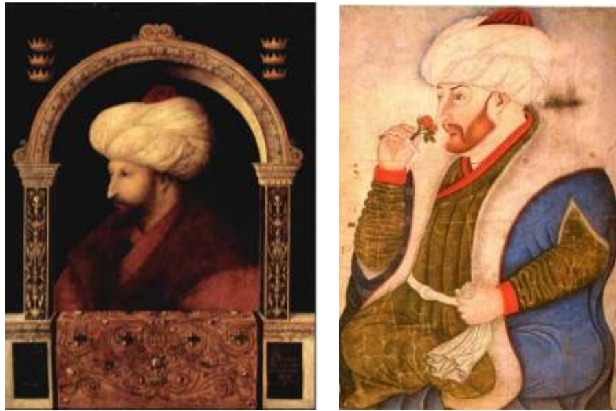
Resim 1. Gentile Bellini, “ Fatih Portresi” ve “ Fatih’in Gül Koklayan Portresi”

İleri bir resim sanatının geliştiği Fatih Sultan Mehmed döneminden sonra iki yüzyıl Türkler batı ile ilgilenmemişlerdir. Ayrıca bu dönem Osmanlı İmparatorluğunun politik, ekonomik ve kültürel bakımdan altın çağıdır. Bu dönemde Türk sanatının Batı sanatı üzerinde etkili olduğunu görüyoruz. Bunun en erken örneklerine 15. yüzyılda Avrupalı ressamın tablolarını da rastlıyoruz. Daha 14. yüzyılın ortalarında tablolarda ilk hayvan veya kuş figürlü halıların kullanılmaya başlandığı, 15. yüzyıl sonlarına doğru hayvan figürlerinin yerini geometrik desenli halıların almış olduğunu görüyoruz. Bunlar 1451'den sonra önce İtalyan, sonra Flemenk ve Hollanda tablolarında 16. yüzyıl başlarına dek tasvir edilmiştir (Ersoy, 1997, 50).