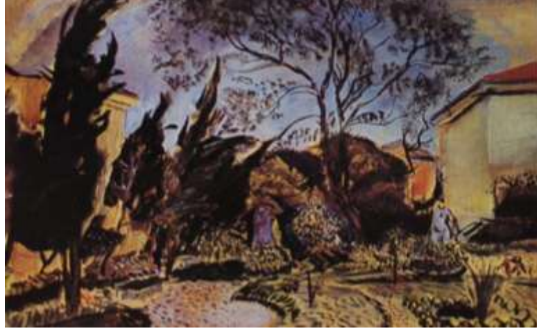
Resim 5. Bedri Rahmi Eyübođlu “Akademi bahçesi”

bilinmektedir (İnce, 1997, 33). (bkz. Resim 5, http://turkresmi.com/klasorler/yeniler/liman/index.htm , (2011))