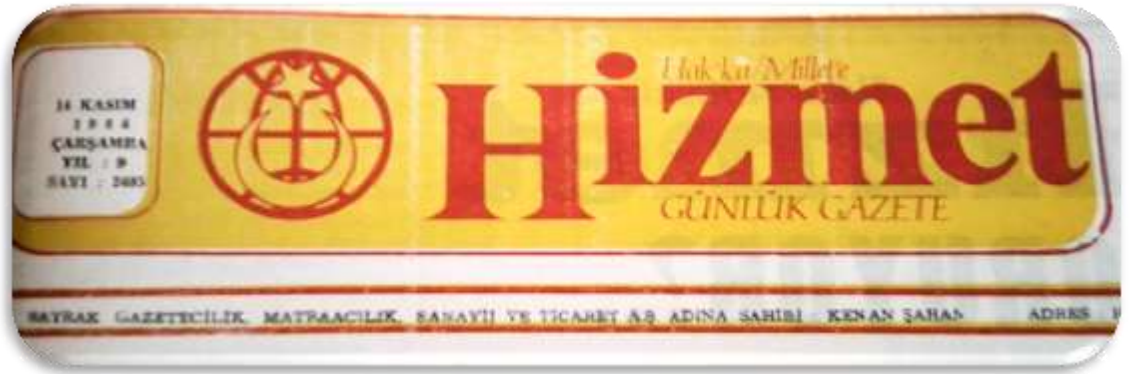
Resim 19. Hizmet Gazetesi 14 Kasım 1984 Tarihli Haberi