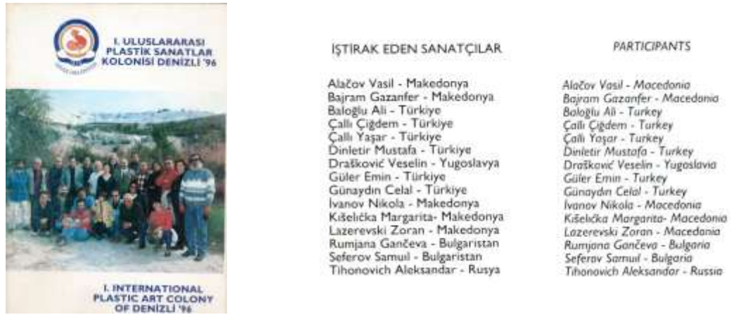
Resim 8. I. Uluslararası Plastik Sanatlar Kolonisi Kataloğu ve Çalışma Örnekleri -1998