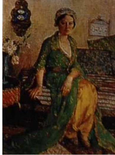
Resim 4. İbrahim Çallı “ Yeşil Elbiseli Kadın ”

Türk Resim Sanatı içinde önemli bir yer tutan “1914 Kuşağı” ya da “Çallı Kuşağı” adıyla anılan ressamlar arasında yer alan Hüseyin Avni Lifij, 1886 yılında doğmuştur. İstanbul'da devam eden tahsil hayatı ressam ve müzeci Osman Hamdi Bey'le tanışıp, daha sonra Halife Abdülmecit efendiye takdim edilip burslu olarak Fransa'ya gitmesiyle sonuçlandı. 1909-1912 yılları arasında Cormon atölyesinde çalışmalarına devam etti. İstanbul'a dönüşünde çeşitli okullarda öğretmenlik yaptı. 1927 yılında da vefat etmiştir. Lifij, 1914 kuşağının bir sanatçısı olarak Fransa'da almış olduğu eğitimi kendi sanat anlayışı ile senteze ulaştırarak kendine özgü sanatçı kimliği ile karşımıza çıkar. Genç yaşta ölmesine rağmen vermiş olduğu eserler Türk Resim Sanatı içinde çok önemli bir yer tutar. Eserleri arasında yağlıboya, karakalem, iki veya üç renk kalem, füzen (kömür kalem), pastel boya ile yapmış olduğu portre, peyzaj, kompozisyon