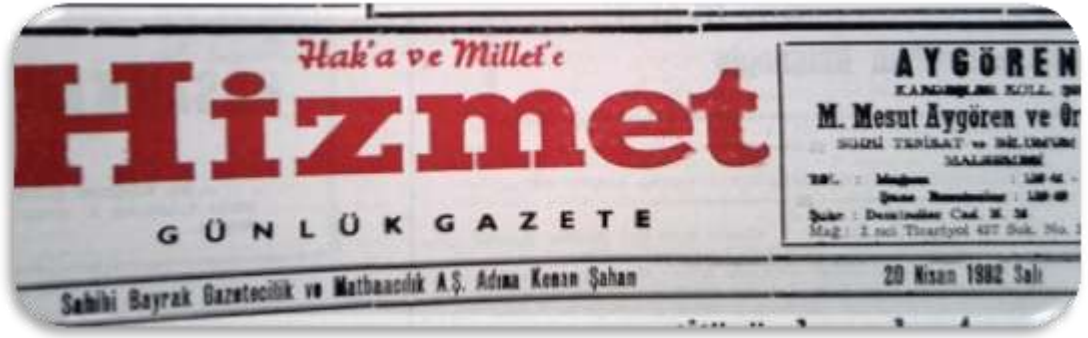
Resim 15. Hizmet Gazetesi 20 Nisan 1982 Tarihli Haberi