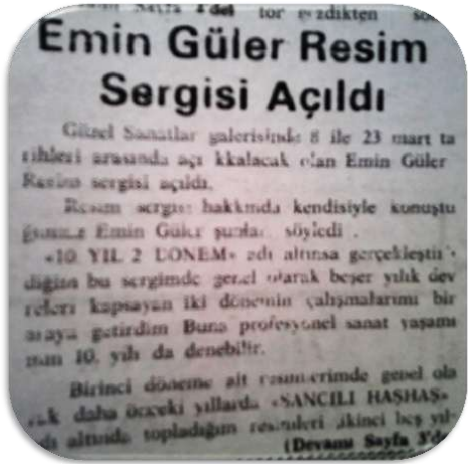
Resim 18. Hizmet Gazetesi 14 Kasım 1984 Tarihli Yayını