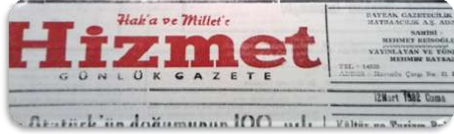
Resim 13. Hizmet Gazetesi 12 Mart 1982 tarihli Haberi