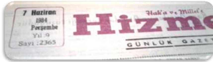
Resim 11. Hizmet Gazetesi 7 Haziran 1984 Tarihi Haberi