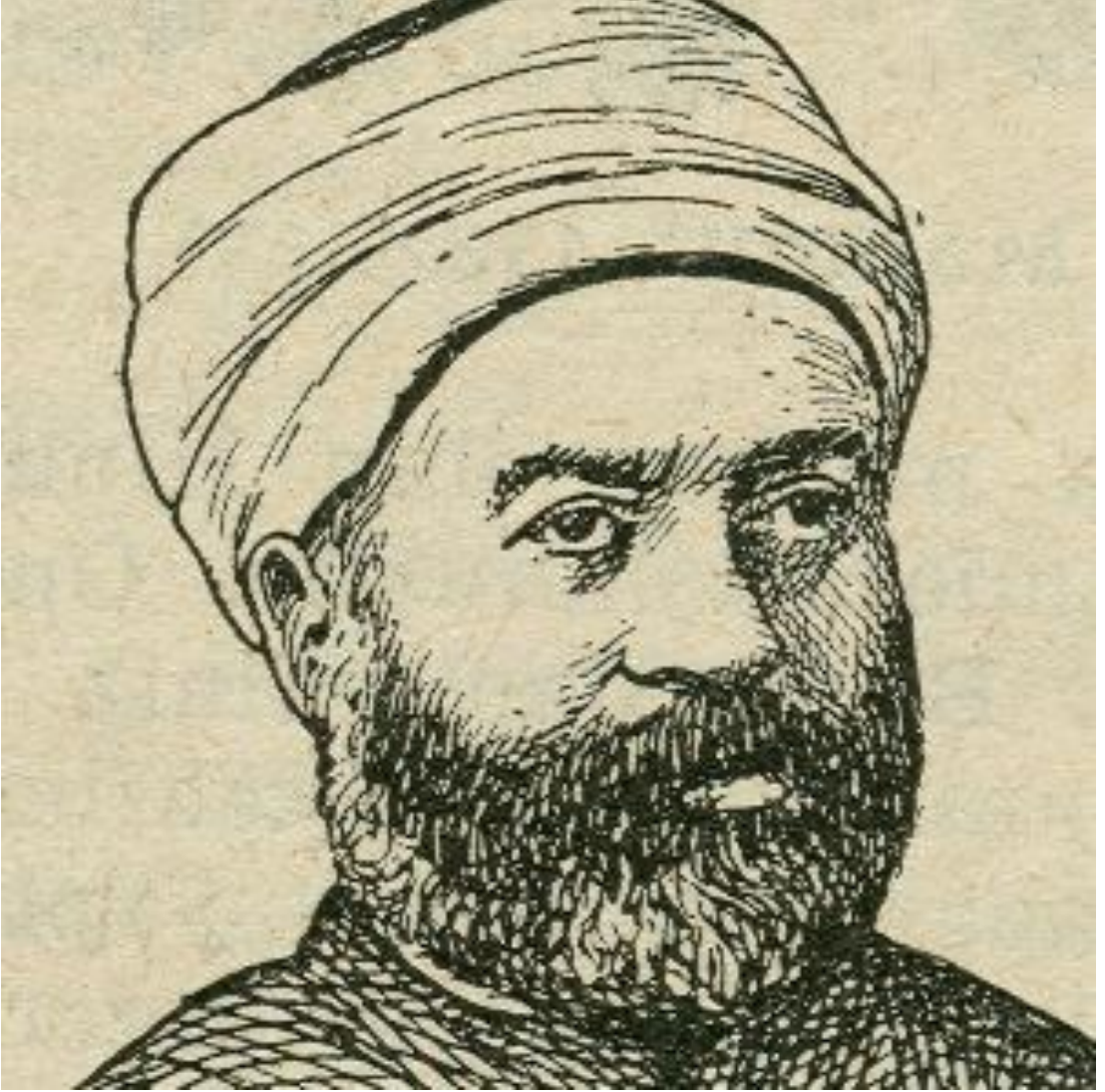
Resim 1: Mahmut Es'ad SEYDİŞEHRÎ.