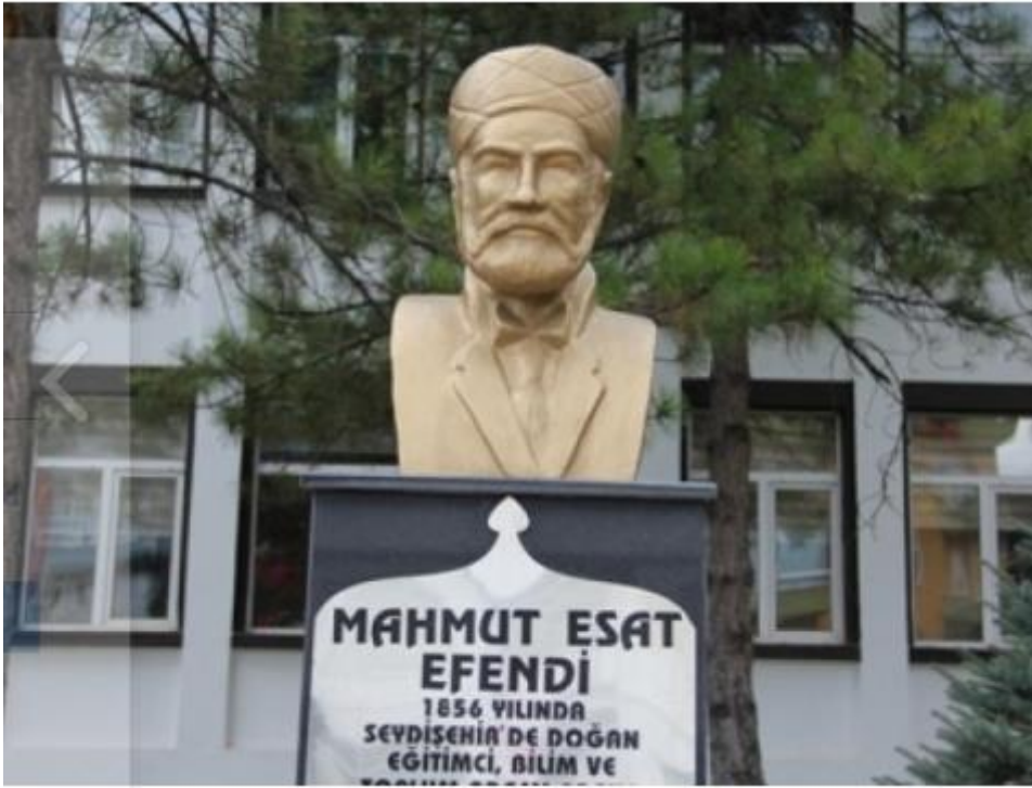
Resim 2: Mahmut Es'ad SEYDİŞEHRİ'nin büstü.

Böylece kadastro müessesesinin ilk tasavvuru Mahmut Es'ad tarafından ortaya atılmıştır. Bu hizmetini hatırlatmak üzere, soyadı kanununun çıkmasından sonra ailesi “Kadaster” soyadını almıştır. 18 Ayrıca Tapu Kadastro mensupları tarafından kurulan bir dernek, Mahmud Es'ad'ın bir büstünü (Resim-2), Tapu Kadastro Genel Müdürlüğü merkez binâsına bir tüzükle yerleştirmiştir. 19