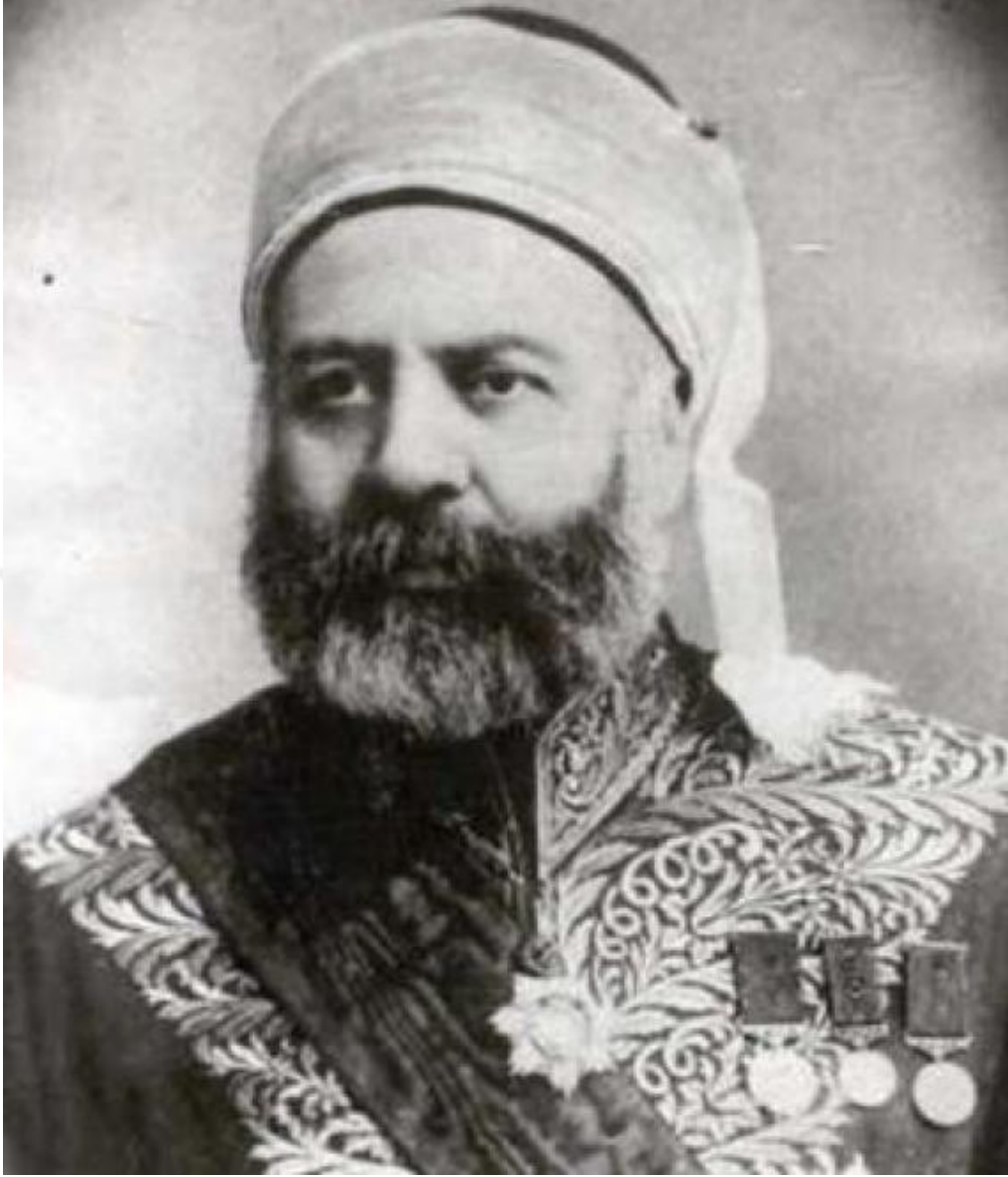
Resim 3: Mahmut Es'ad SEYDİŞEHRÎ, İlmî kıyafeti ile.

Hasan Basri Erk Mahmut Es'ad Seydişehirî'nin hocalığını ve fedakarlığını şu şekilde vurgulamıştır: “ Mahmut Es'ad Efendi ömrünü memleketin ilim ve irfanına vakfetmiş, birkaç vazifeyi birden uhdesine toplamak suretiyle memlekete hayırlı olmaya çalışmış, binlerce talebe yetiştirmiş, birkaç neslin hocalığını yapmıştır. ” 36