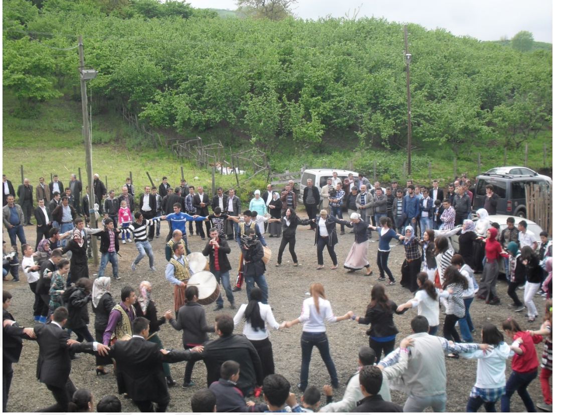
Düğünden bir kare(2013)