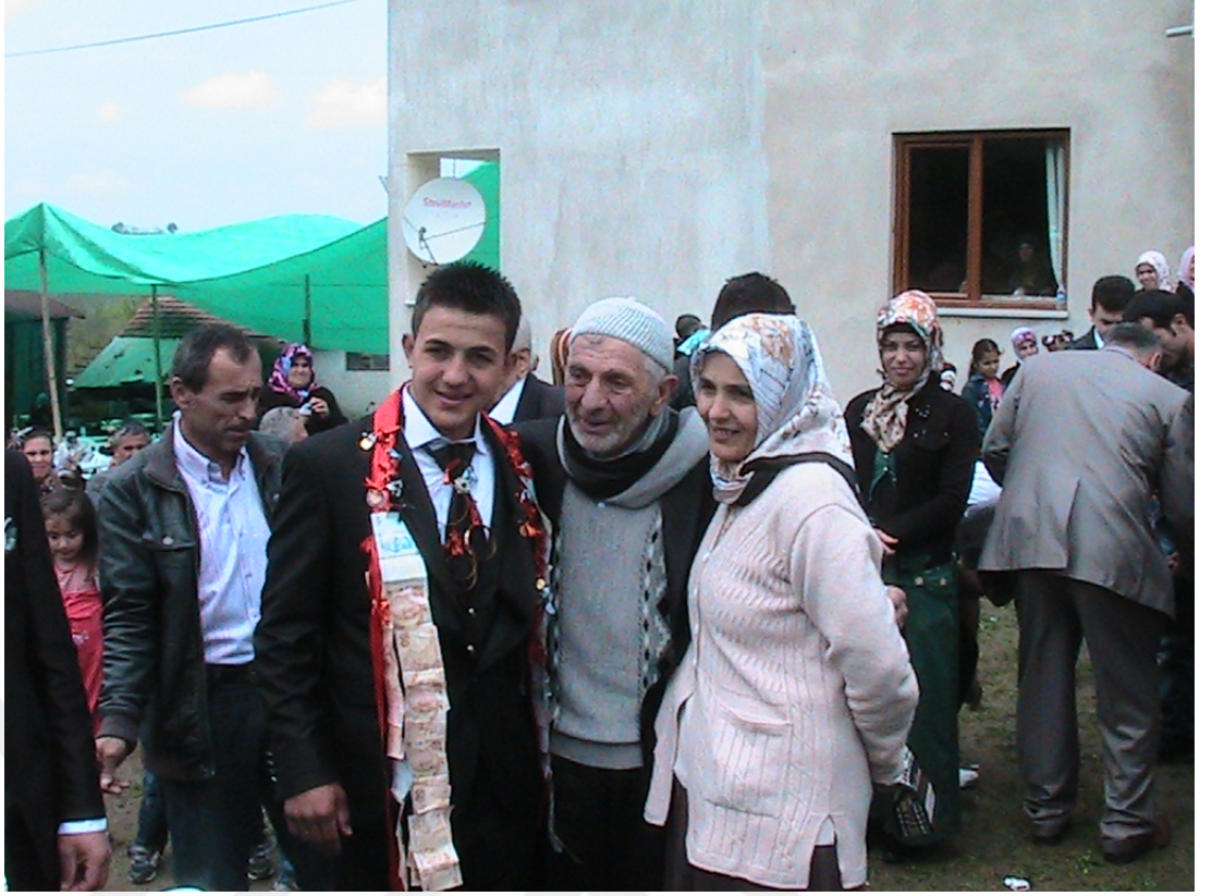
Damat bahşışı (2013)