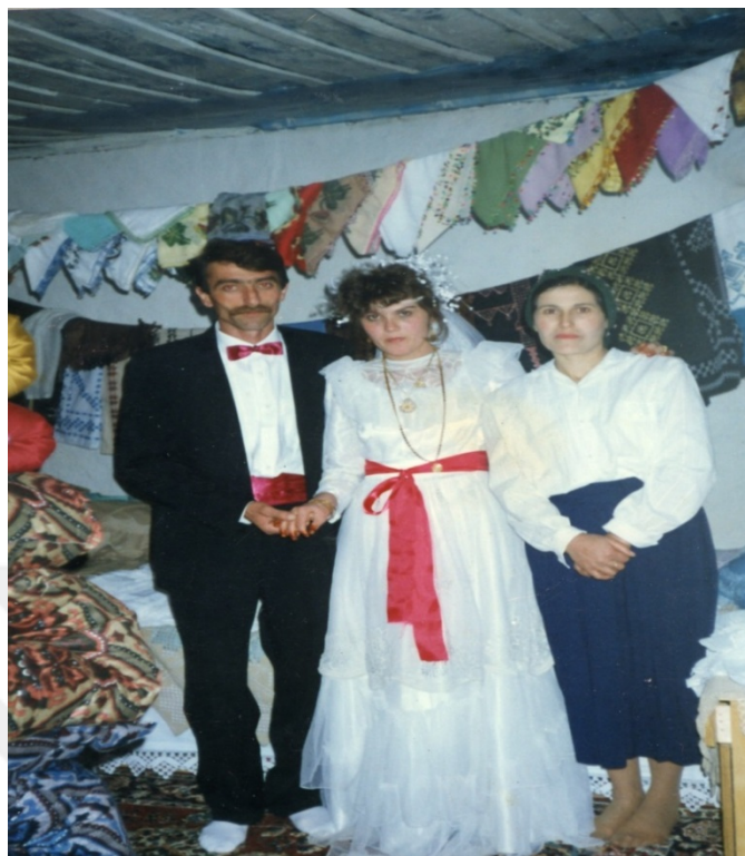
Ek 17: Duvak (1990)