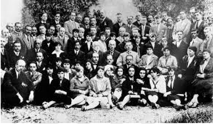
Resim 3. Dârul Elhân Öğretmen ve Öğrencileri ile birlikte çekilmiş fotoğrafı 39

1 yıl sonra Osmanlı'nın 1. dünya savaşından mağlup ayrılması, İstanbul'un işgali, İstiklâl savaşı, mütâreke yıllarının meşakkatli geçmesi gibi sebeplerle, erkekler bölümü 1918' de kapatılan, sekiz kişilik bir öğretim kadrosuyla kadınlar bölümü bir süre daha varlığını devam ettiren dârü'l-elhân, faaliyetlerine bir süre ara vermiştir. 38