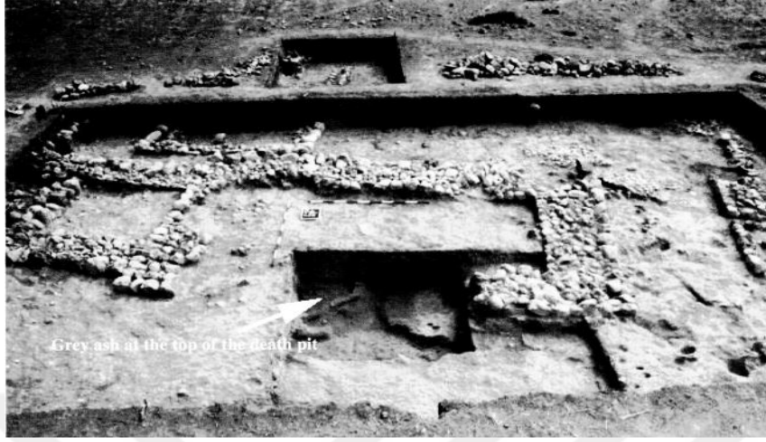
Şekil 18. Ölüm Çukuru (Death Pit) (Carter vd., 2003: 123)

kafatasında kafatasının özenli bir şekilde kesilmiş olması, muhtemelen beyni almak için olduğunu düşündürmektedir (Kansa, Campbell 2002: 8).