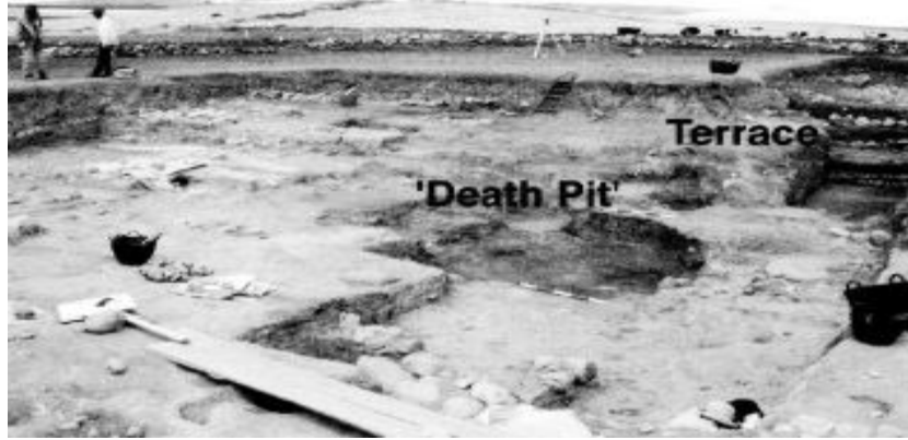
Şekil 19. Ölüm Çukuru (Death Pit) (Carter vd., 2003: 120)