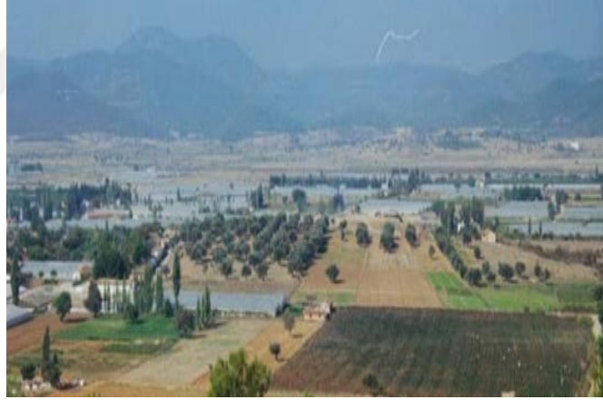
Şekil 15. Bakla Tepe'nin Görünümü (Tuğcu 2018: 227)

İzmir'in Menderes ilçesine bağlı Bulgurca köyünün kuzeyinde yer alan, prehistorik yerleşimlerden biridir. İzmir'in içme suyunu karşılamak amacıyla yapılması planlanan bir barajın kurtarma kazısı projesiyle kazı çalışması yapılmıştır (Şekil 15). Başkanlığını Hayat Erkanal'ın yaptığı Bakla Tepe kazısı 1994'te başlamıştır. Bakla Tepe ismi, tarım ürünleri arasında çoğunlukla bakla tarımı yapıldığı için yöre halkı tarafından verilmiştir. Çalışmalar neticesinde Kalkolitik Dönemden Roma Dönemi'ne kadar bir tabakalanmanın olduğu saptanmış ve bu farklı dönemlerin malzemeleri bir arada bulunmuştur (Erkanal, Özkan 1997: 262).