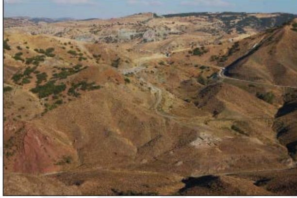
řekil 1. amlıbel Tarlasının Grnm ( Irvine vd., 2014: 20)

orum'un Boğazkale kasabası yakınlarında, deniz seviyesinden yüksekliđi 1000 metre olan Kalkolitik Dnem yerleřimlerinden biridir (Schoop 2008: 150; Schoop 2011: 54) (řekil 1).