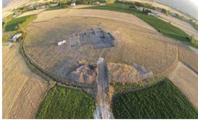
Şekil 3. Tepecik Çiftlik Yerleşim Alanı (Büyükkarakaya 2014: 384)

Niğde'nin Çiftlik ilçesi sınırında Orta Anadolu'nun güneyinde, çevreye kapalı bir ovanın içerisinde, ilçe merkezine 1 km uzaklıkta yer almaktadır. Tepecik Höyüğü Kapadokya Volkanik Bölgesi olarak adlandırılan yerde bulunmaktadır (Bıçakçı vd., 2007: 237; Faydalı, Bıçakçı 2002: 29; Bıçakçı 2001: 26)(Şekil 3).