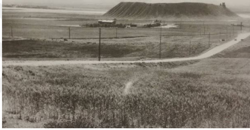
Şekil 5. Samsat Hüyükün Batıdan Görünüşü (Özgüç 2009)

Samsat'ta Geç Kalkolitik Döneme ait birçok tabakalanmanın olduğu saptanmıştır. Bu tabakalanmalardan XXV. kat mezarlığında yapı tabanı altına bırakılmış, çömlek içinde gömülü bir çocuk bulunmuştur. Çömleğe yerleştirilen çocuğun başı güneye dönük, cenin (hocker) pozisyonundadır (Şekil 6). Çocuk mezarının yanında bir bebeğe ait olan başka bir mezar daha bulunmuştur ve bebeğin korunma durumu kötü haldedir (Özgüç 2009: 96) (Şekil 7).