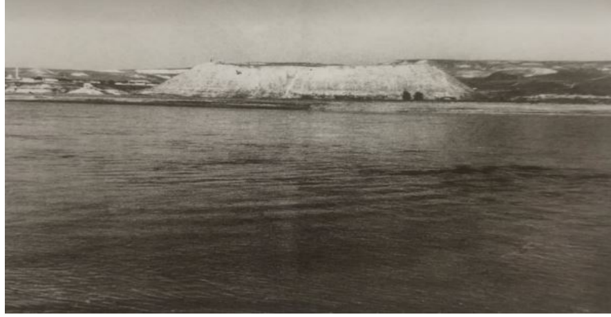
Şekil 4. Samsat Hüyükün Doğudan Görünüşü (Özgüç 2009)