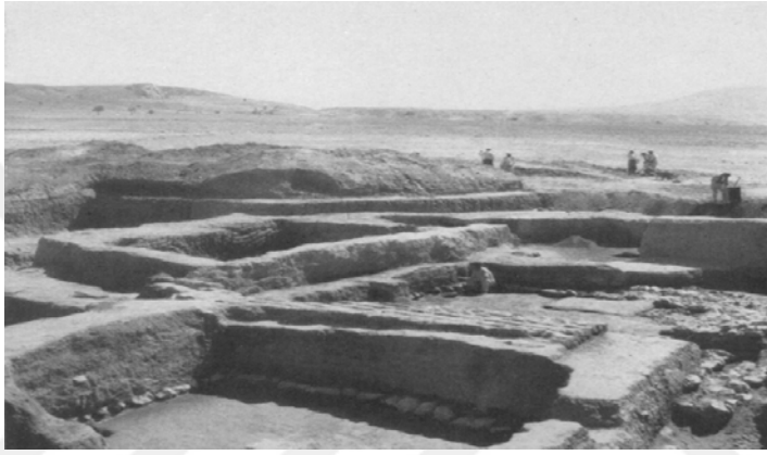
Şekil 16. Hacılar Höyük Yerleşim Yeri (Mellaart 1959: 57)

Hacılar Höyük, Burdur'un 2 km güneydoğusunda yer alan Hacılar köyü sınırlarında bulunmaktadır. M.Ö. 5600–5400 Geç Neolitik ve M.Ö. 5400–4750 Erken Kalkolitik Döneme tarihlendirilen höyük Batı Anadolu'nun en eski yerleşim yeri olma özelliğine sahiptir (Mellaart 1970: 92) (Şekil 16).