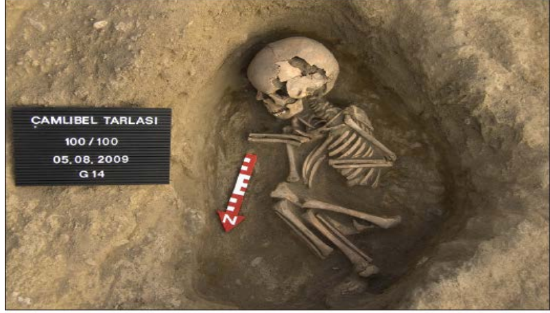
Şekil 2. Çamlıbel Tarlasında Bulunan Bebek İskeleti ( Irvine vd., 2014: 20)