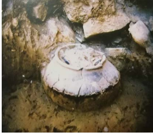
Şekil 6. XXV. Kattan Çıkarılan Çömlek Mezar (Özgüç 2009)