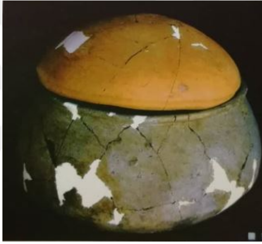
Şekil 7. XXV. Kat Bebek Çömlek Mezar (Özgüç 2009)

XXVI. yapı katının altında rastlanan mezarlardan bebek ve çocuklara ait 12 tane gömüt açığa çıkarılmıştır. Bu mezarlardan üç tanesi basit toprak, bir tanesi küp, sekiz tanesi de çömlek mezar tipindedir (Özgüç 2009: 99). Mezarlarda ölü eşyası olarak hammaddesi kireç ve mika olan vazocuklar bulunmuştur (Şekil 8). Bu katmanda çömlek içerisinde 3-4 yaşlarında bir çocuğa ait iskelet bulunmuş ve korunma durumunun iyi olduğu saptanmıştır. Mezar içerisinde kol bileğine ait olan kırmızı obsidyenden yapılmış, taş ve kireçtaşı boncuklu bilezik kalıntıları bulunmuştur. Mezarlarda 10 ve 11 no'lu mezarlar dışında ölü eşyasına rastlanmamıştır (Şekil 9). 11 no'lu mezar çömlek mezarların içerisinde en büyük olanıdır (Özgüç 2009: 99) (Şekil 10).