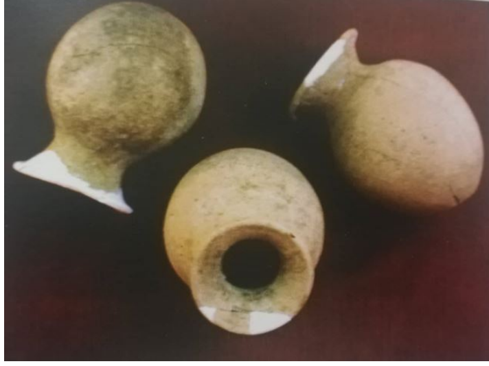
Şekil 8. XXVI. Kat Vazocukları (Özgüç 2009)