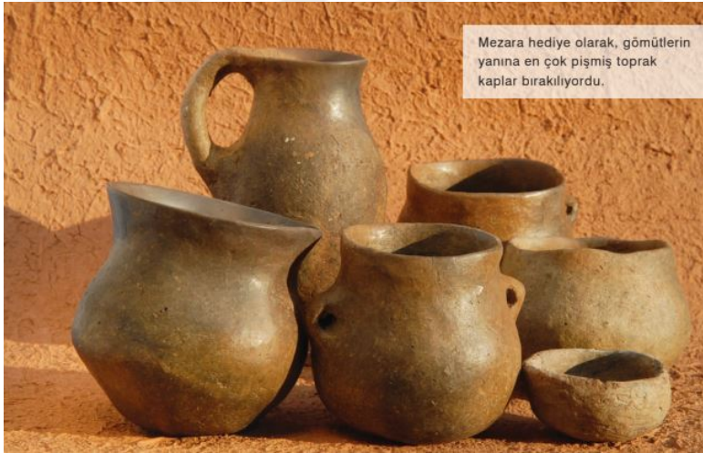
Şekil 12. Aktopraklık'ta Mezar Hediyesi Olarak Konan Pişmiş Topraktan Kaplar (Alpaslan Roodenberg 2012: 47)