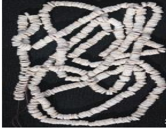
Şekil 13. Aktopraklık' ta Kalkerden Yapılmış Boncuk Kolye (Alpaslan Roodenberg 2012: 49)