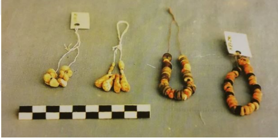
Şekil 9. XXVI. Kat 10-11 no' lu Mezarlardan Çıkan Kolye ve Bilezikler (Özgüç 2009)