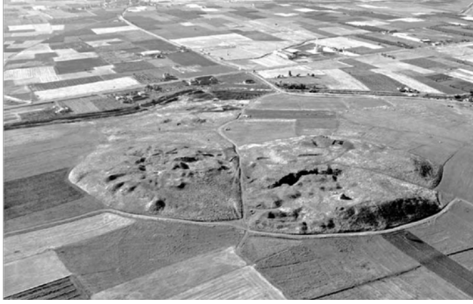
Şekil 14. Beycesultan Höyüğü'nün Görünümü (Abay, Dedeoğlu 2009: 65)

Yerleşim yerinde mezarlar nadir bulunmuştur. Bulunan iki mezardan XXIX. tabakadaki basit toprak mezardır, diğerinde büyük bir çömlek içerisinde dört çocuğa ait iskeletler bulunmuştur. Yetişkinler için yerleşim dışında mezarlık alanı oluşturulduğu düşünülmektedir. Mezar eşyasına rastlanmamıştır (Mellaart vd., 1958: 38).