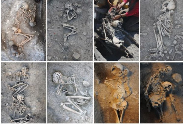
Şekil 11. Aktopraklık'ta Cenin (Hocker) Pozisyonunda Olan Mezarlar ( Alpaslan Roodenberg 2012: 50)

dikkat çekmekte ve ölülerin kolyeleri ile birlikte gömüldüğüne işaret etmektedir (Alpaslan Roodenberg 2012: 48) (Şekil 13).