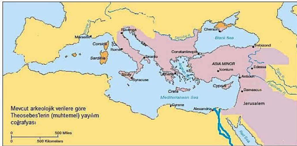
Şekil 2. Mevcut Arkeolojik Verilere Göre Theosebes'lerin (Muhtemel) Yayılım Coğrafyası.

God-Fearerslerin yaşadıkları coğrafyaya ait kesin bilgi yoktur. Fakat arkeolojik buluntular, çeşitli metinler ve filolojik bilgiler ışığında kesin olmamakla birlikte bir sınır çizilebilir. Bu sınıra göre Batıda İtalya'dan başlayarak Yunanistan, Balkanlar, Kıbrıs, Anadolu ve Filistin'e kadar bulunan coğrafya içinde yaşadıkları düşünülmektedir. Özellikle eldeki verilere göre çoğunlukla Anadolu'da yaşadıkları görülmektedir. 226 God-Fearerslerin yaşadıkları bölgelere dair tahmini olarak oluşturulmuş harita aşağıda verilmiştir;