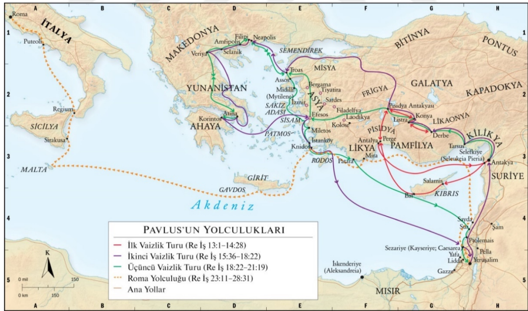
Şekil 4. Pavlus'un Misyon Yolculukları Haritası