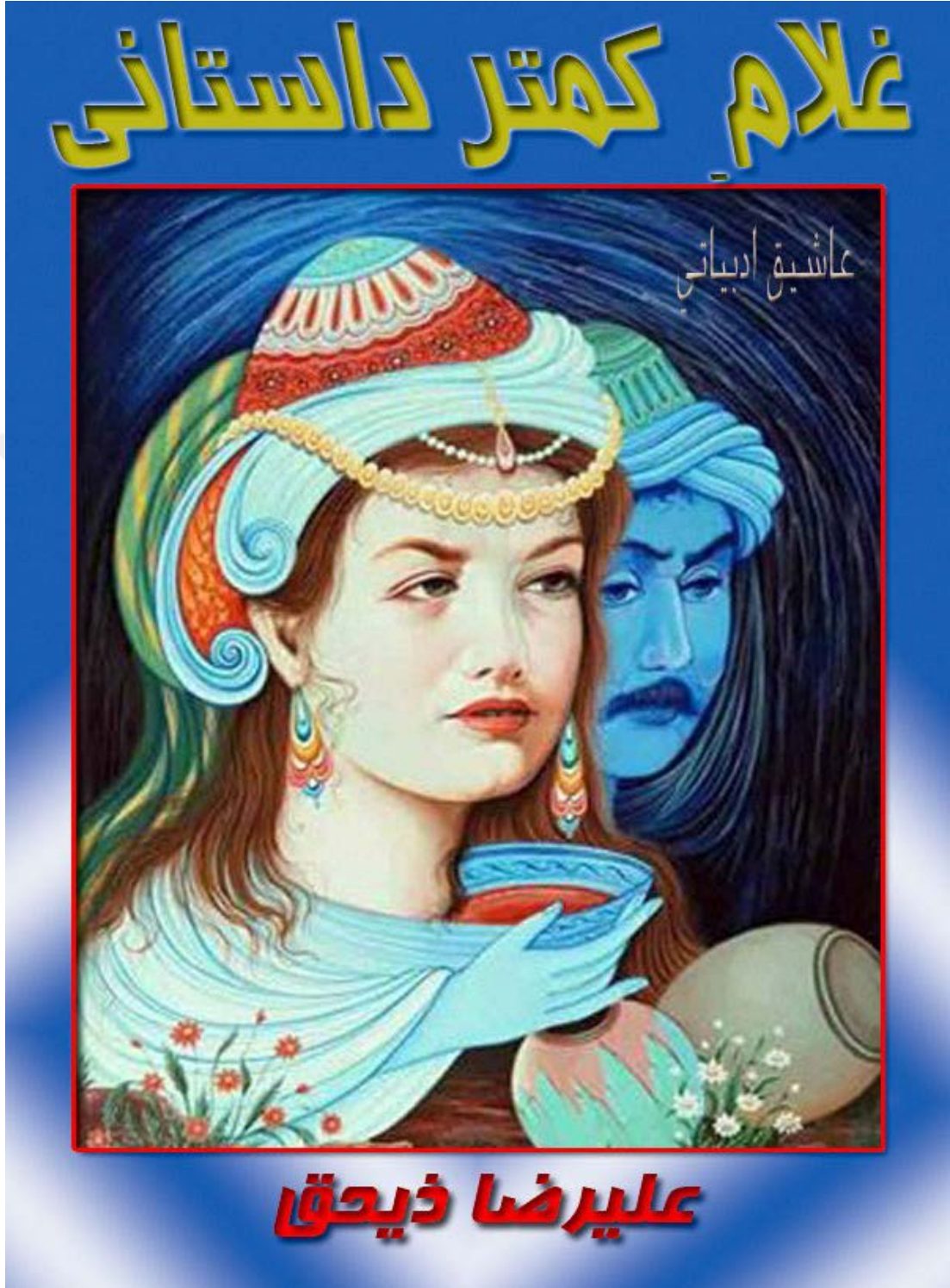
Ek: 3. Gulami Kemter Destanı Kapak Fotoğrafi