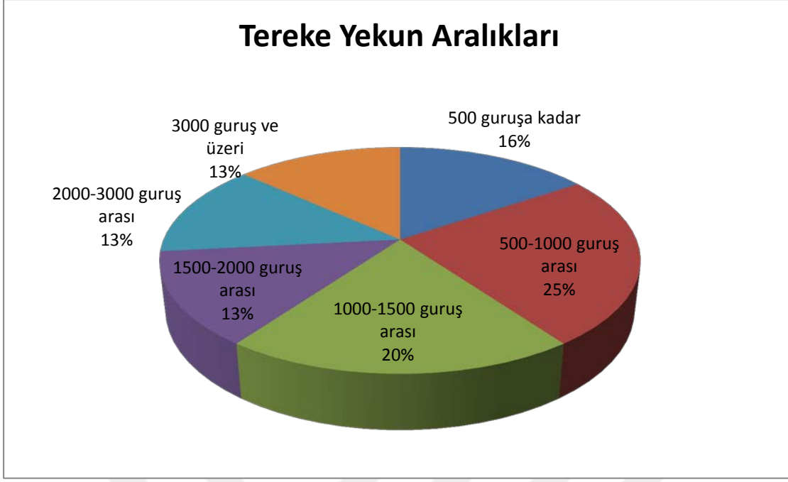
Şekil 2. 89 Numaralı SŞS Kayıtlarında Tespit Edilen Terke Yekünlerinin Oransal Dağılımı