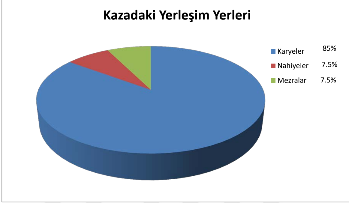
Şekil 1. 89.Numaralı SŞS Kayıtlarında Tespit Edilen Yerleşim Yerlerinin Oranları