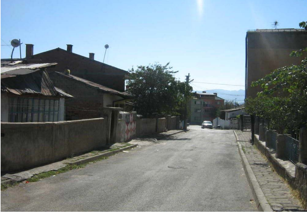
Resim 4. Esentepe Mahallesi 4

Görüldüğü üzere bu bölgenin kentsel dönüşüme oldukça ihtiyacı vardır. Yapılacak olan çalışmalarla hem sosyalleşme açısından hem de risk açısından önemli adımlar atılacaktır.