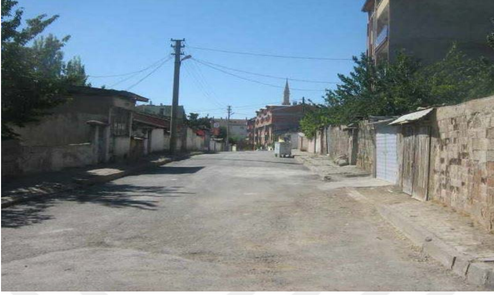
Resim 3. Esentepe Mahallesi 3