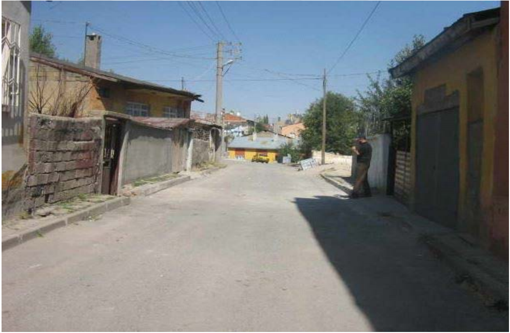
Resim 2. Esentepe Mahallesi