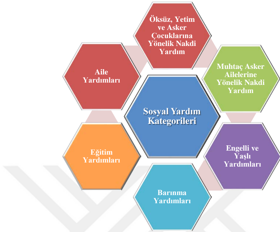
Şekil 2. Sivas'ta Uygulanan Sosyal Yardım Kategorileri