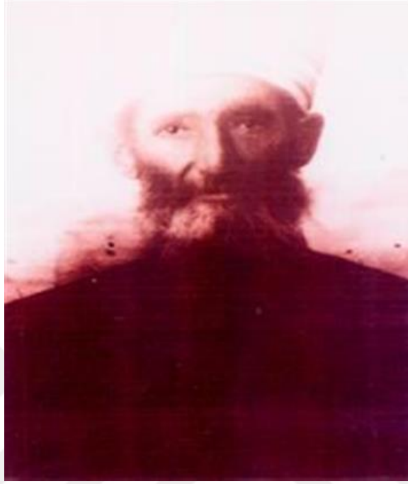
* Sivas Müftüsü Abdurrauf Efendi