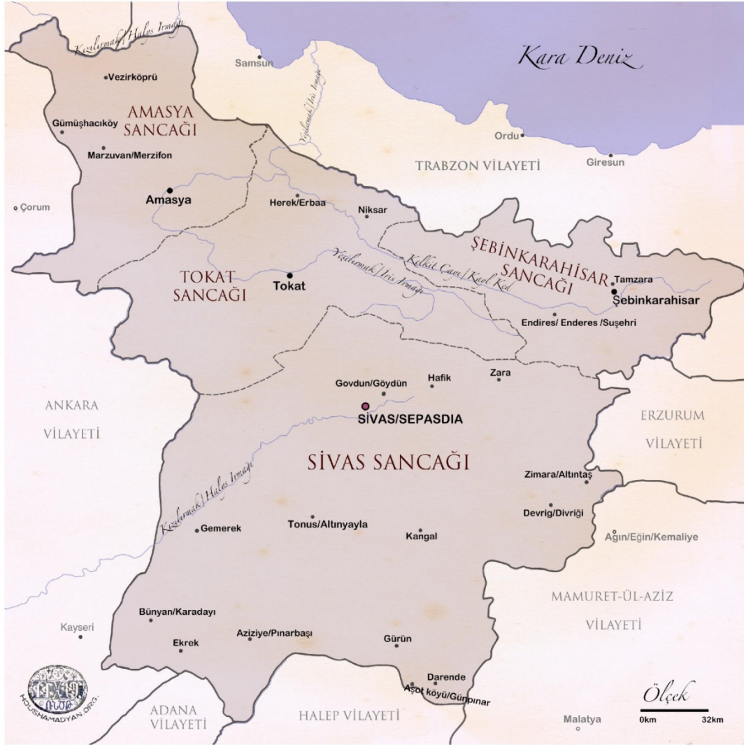
Tablo: 19 1903 Yılı Sivas Haritası