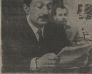
Maliye Bakanı Adnan Menderes

Ankara 21. — Başbakan Menderes Meclis'te 1949 bütçesini görüşmeğe başladı. Başbakan Menderes, Meclis'te 1949 bütçesini görüşmeğe başladı. Başbakan Menderes, Meclis'te 1949 bütçesini görüşmeğe başladı.