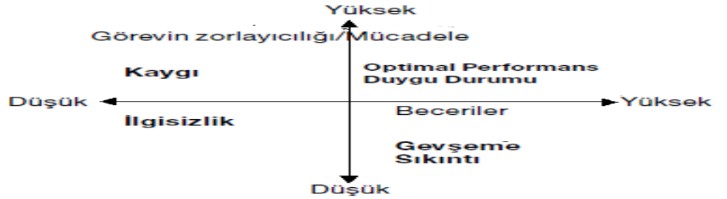
Şekil 2.2. Jackson ve Csikszentmihalyi'nin optimal performans duygu durumu modeli (Jackson ve Eklund 2004). Flow Scales Manual, Morgontown: Fitness Information Technology).

Yapılan görevin birey tarafından mücadele ve zorluklarla başa çıkabilecek düzeyde beceriye sahip olduğunu hissetmesi durumlarında var olan içsel haza optimal performans duygu durumu denmektedir (Moneta 2004). Verilen görevin zorluğu durumunda, optimal performans deneyimini yaşayan sporcu, performansın ve becerinin yüksek düzeyde olması halinde optimal performans duygu durum düzeyine ulaşmaktadır. Optimal performans duygu durumunun oluşumunu tam olarak anlayabilmek için Csikszentmihalyi'nin modelini incelemek gerekmektedir (Şekil 2.2). Modelde, optimal performans duygu durumu, görev zorluğunun ve bu mücadelenin yüksek düzeyde olduğu durumlarda, sporcu tarafından başarı ve kontrol sağlayabilme becerisine sahip olmayı gerektirmektedir. Sporcunun üst düzey mücadele gerektiren görevleri başarabilecek beceriye sahip olmaması sporcunun kaygı yaşamasına, görevin gerekliliklerine göre becerilerin daha yüksek olması durumunda bıkkınlığa, sıkıntıya neden olabilir ve ayrıca görevin mücadele içermemesi ve becerinin düşük olması durumunda da ilgisizlik duygularına yol açabilir (Moneta 2004).