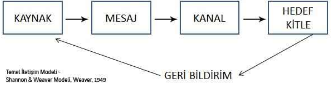
Şekil 2.1. Temel İletişim Süreci ve Öğeleri