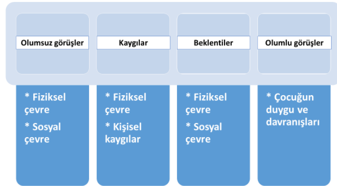
Şekil 4.1.ÖG çocuğa sahip ebeveynlerin açık hava oyun parklarına yönelik görüşleri

Araştırmada ÖG çocuğa sahip ebeveynlerin açık hava oyun parklarına ilişkin görüşlerini almak üzere gerçekleştirilen yarı yapılandırılmış görüşmelerden elde edilen verilerin içerik analizi ile incelenmesi sonucunda dört ana kategori belirlenmiştir: 1) Ebeveynlerin açık hava oyun parklarına yönelik olumsuz görüşleri 2) Ebeveynlerin açık hava oyun parkları ile ilgili kaygıları 3) Ebeveynlerin açık hava oyun parklarından beklentileri 4) Ebeveynlerin açık hava oyun parklarına yönelik olumlu görüşleri.