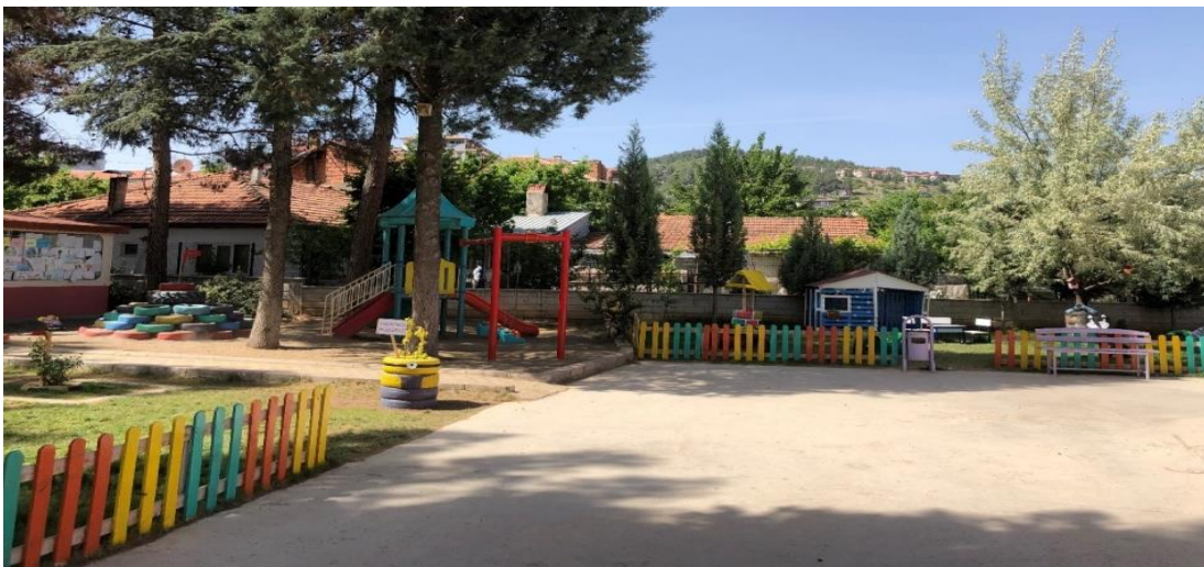
Fotoğraf 4.2. Bisiklet, kayak vb. ekipmanların kullanımına uygun alanlar

Fotoğraflara bakıldığında bisiklet, kayak vb ekipmanların kullanımı için alanların olduğu fakat malzemelerin olmadığı görülmüştür (Bkz. Fotoğraf 4.2.).