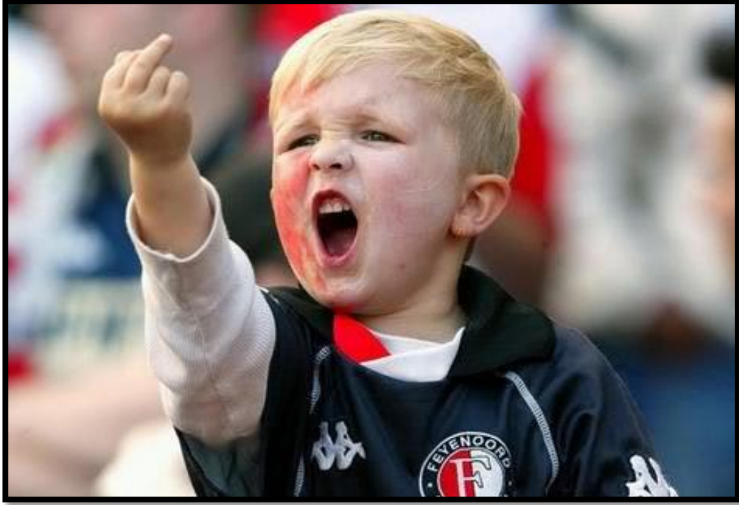
Resim 10. Oyunağına Şiddet Uygulayan Çocuğun Resmi